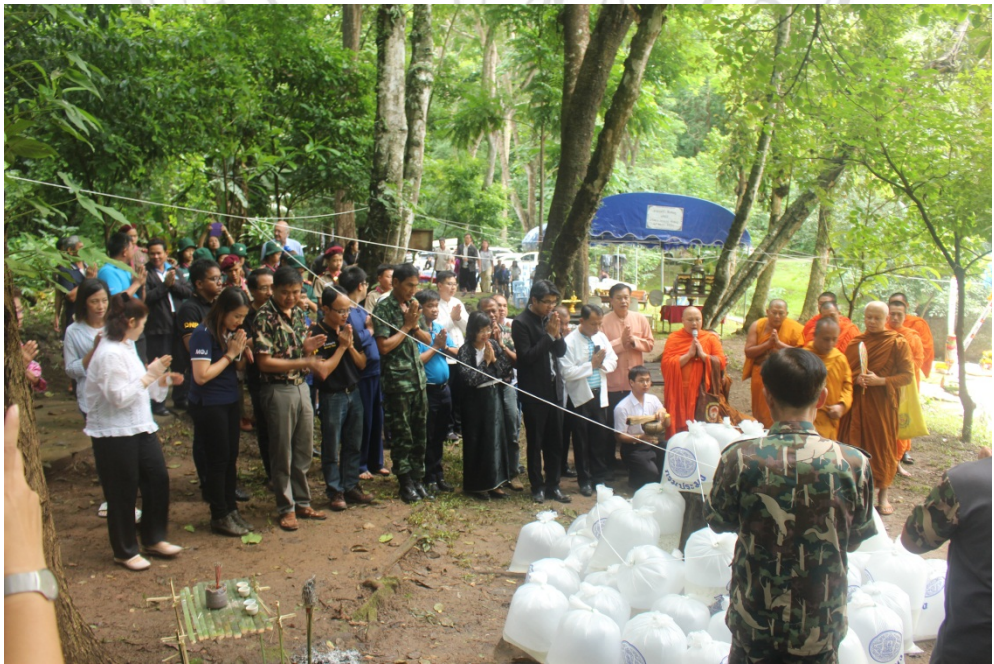
The ceremony of water consecration and fish conservation