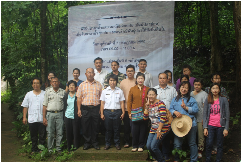
Doi Suthep – Pui National Park, Mae Raem Municipality, Community leaders, local communities and students from Faculty of Fine Arts, Chiang Mai University held