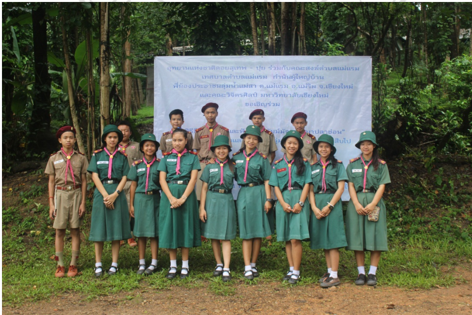
Students from Baan Tung Pong School, Mae Raem Sub-district, Mae Rim District, Chiang Mai Province at the ceremony of water consecration and fish conservation