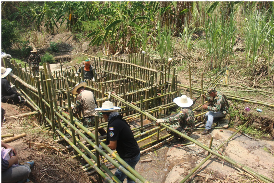
“Living of Fai, water and forest” at the brach stream of river basin between 3 – 8 May 2017