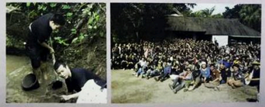
Faculty of Fine Arts Chiang Mai University Student council, Doi Suthep - Pui National Park, Mae Raem Municipality, Community leaders, local communities in Mae Sa River Basin held the project “Fine Arts Student create weir for the forest and water restoration”, Sunday 21 August, 2016 at Mae Sa Waterfall, Mae Rim District, Chiang Mai Province