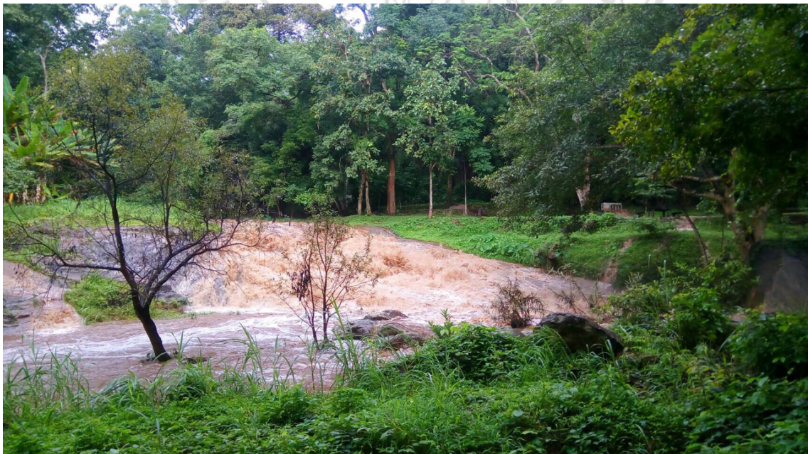
Flood in tourist attraction, Mae Sa Waterfall led the Doi Suthep - Pui National Park temporary closed between August - September