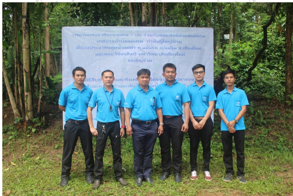
Doi Suthep – Pui National Park, Mae Raem Municipality, Community leaders, local communities and Mae Rim Provincial Waterworks Authority in Mae Sa River Basin, Mae Raem Sub – district, Mae Rim District, Chiang Mai Province joined the ceremony of water consecration and fish conservation