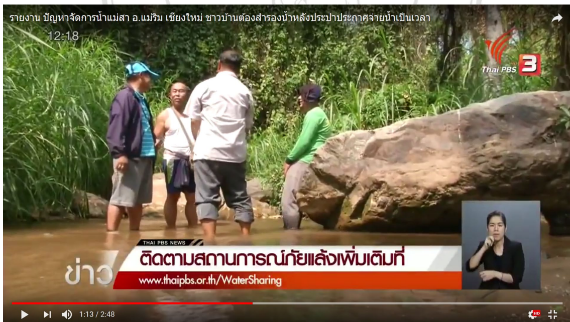
Problem about water sharing between Community and Mae Rim Provincial Waterworks Authority on 18 July, 2015