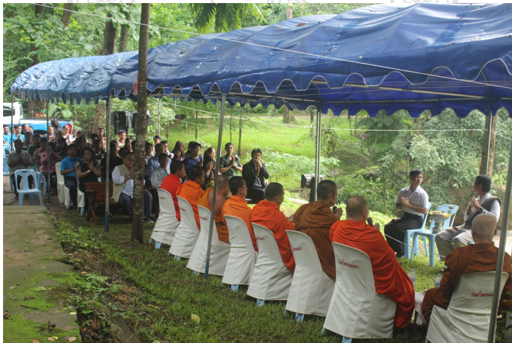
Doi Suthep - Pui National Park, Mae Raem Municipality, Community leaders, local communities and students from Faculty of Fine Arts, Chiang Mai University held the ceremony of water consecration and fish conservation on 29 June, 2017. At Mae Sa Waterfall, Mae Raem Sub - district, Mae Rim District, Chiang Mai Province