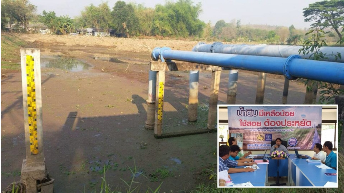
Announcement of draught crisis in July, 2015 by Mae Rim Provincial Waterworks Authority