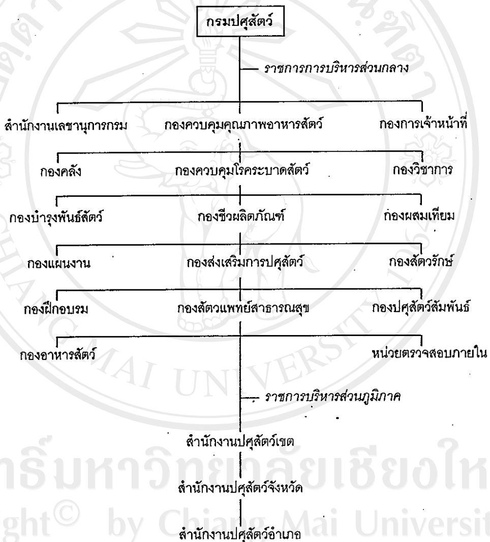
ภาพที่ 1 : หน้าที่ความรับผิดชอบและนโยบายของกรมปศุสัตว์ กระทรวงเกษตรและสหกรณ์

การดำเนินงานส่งเสริมปศุสัตว์เพื่อพัฒนาในด้านผลผลิตให้มีประสิทธิภาพดียิ่งขึ้นจะสำเร็จลุล่วงได้นั้น ต้องคำนึงถึงบุคลากรหรือกลุ่มบุคคลที่ร่วมมือกันให้บริการและดำเนินกิจกรรมต่างๆ บุคคลเหล่านี้มีความตั้งใจ และวัตถุประสงค์อย่างไรในการเข้าร่วมมือดำเนินกิจกรรม (Barnard, อ้างโดย อรุณ, 2524) ในปัจจุบันมีหน่วยงานที่รับผิดชอบที่เกี่ยวกับการส่งเสริมปศุสัตว์ คือ กรมปศุสัตว์ สังกัดกระทรวงเกษตรและสหกรณ์ ซึ่งมีการจัดส่วนราชการออกเป็น 3 ระดับ ดังแสดงแผนผังการจัดแบ่งส่วนราชการในกรมปศุสัตว์ ดังนี้