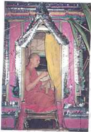
ภาพที่ 8 ประเพณีการตั้งธรรมของกลุ่มชนชาวไทเขินเมืองเชียงตุง ประเทศพม่า ปี 2538