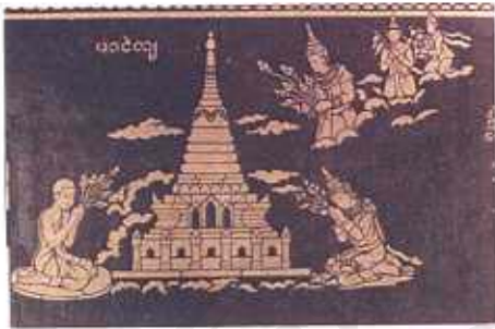
ภาพที่ 14 จิตรกรรมฝาผนังวรรณกรรมเรื่อง เวสสันดรชาดก วัดจอมคำ เมืองเชียงใหม่