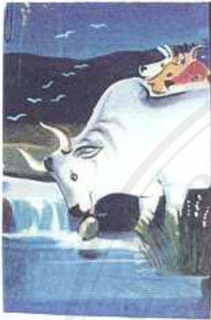
ภาพที่ 16 จิตรกรรมฝาผนังวรมกรรมเรื่อง สุชวันละวัวกลาง วัดเชียงชุม เมืองเชียงตุง