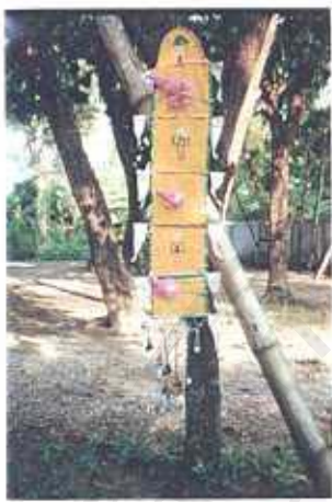
ภาพที่ 13 สัญลักษณ์จากวรรณกรรมและการสักการะ เช่น ไท่วีโนประเพณีตั้งธรรมที่วัดปางควาย