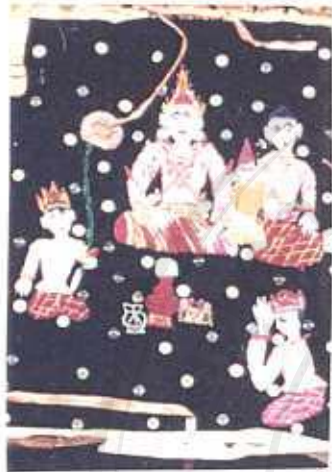
ภาพที่ 12 ภาพชุดวรรณกรรมเรื่อง สุชวันตะว่าหลวง บนผืนตุงซึ่งถวายเป็นพุทธบูชาที่วัดป่าแดง เมืองเชียงใหม่