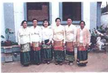
ภาพที่ 10 บทบาทร่วมของกลุ่มชนชาวไทเขินเมืองเชียงตุงในประเพณีสงกรานต์ ปี 2538