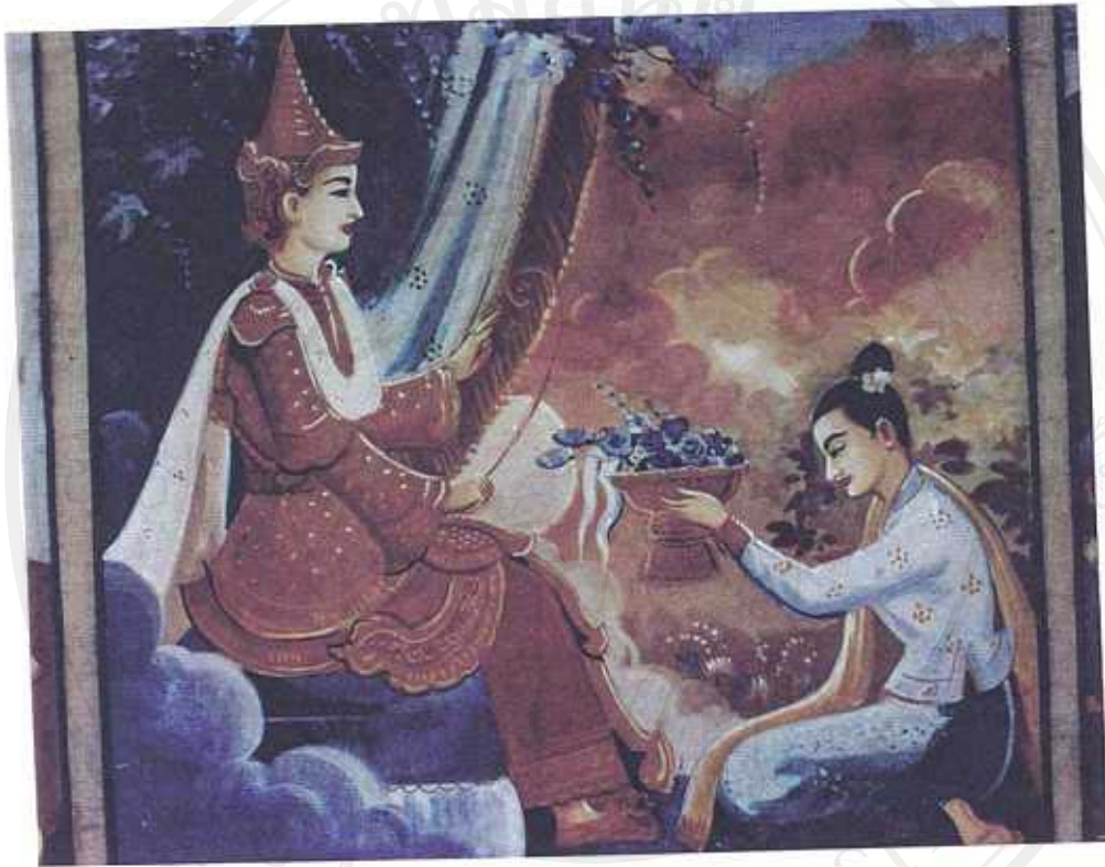
ภาพที่ 17 ภาพจิตรกรรมฝาผนังวรรณกรรมเรื่อง สู้วัวธนะวัวหลวง ตอนนางอุมมาทันตีขอพร 5 ประการจากพระอินทร์ (ภาพจิตรกรรมฝาผนังวัดเชียงชุม เมืองเชียงตุง)

...ศุรา นางอุมมาทันตีหนึ่งน้อย มิงจัก ได้คล้อยคลาดจากดวงบน จักได้พรากตน คูอินทาเจ้าฟ้า จักได้เมื่อเกิดในแหล่งหล้าเมืองคนพันชะแล เหตุตั้งอันนาง จูงมารับเอาพร 5 ประการในสำนักคูพันแล้ว นางแก้วจูงไฟเกิดเมืองคนพัน เหอะว่าอัน... (สู้วัวธนะวัวหลวง : น.1 ผูก 2)