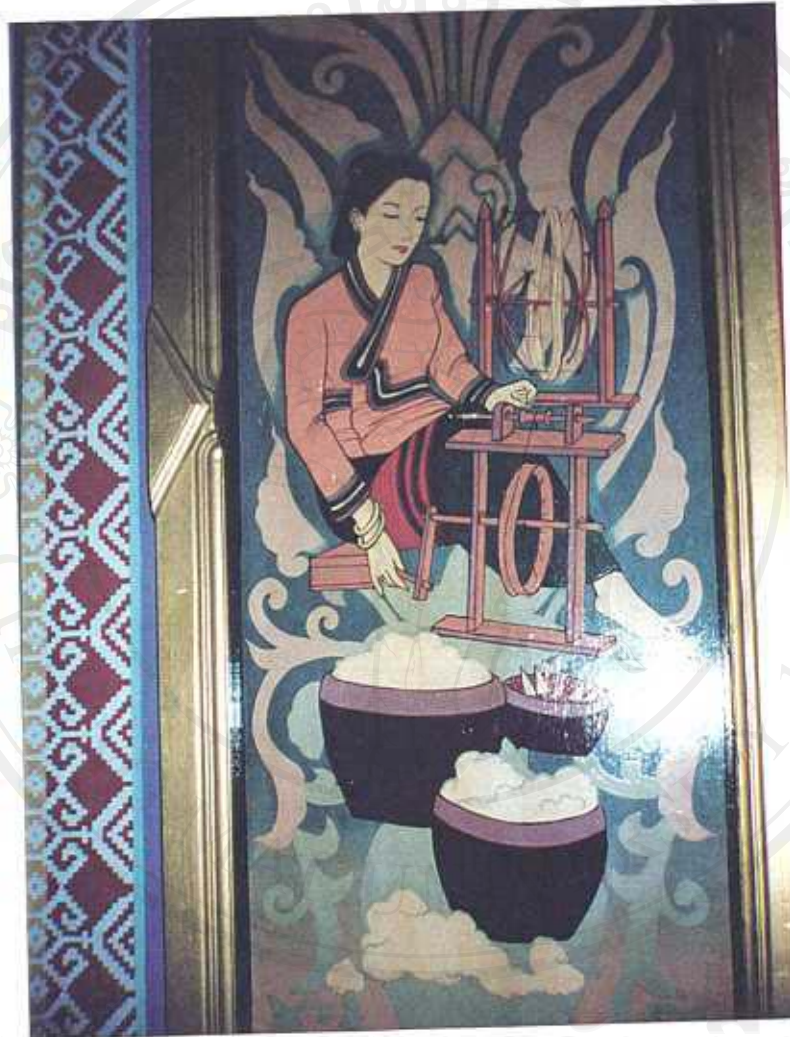
ภาพที่ 18 ภาพจิตรกรรมหญิงสาวชาวไทเขินกับวัฒนธรรมการทอผ้า (ภาพจิตรกรรมฝาผนัง วัดท่ากระตาส อําเภอเมือง จังหวัดเชียงใหม่)