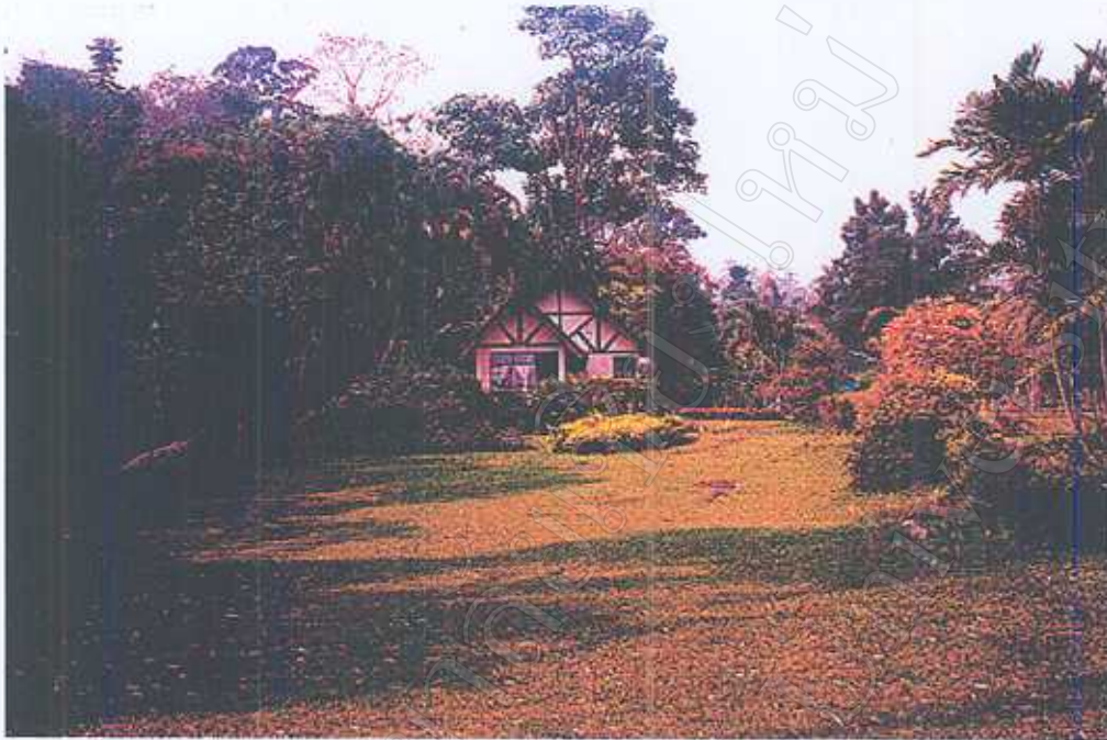
บ้านพักในอุทยานแห่งชาติแจ้ซ้อน