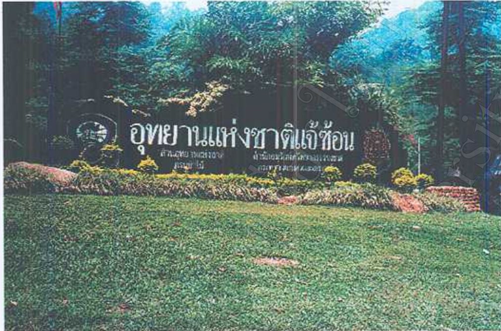
ป้ายอุทยานแห่งชาติแจ้ซ้อน