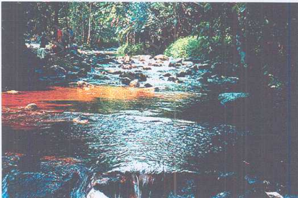
บริเวณธารน้ำถ้ำห้วยแม่มอน