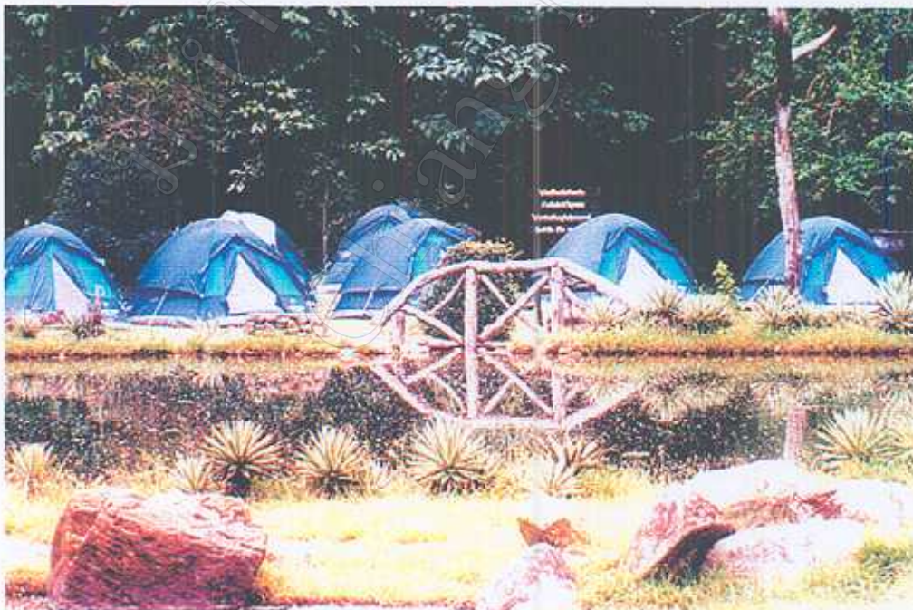
บริเวณกางเต็นท์พักแรม/ปิกนิก ในอุทยานแห่งชาติแจ้ซ้อน