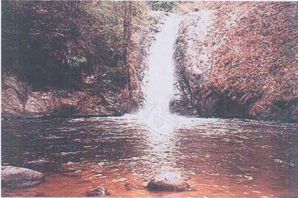
บริเวณน้ำตกเงี้ยวชั้นที่ 1