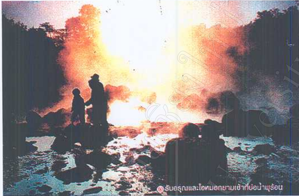
รับอรุณและไอหมอกยามเช้าที่บ่อน้ำพุร้อน