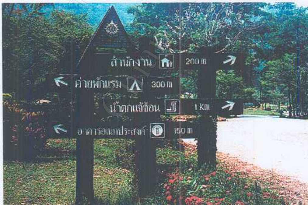
ป้ายบอกทางบริเวณอุทยานแห่งชาติแจ้ซ้อน