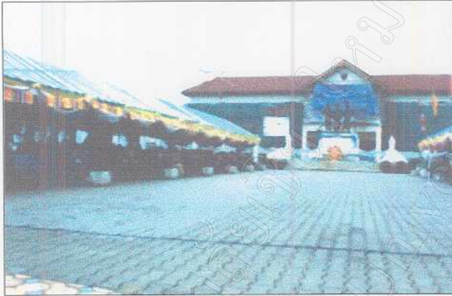
รูปภาพที่ 42 พิธีสืบชะตาเมืองเชียงใหม่หน้าอนุสาวรีย์สามกษัตริย์