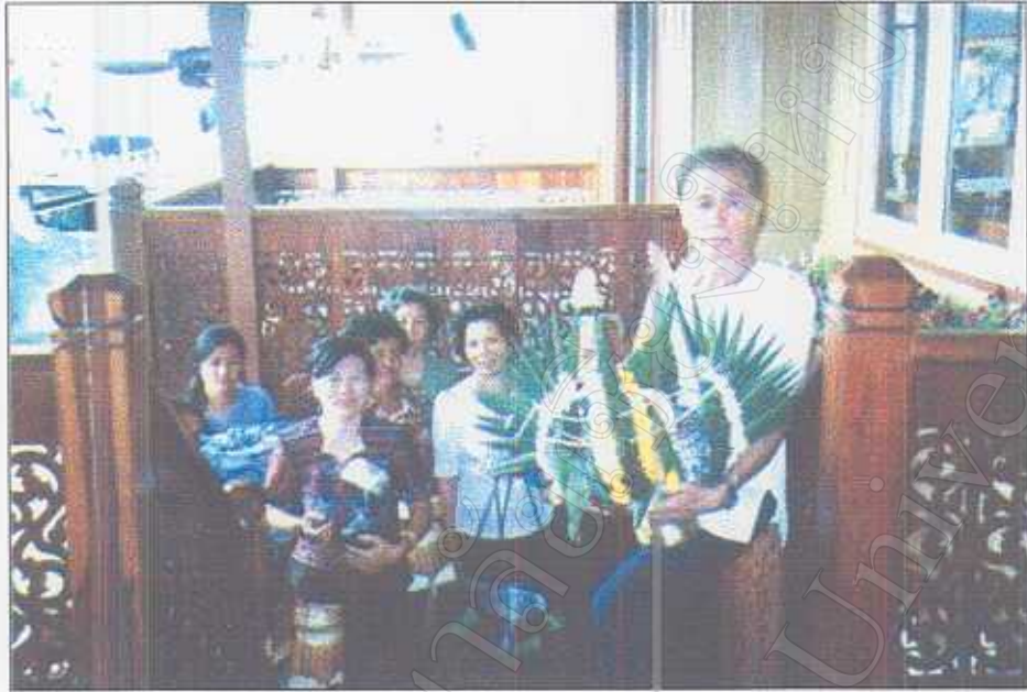
รูปภาพที่ 33 พิธีขนข้าวของเครื่องใช้ คราวเรือนขึ้นเรือนใหม่