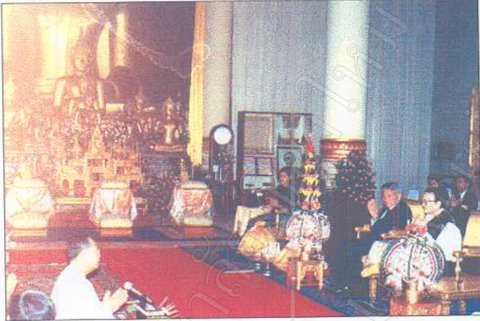
รูปภาพที่ 16 พิธีการกล่าวต้อนรับประธานประเทศลาวและภริยา (นายหนูอัทธ ภูมิ ส.หวัน )