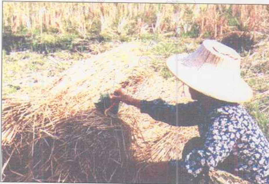
รูปภาพที่ 30 พิธีขอให้ขวัญข้าวอย่าได้ไปไหนให้มีเก็บมีกินตลอดปี