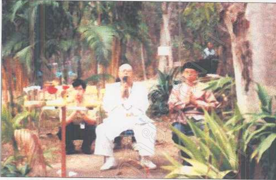
รูปภาพที่ 26 พิธีเรียกขวัญลูกช้างเพนดริน