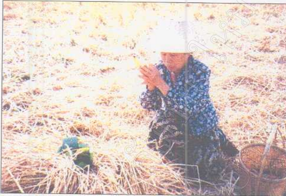
รูปภาพที่ 29 พิธีเรียกขวัญข้าวให้ข้าวมาอยู่ในยุ้งฉาง