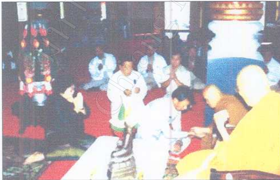
รูปภาพที่ 19 พิธีมัดมือผู้ว่าราชการจังหวัดเชียงใหม่