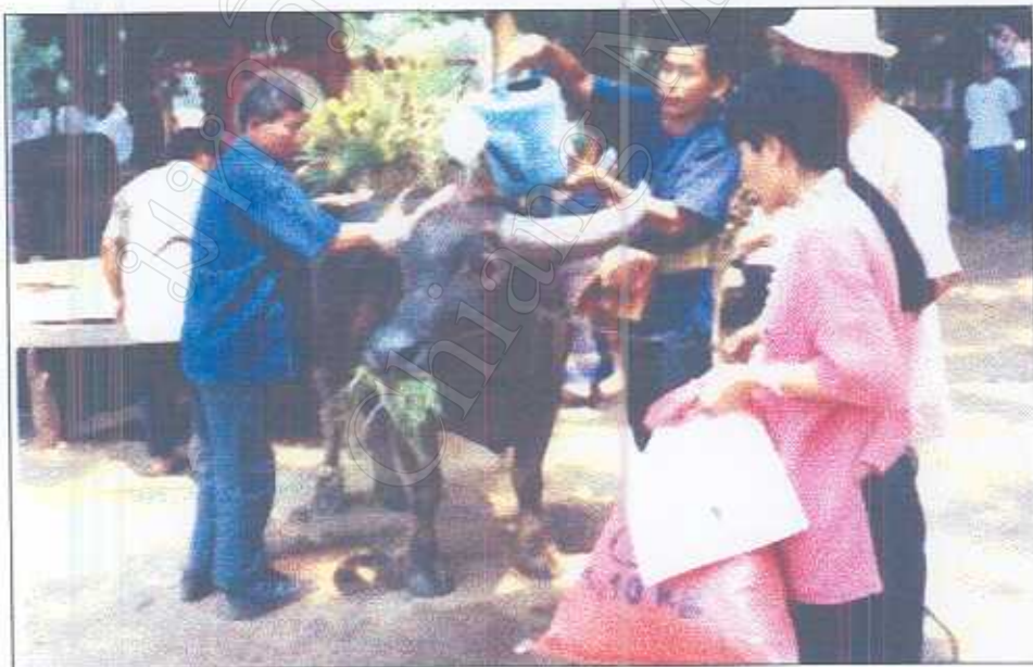
รูปภาพที่ 23 พิธีเรียกขวัญและให้อาหารควาย