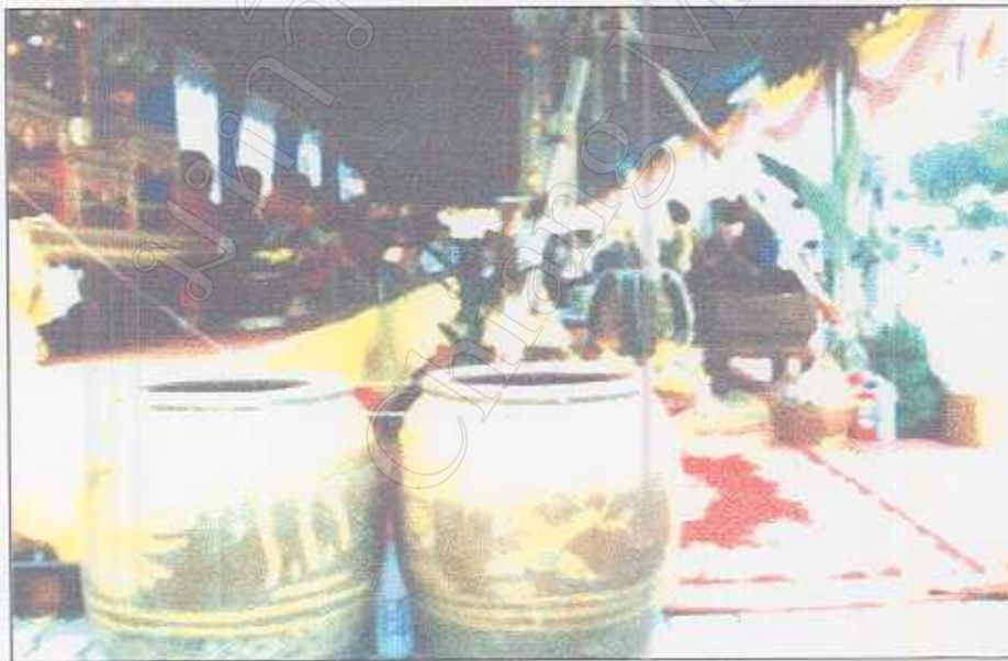
รูปภาพที่ 43 ในพิธีสืบชะตาเมืองเชียงใหม่