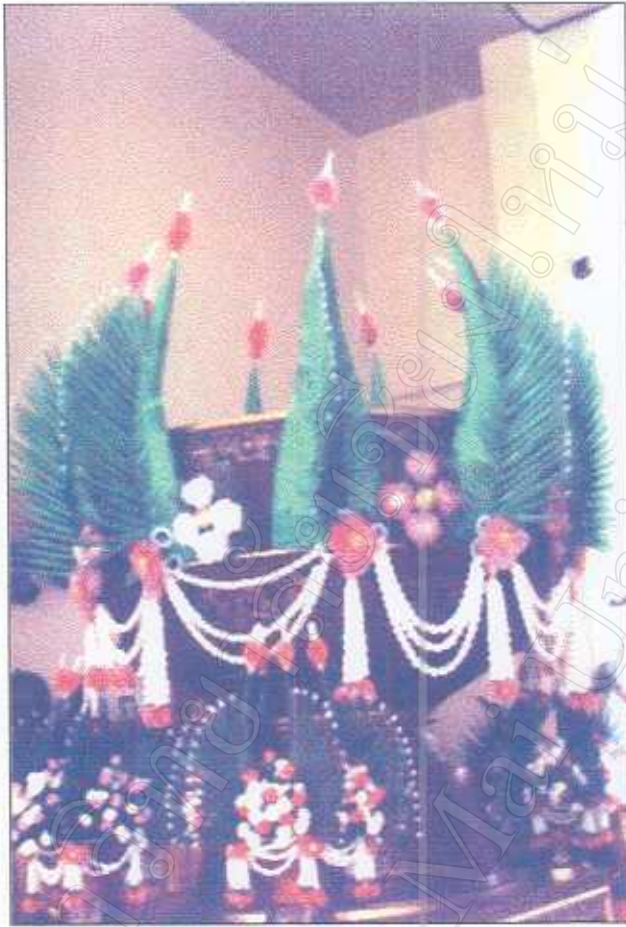
รูปภาพที่ 1 ตัวอย่างบายศรีใช้เรียกขวัญ โอกาสต้อนรับบุคคลสำคัญ