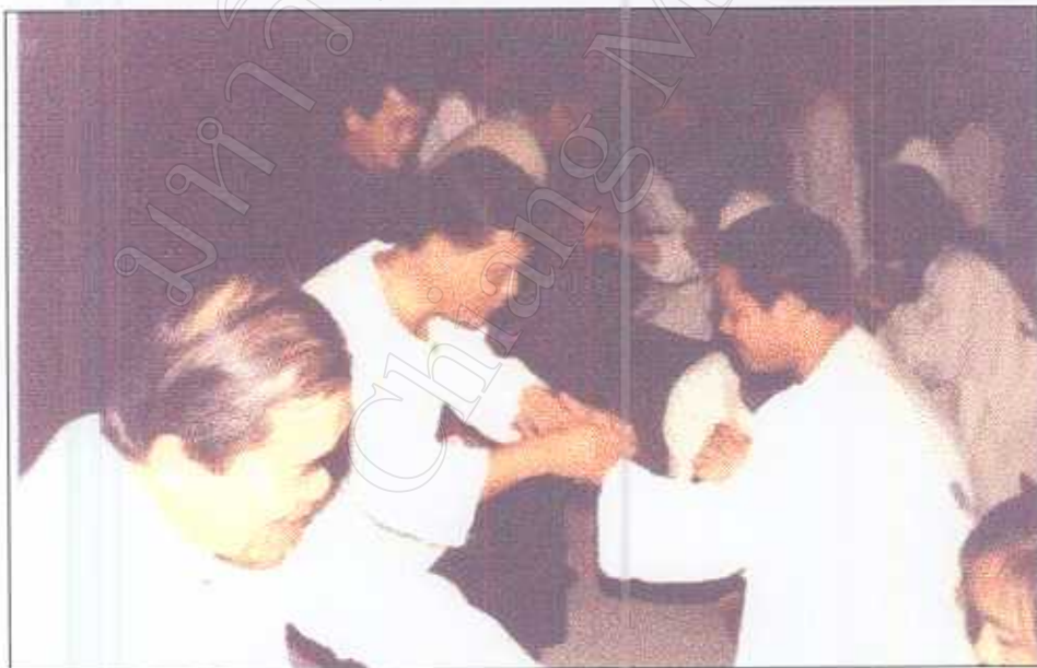
รูปภาพที่ 21 พิธีมัดมือนักศึกษาใหม่