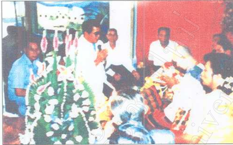
ภาพที่ 4 พิธีเรียกขวัญตูกแก้ว (ตูกแก้ว)