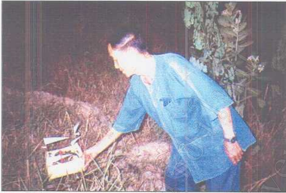
รูปภาพที่ 39 พิธีนำเสด็จไปวางนอกสถานที่บ้านของเจ้าชะตา

มหาวิทยาลัยเชียงใหม่ Chiang Mai University