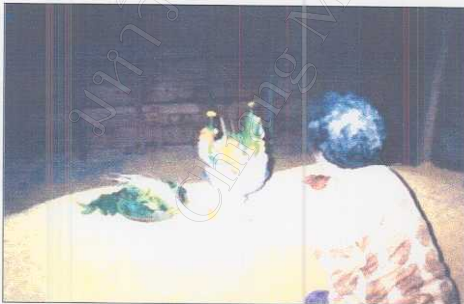
รูปภาพที่ 32 พิธีกล่าวขอผีและแม่โพสพคุ้มครองข้าวให้อุดมสมบูรณ์