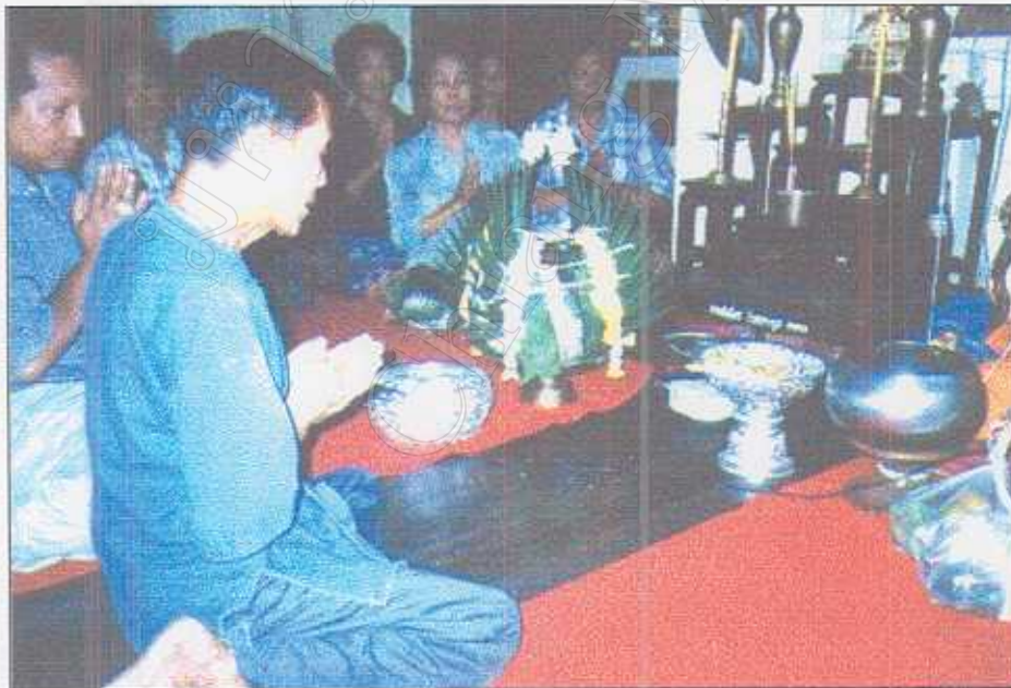
ภาพที่ 34 พิธีกล่าวเรียกขวัญขึ้นเรือนใหม่