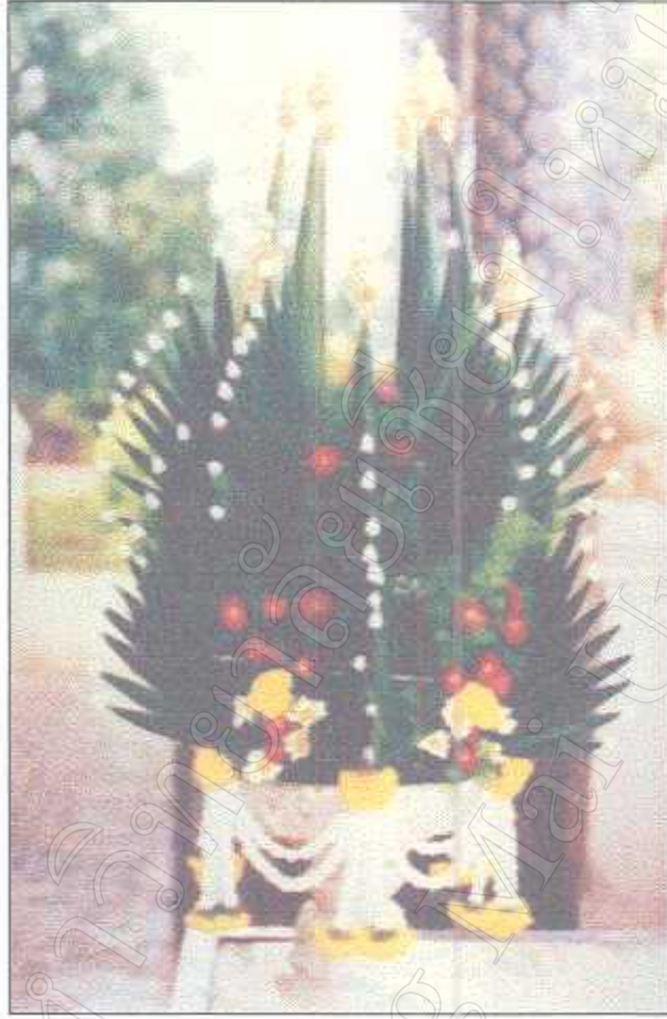
รูปภาพที่ 2 ตัวอย่างบายศรีที่ใช้งานเรียกขวัญทั่วไป