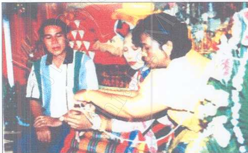
รูปภาพที่ 7 พิธีมัดมือนาค (ลูกแก้ว)