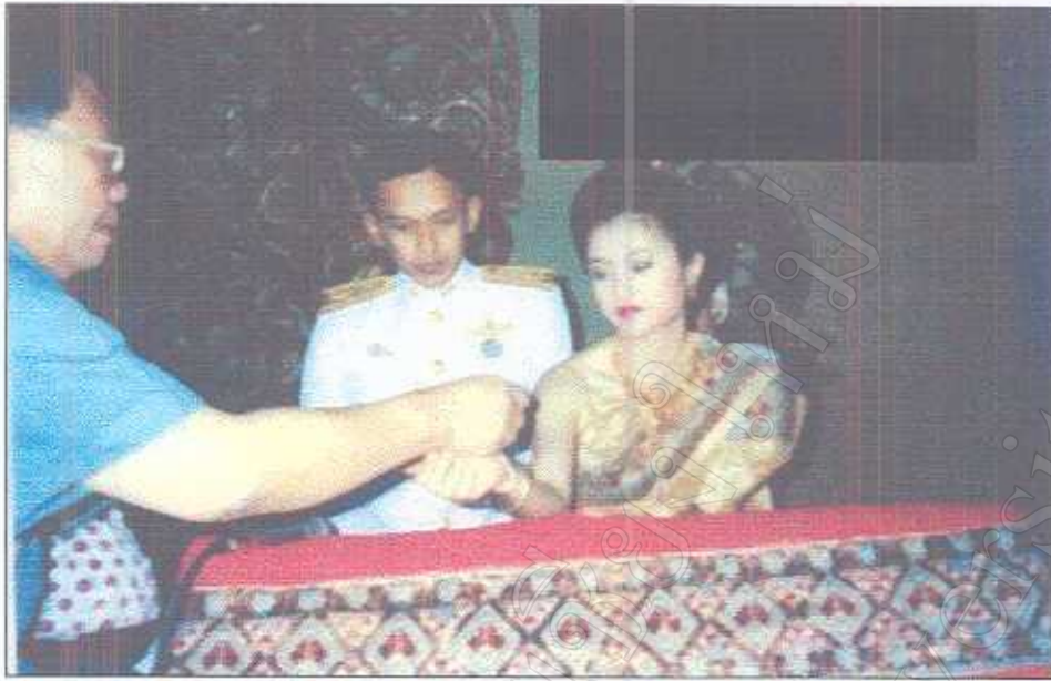
รูปภาพที่ 10 พิธีมคอเจ้าสาว

มหาวิทยาลัยเชียงใหม่ Chiang Mai University