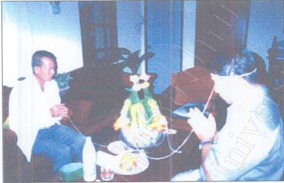
รูปภาพที่ 11 การเรียกขวัญผู้ป่วย