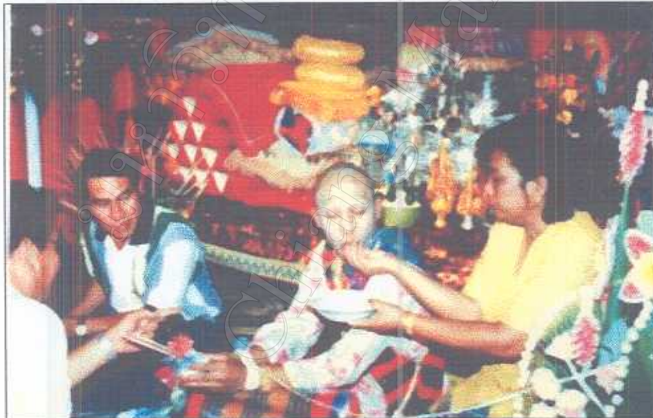
รูปภาพที่ 5 การป้อนข้าวนาค (ตูกแก้ว)