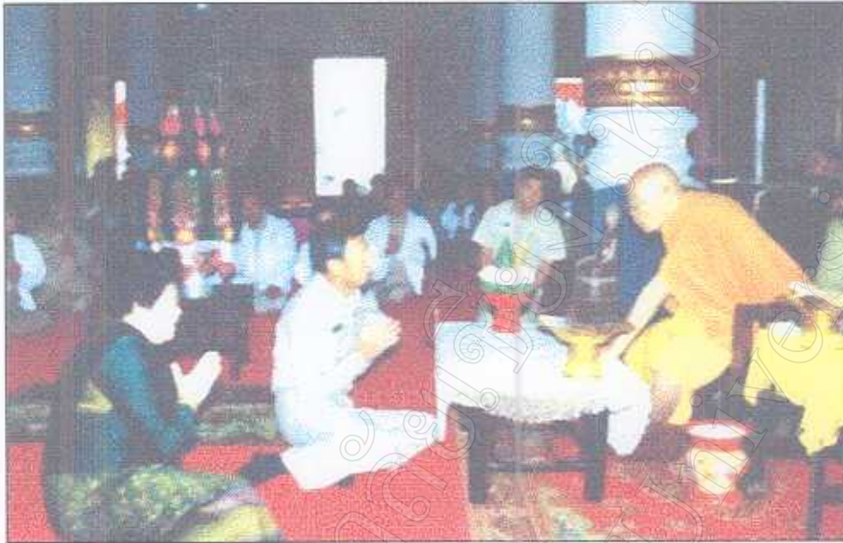
รูปภาพที่ 18 พิธีกล่าวต้อนรับการรับตำแหน่งใหม่ของผู้ว่าราชการจังหวัดเชียงใหม่ (นายประวิทย์ สีห์โสภณ)