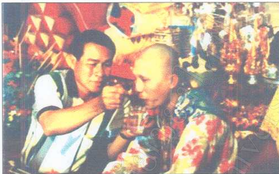
รูปภาพที่ 6 การป้อนน้ำนาค (ลูกแก้ว)