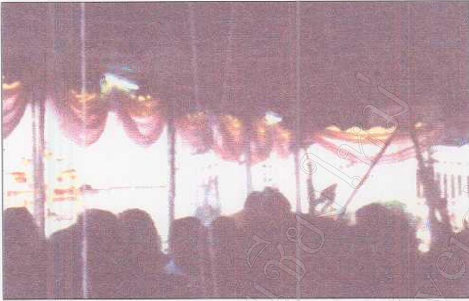
รูปภาพที่ 44 พิธีโยงด้ายสายสัญญาณ ผู้ร่วมงานในพิธีสืบชะตาเมืองเชียงใหม่

มหาวิทยาลัยเชียงใหม่ Chiang Mai University