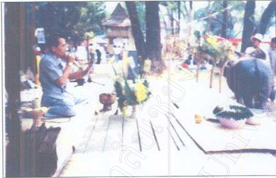
รูปภาพที่ 22 พิธีเรียกขวัญวัวควาย