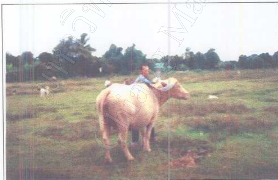
รูปภาพที่ 25 พิธีการมัดค้ายสายสิญจน์ที่เขากวาย(แบบพื้นบ้าน ทั่วไป)