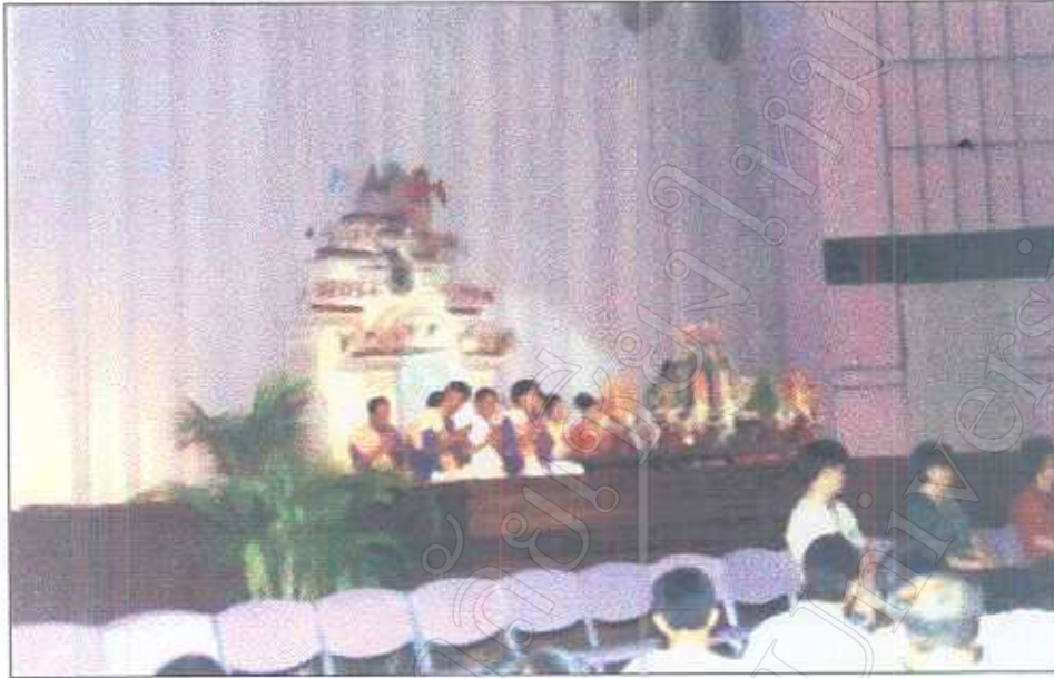
รูปภาพที่ 20 พิธีเรียกขวัญนักศึกษาใหม่