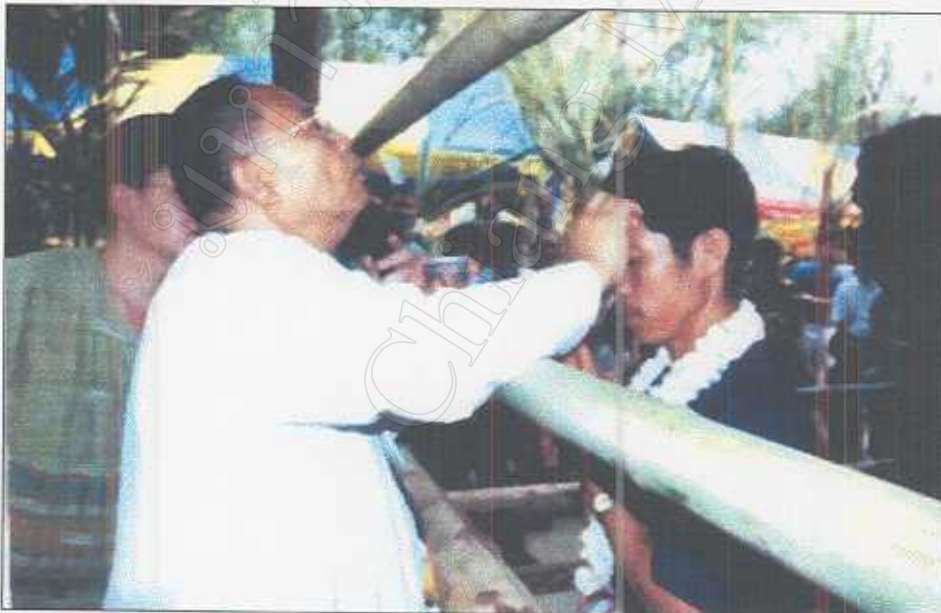
รูปภาพที่ 27 พิธีการเจิมควานช้าง