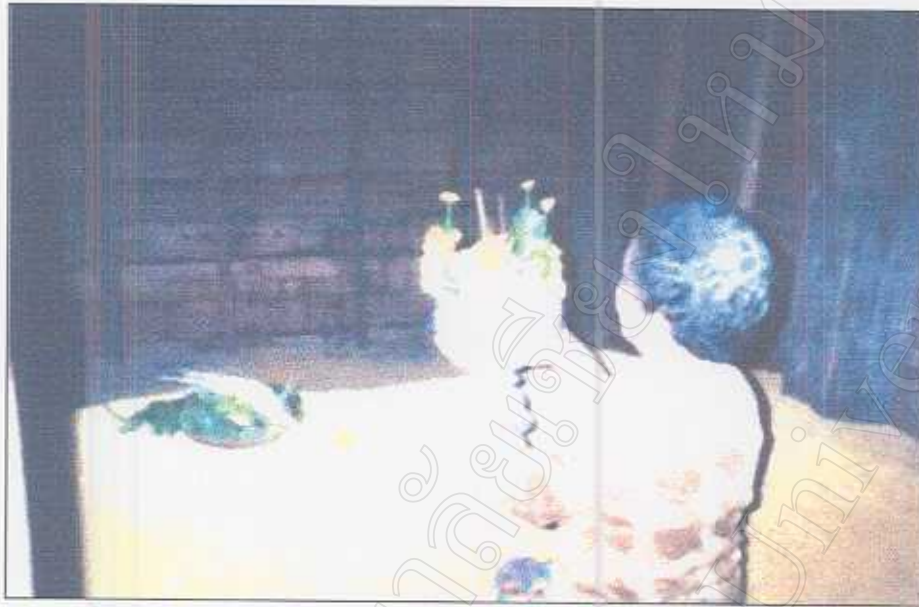
รูปภาพที่ 31 พิธีกล่าวเรียกขวัญข้าว