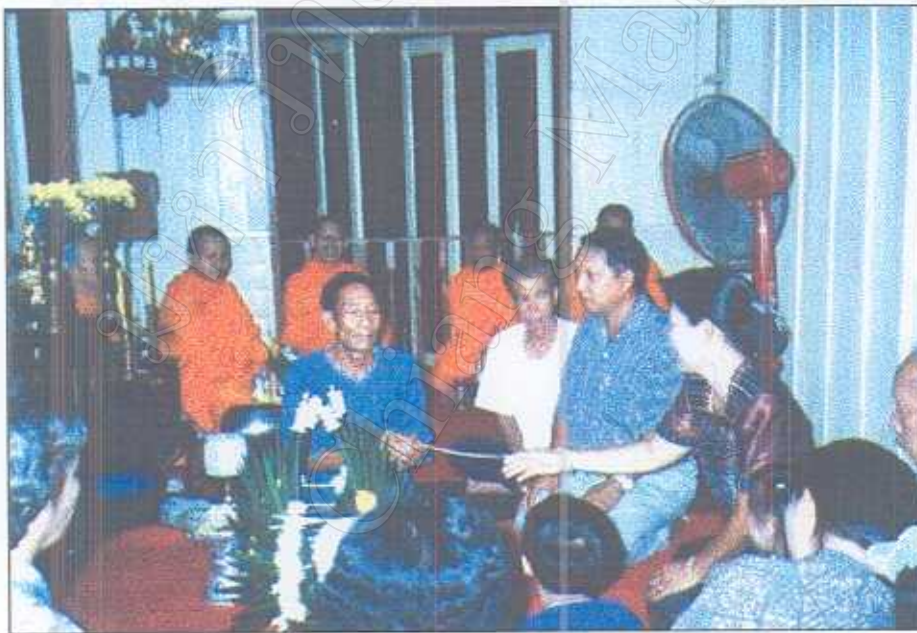
รูปภาพที่ 36 พิธีมัดมือเจ้าของเรือนใหม่