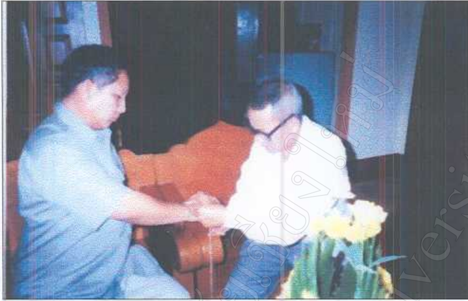
รูปภาพที่ 13 มัดมือผู้ป่วยในพิธีเรียกขวัญ

มหาวิทยาลัยราชภัฏเชียงใหม่ Chiang Mai University