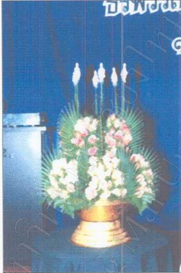
รูปภาพที่ 3 ตัวอย่างบายศรีที่ใช้ในการเรียกขวัญแต่งงาน