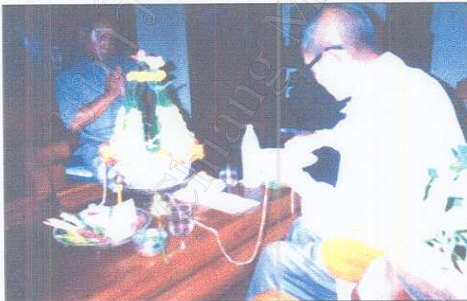
รูปภาพที่ 12 การเสียน้ำมันเมล็ดข้าวสาร