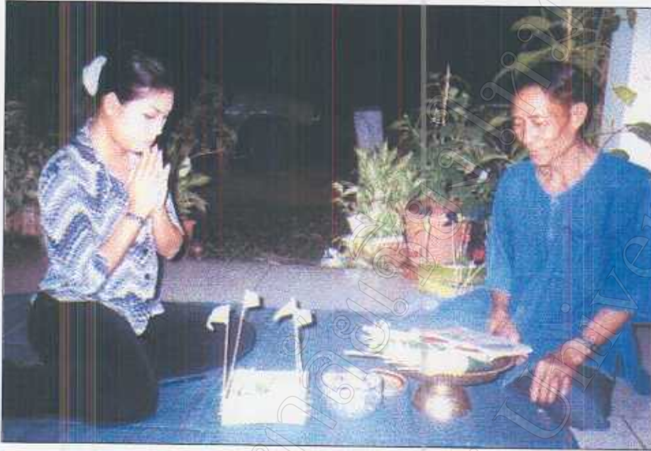
รูปภาพที่ 37 พิธีสะเดาะเคราะห์