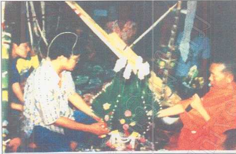
รูปภาพที่ 40 พิธีสืบชะตาบุคคลทั่วไป