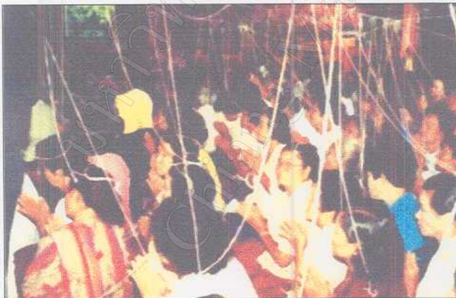
รูปภาพที่ 41 พิธีโยงด้ายสายสิญจ์ให้กับผู้ร่วมงานในพิธีสืบชะตา