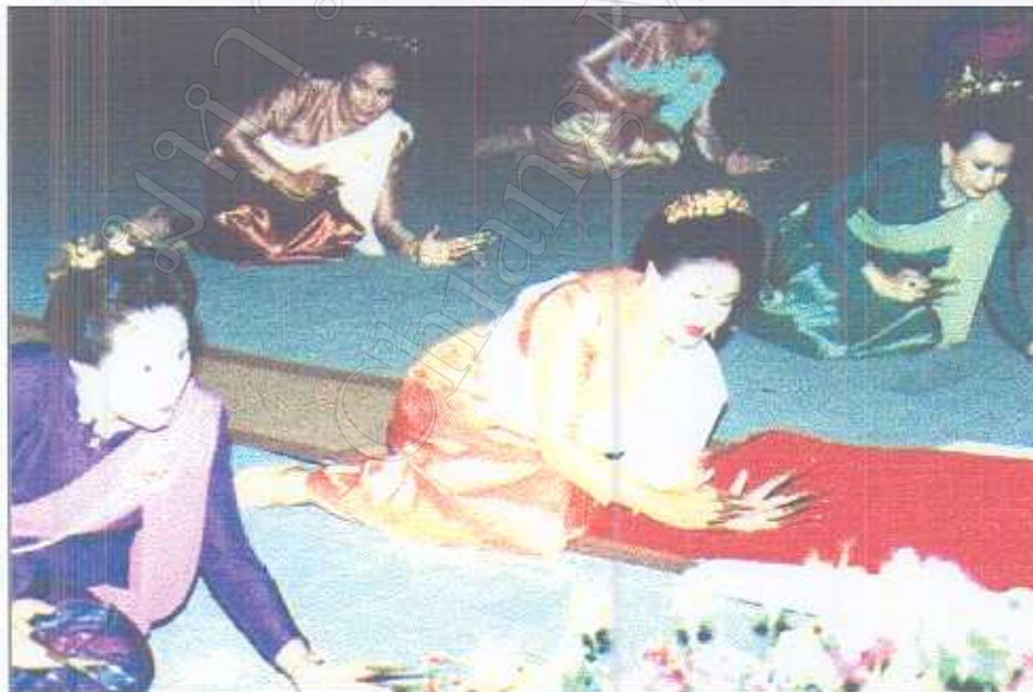
รูปภาพที่ 15 เพื่อนเลื่อมถวายต้อนรับสมเด็จพระนางเจ้าพระบรมราชินีนาถ