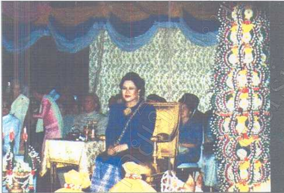
รูปภาพที่ 14 บายศรีต้อนรับสมเด็จพระนางเจ้าพระบรมราชินีนาถ

(เนื่องในโอกาสสมโภช 700 ปีของจังหวัดเชียงใหม่ เมื่อวันที่ 12 เมษายน 2539)