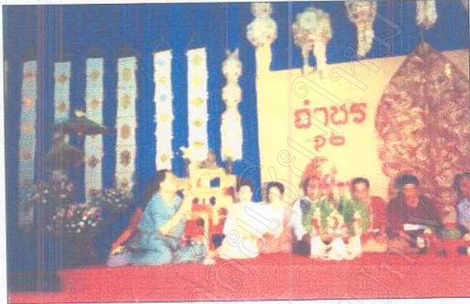
รูปภาพที่ 8 ในพิธีเรียกขวัญบ่าวสาว