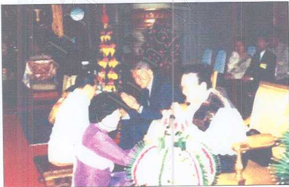
รูปภาพที่ 17 พิธีมัจมือด้วยสายสิญจ์ประธานประเทศลาวและภริยา