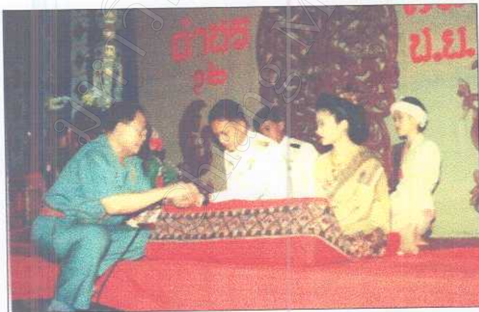
รูปภาพที่ 9 พิธีการมัดมือเจ้าบ่าว