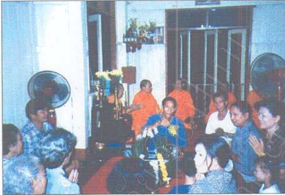
ภาพที่ 35 พิธีประพรมน้ำมนต์ผู้ร่วมในงาน