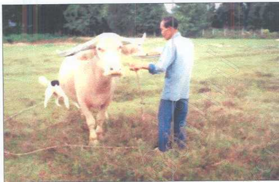
รูปภาพที่ 24 พิธีกล่าวขอขมาไทยควาย (แบบพื้นบ้านทั่วไป)