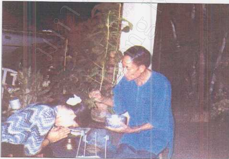
รูปภาพที่ 38 พิธีรดน้ำมนต์