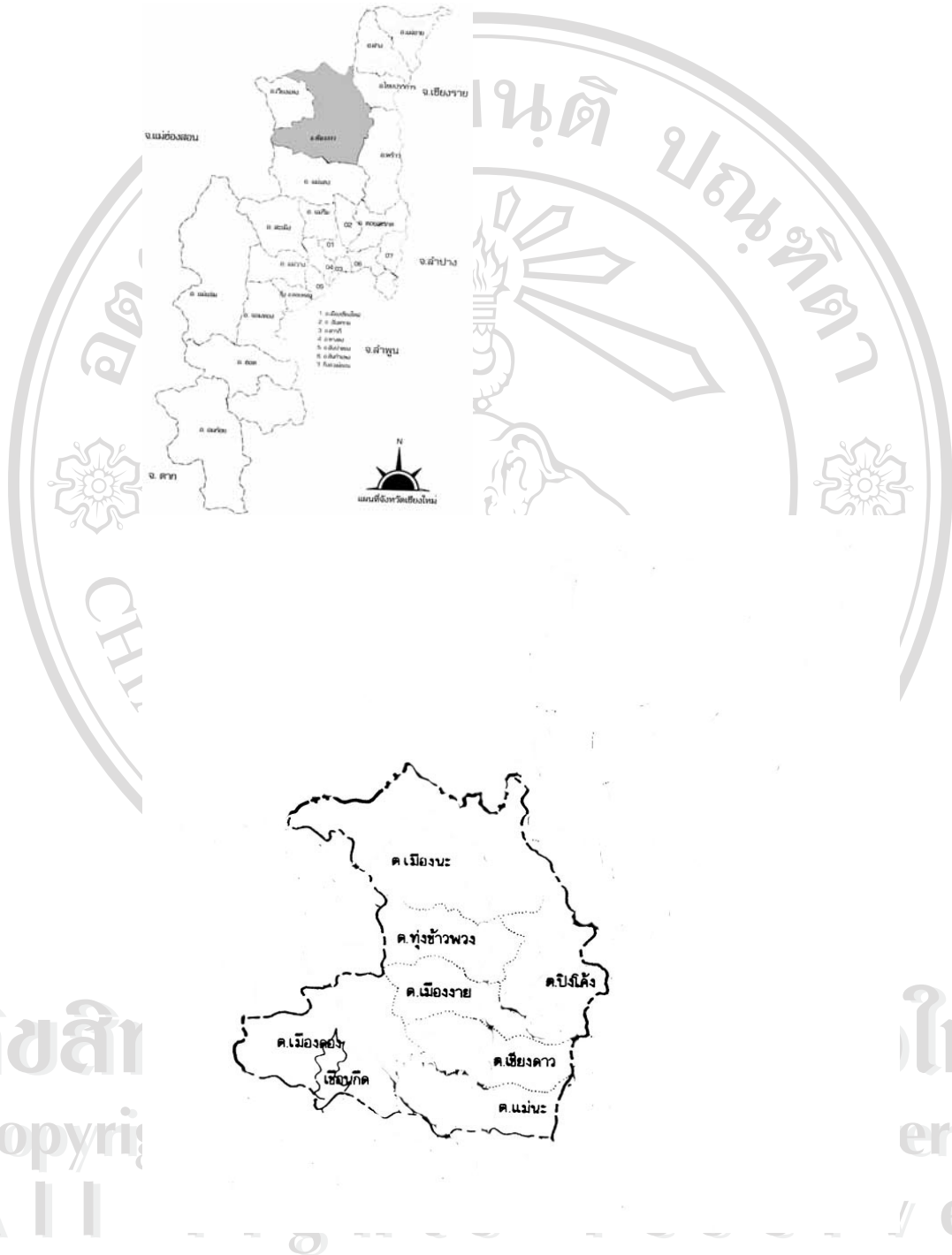
ภาพ 4.1 แผนที่อำเภอเชียงดาวโดยสังเขป