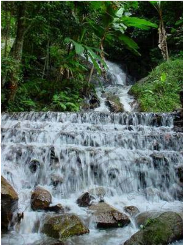
ภาพที่ 2 น้ำตกแม่กำปอง : เป็นน้ำตกที่มีความสูงกว่า 100 เมตร มีทั้งหมด 7 ชั้น