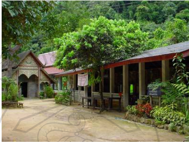
ภาพที่ 8 วัดแม่กำปอง เป็นสถานที่แสดงสถาปัตยกรรมล้านนา และมีลานสำหรับประกอบกิจกรรมของชาวบ้าน