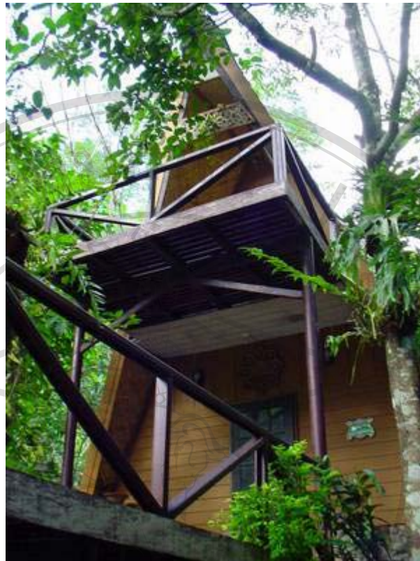
ภาพที่ 14 บ้านพักตากอากาศที่บุคคลจากภายนอกเข้ามาปลูกสร้างในเขตชุมชน