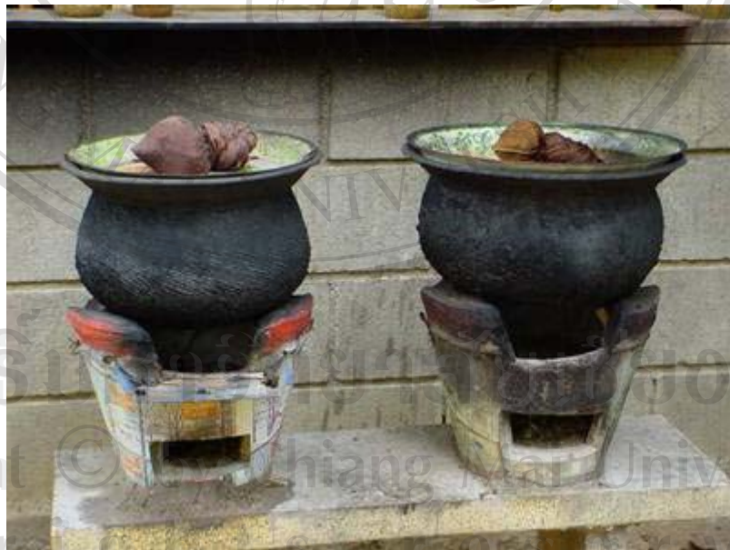
ภาพที่ 9 หม้อต้มยาสมุนไพรภายในบริเวณวัด