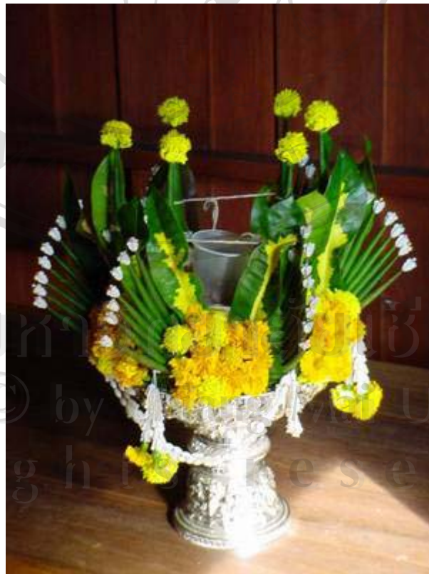
ภาพที่ 13 บายศรีถูกจัดเตรียมไว้สำหรับทำพิธีต้อนรับแขกตามประเพณีของภาคเหนือ