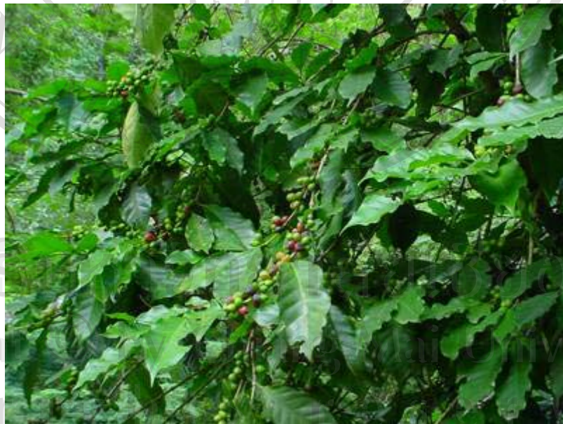
ภาพที่ 3 ต้นกาแฟ หนึ่งในพืชเศรษฐกิจของบ้านแม่กำปอง ให้ผลผลิตในช่วงเดือนพฤศจิกายน – ธันวาคมของทุกปี