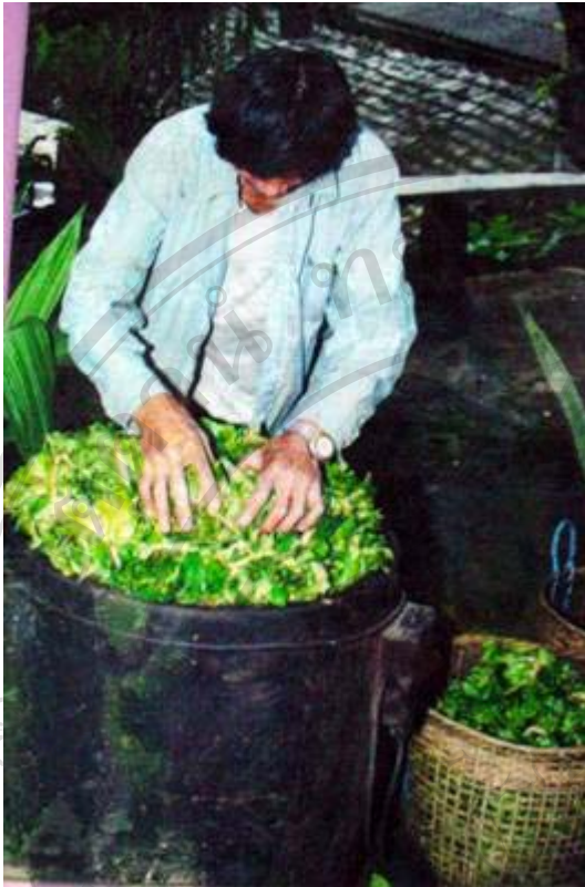
ภาพที่ 6 ชาวบ้านนำเมี่ยงที่เก็บมาได้ หมักในถังเพื่อให้ได้รสหวาน ตามธรรมชาติ ก่อนนำออกสู่ตลาด