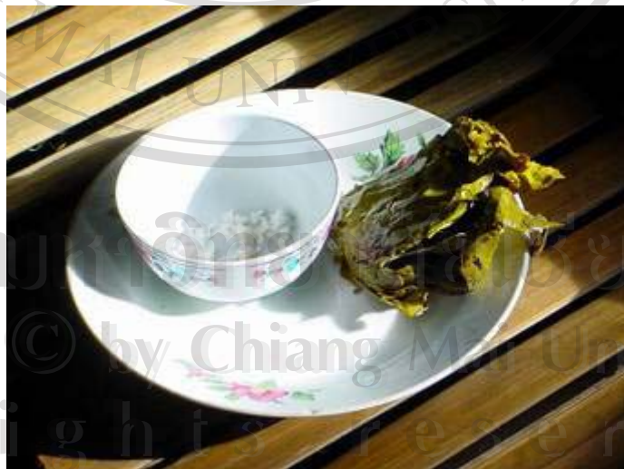
ภาพที่ 7 ใบเมี่ยงที่หมักกับเกลือพร้อมรับประทาน