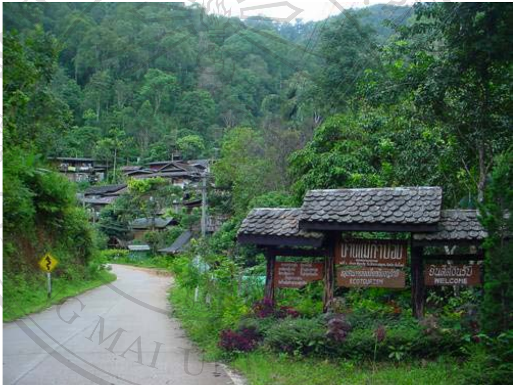
ภาพที่ 1 ทางเข้าหมู่บ้านแม่กำปอง

ลิขสิทธิ์มหาวิทยาลัยเชียงใหม่ Copyright © by Chiang Mai University All rights reserved