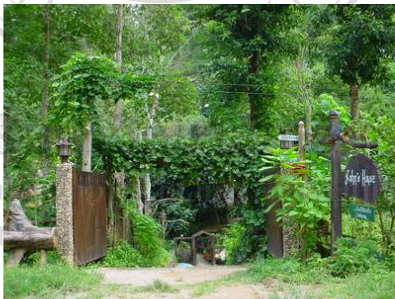
ภาพที่ 15 บ้านชาวต่างชาติในชุมชนที่รับเป็นบ้านพักโฮมสเตย์เสริมของบ้านแม่กำปอง