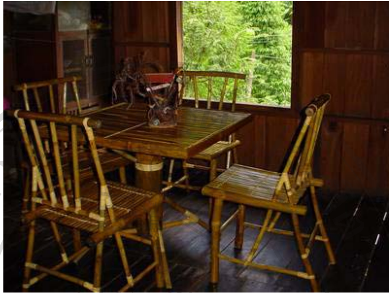
ภาพที่ 10 ชาวบ้านแม่กำปองมีการจัดตั้งกลุ่มเครื่องเรือนไม้ไฟ เพื่อเป็นอาชีพเสริมให้แก่ครัวเรือน