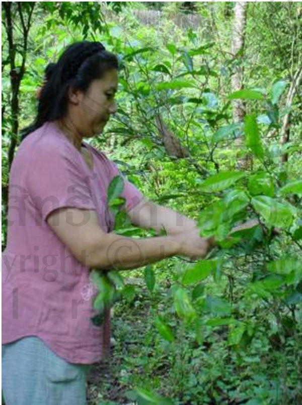
ภาพที่ 5 ชาวป่าเมี่ยงเก็บใบเมี่ยงจากสวนหลังบ้านของตนเอง จึงเรียกบริเวณดังกล่าวว่า “สวนเมี่ยง” หรือ “ป่าเมี่ยง”

ลิขสิทธิ์ © King Mai University All rights reserved