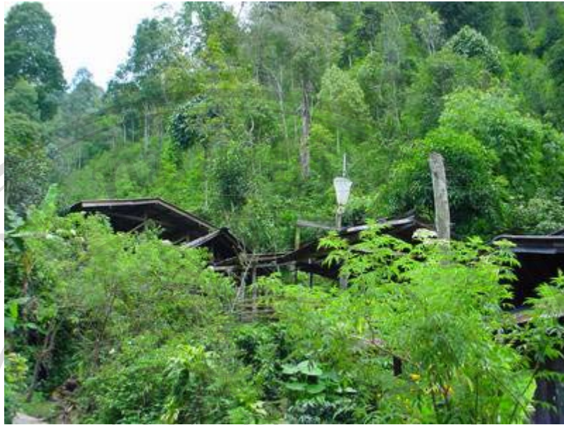
ภาพที่ 4 ชาวแม่กำปองตั้งบ้านเรือนอยู่ในหุบเขา มีธรรมชาติที่สมบูรณ์ และมีพืชเศรษฐกิจหลักคือ “ต้นเมี่ยง” ซึ่งเติบโตได้ดีได้ร่มเงาของต้นไม้ใหญ่