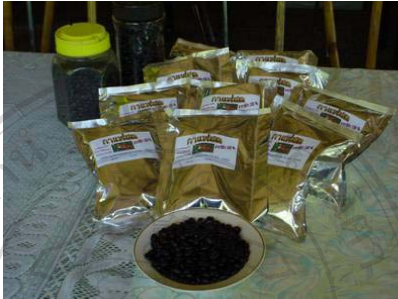
ภาพที่ 12 นักท่องเที่ยวจะได้ชิมกาแฟอาราบิก้าที่ปลูกโดยชาวบ้าน และสามารถซื้อผลิตภัณฑ์กาแฟคั่วบดบรรจุถุงบ้านแม่กำปองเป็นของที่ระลึก