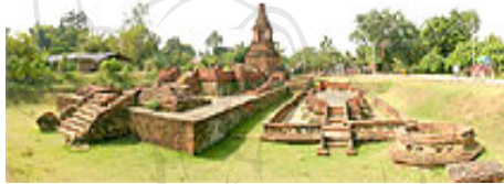
ภาพที่ 4.5 ด้านหน้าวัดปู่เปี้ย

ตั้งอยู่บริเวณแนวคูน้ำ – คันดิน ด้านทิศตะวันตกของเวียงกุมกาม ประกอบด้วย วิหาร เจดีย์ อุโบสถ และส่วนประกอบปลีกย่อยอื่นๆ เช่น แท่นบูชา และศาลผีเสื้อ ตั้งอยู่ด้านหน้า พระอุโบสถ วิหารมีร่องรอยของการก่อสร้างซ่อมแซมมาหลายสมัย ส่วนองค์เจดีย์มีลักษณะทางศิลปกรรมแบบสุโขทัยและแบบล้านนารวมกัน องค์เจดีย์น่าจะสร้างในสมัยพญาติโลกราชลงมา คือ ในราว พ.ศ. 1998 – 2068 ซึ่งปัจจุบันได้รับการบูรณะแล้ว (ภาพที่ 4.5 และ 4.6)