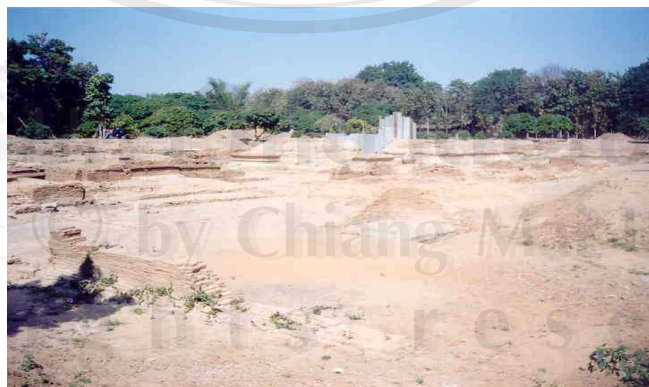
ภาพที่ 4.10 วัดหนานช้าง

ชื่อเรียกวัดหนานช้างนั้นตั้งตามชื่อของเจ้าของที่ดิน โดยวัดหนานช้างสร้างขึ้นที่หลังเมืองเชียงใหม่ วัดนี้ใช้งานอยู่มาจนถึงหลัง พ.ศ. 2168 แล้วค่อยๆ ถูกทิ้งร้างก่อนที่น้ำจะท่วมในเวลาต่อมา (ภาพที่ 4.10)