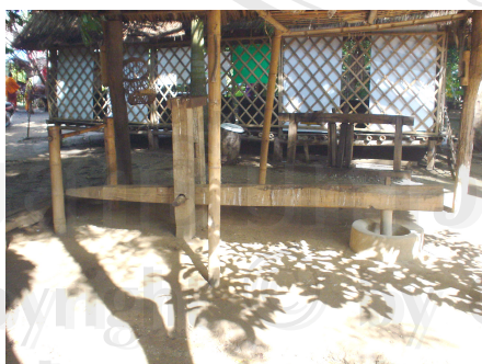
ภาพที่ 4.19 ครกตำข้าวโบราณ