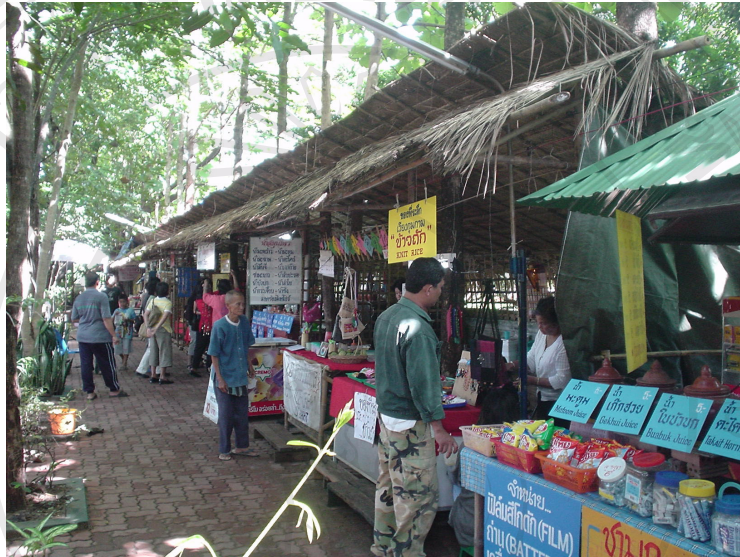
ภาพที่ 4.23 กาดมั่ว

ตั้งอยู่บริเวณด้านข้างของวัดช้างค้ำ เป็นจุดบริการอาหาร เครื่องดื่ม และสินค้าพื้นเมืองแก่นักท่องเที่ยว (ภาพที่ 4.23 และ 4.24)