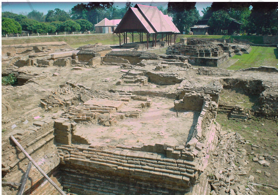
ภาพที่ 4.14 วัดกุฎีป่าด้อม

วัดกุฎีป่าด้อม (กุฎี เป็นภาษาถิ่น หมายถึงเจดีย์) ไม่ปรากฏประวัติความเป็นมาในเอกสารและตำนานทางประวัติศาสตร์ เป็นชื่อที่ชาวบ้านเรียกกัน เนื่องจากอยู่ในเขตที่ดินของป่าด้อม สภาพแวดล้อมบริเวณวัดเป็นเขตที่อยู่อาศัยและสวนลำไย ปัจจุบันยังอยู่ในระหว่างการขุดแต่งบูรณะเพิ่มเติม (ภาพที่ 4.14)