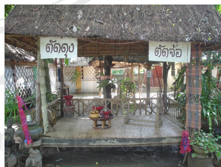
ภาพที่ 4.20 ชุ้มแสดงการสาธิตตัดตุง ตัดจ้อ