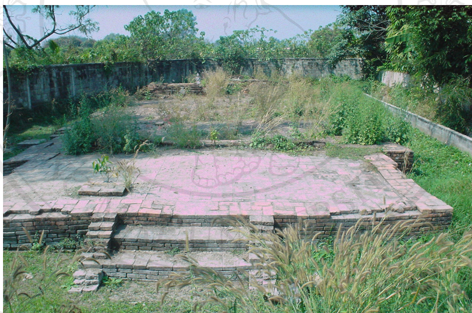
ภาพที่ 4.15 วัดกุ้อ้ายสี