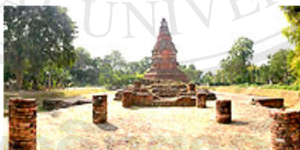
ภาพที่ 4.8 เจดีย์วัดอীগัง (อীগัง)