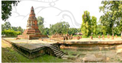
ภาพที่ 4.7 วัดอীগัง (อীগัง)

ตั้งอยู่ติดกับแนวคูน้ำ – คันดิน ด้านทิศตะวันตกของเวียงกุมกาม ประกอบด้วย วิหารและ เจดีย์ตั้งอยู่บนฐานเดียวกัน เป็นแบบล้านนาตั้งเดิมอย่างเต็มตัว สร้างประมาณสมัย พระเมืองแก้ว แต่ไม่เก่าไปกว่า พ.ศ. 2060 ตัววิหารหันทิศไปเชื่อมต่อกลายมณฑป ส่วนเจดีย์ อยู่หลังสุด บริเวณโดยรอบมีทางเดินสำหรับประทักษิณ โดยปัจจุบันได้รับการบูรณะแล้ว (ภาพที่ 4.7 และ 4.8)