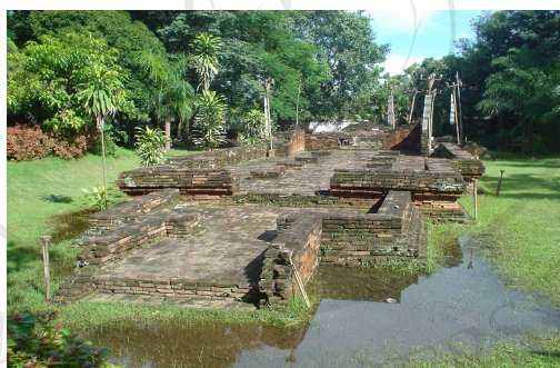
ภาพที่ 4.2 วิหารวัดกานโถม (ช้างค้ำ)

เอกสารทางพงศาวดารโยนกระบุว่า พญามังรายโปรดให้สร้างวัดกานโถมขึ้นในราวปี พ.ศ. 1833 ประกอบด้วยฐานเจดีย์กว้าง 12 เมตร สูง 18 เมตร ทำซุ้มคูหา 4 ทิศ ใช้พระพุทธรูปซ้อนเป็น 2 ชั้น ชั้นล่างไว้พระพุทธรูป 4 องค์ ชั้นบนไว้พระพุทธรูปยืนองค์หนึ่ง มีรูปอัครสาวกโมคคัลลาน์ สาตริบุตรและพระอินทร์ นอกจากนี้ในบริเวณวัดกานโถมยังมีดินสริมหาโพธิ์ที่ได้อัญเชิญเมล็ดจากเมืองลังกาในครั้งโบราณ และหลักฐานทางโบราณคดีที่สำคัญนอกจากพบพระพิมพ์ดินเผาสกุลช่างหริภุญไชยจำนวนหนึ่งแล้ว ยังพบจารึกหินทรายสีแดงเป็นอักษรมอญเป็นอักษรที่มีลักษณะระหว่างอักษรมอญกับอักษรไทยและอักษรสุโขทัย และยังพบฝักขามรุ่นแรกภายในวัดกานโถมมีต้นโพธิ์เก่าแก่ พระพุทธรูป และมีหอพญามังราย ซึ่งเป็นที่เคารพสักการะของประชาชนในละแวกนั้นมาแต่โบราณจนถึงปัจจุบัน (ภาพที่ 4.2, 4.3 และ 4.4)