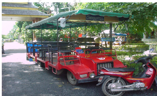
ภาพที่ 4.16 รถรางนำเที่ยว

จุดให้บริการรถรางนำเที่ยวตั้งอยู่ในบริเวณวัดช้างค้ำ ให้บริการนำเยี่ยมชมโดยรอบของเมืองโบราณเวียงกุมกามตามจุดสำคัญต่างๆ เช่น วัดกู่ป่าด้อม วัดอิ๊ก้าง วัดหนานช้าง วัดปู่เปี้ย วัดธาตุมหาเจดีย์ วัดพระเจ้าองค์ดำ วัดพญามังราย วัดเจดีย์เหลี่ยม โดยมีมัคคุเทศก์แนะนำแหล่งท่องเที่ยวและประวัติโบราณสถานต่างๆ ใช้เวลาในการเยี่ยมชมประมาณ 30 – 45 นาที อัตราค่าบริการท่านละ 15 บาท โดยจัดให้บริการตั้งแต่วันที่ 07.00 – 18.00 น. (ภาพที่ 4.16)