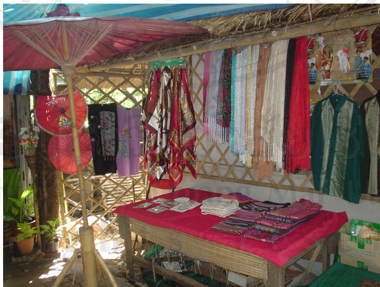
ภาพที่ 4.24 ชุมขายสินค้าพื้นเมือง