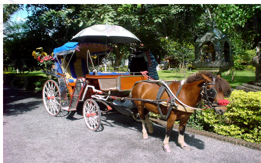
ภาพที่ 4.17 รถม้านำเที่ยว

รถม้านำเที่ยวให้บริการนำเยี่ยมชมโดยรอบของเมืองโบราณเวียงกุมกามตามจุดสำคัญต่างๆ มีจำนวน 11 คัน โดยสามารถให้บริการคันละไม่เกิน 4 ท่าน อัตราค่าบริการคันละ 200 บาท ใช้เวลาในการเยี่ยมชมประมาณ 45 นาที โดยให้บริการตั้งแต่วันที่ 07.00 – 18.00 น. (ภาพที่ 4.17)