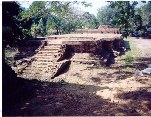
ภาพที่ 4.11 วัดกุมกาม (ร้าง)

ตั้งอยู่ในเขตเวียงกุมกามทางด้านทิศตะวันออกเฉียงเหนือ ห่างจากวัดช้างค้ำประมาณ 100 เมตร วัดกุมกามเป็นชื่อเรียกตามโบราณสถานเวียงกุมกาม ไม่ปรากฏชื่อและความเป็นมาของวัดนี้ ในเอกสารประวัติศาสตร์โบราณสถาน ประกอบด้วยวิหารตั้งอยู่หน้าเจดีย์หันไปทางทิศตะวันออกเฉียงเหนือ วิหารขนาดใหญ่ เจดีย์พังทลายเหลือเพียงฐานและเรือนธาตุบางส่วน ลักษณะเจดีย์เป็นทรง 8 เหลี่ยม ที่ได้รับอิทธิพลมาจากวัดจามเทวี พิจารณารูปแบบทางสถาปัตยกรรม สามารถกำหนดอายุได้ราวสมัยพุทธศตวรรษที่ 19 สภาพปัจจุบันได้รับการบูรณะแล้ว แต่ก็ยังคงถูกปล่อยให้รกร้าง (ภาพที่ 4.11 และ 4.12)