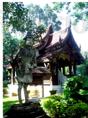
ภาพที่ 4.4 หอพญามังราย