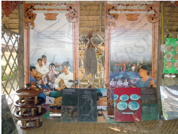
ภาพที่ 4.22 ซุ้มจัดแสดงนิทรรศการเครื่องดนตรีล้านนา