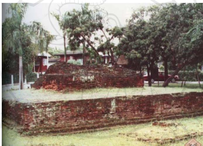
ภาพที่ 4.9 วัดธาตุน้อย (วัดน้อย)

เป็นวัดเล็กๆ อยู่ห่างจากวัดกานโถมก่อนทางทิศตะวันตก ประกอบด้วย วิหารและเจดีย์ ตัววิหารหันไปทางทิศเหนือ ส่วนเจดีย์อยู่ด้านหลังวิหาร ทั้งหมดประกอบด้วยอิฐดินเผาไม้ถือปูน ด้านนอกฉาบด้วยปูนขาว ลักษณะทางสถาปัตยกรรมและศิลปกรรมที่พบภายหลังการขุดแต่งโบราณสถาน น่าจะอยู่ในช่วงพุทธศักราชที่ 19 – 20 โดยปัจจุบันได้รับการบูรณะแล้ว (ภาพที่ 4.9)