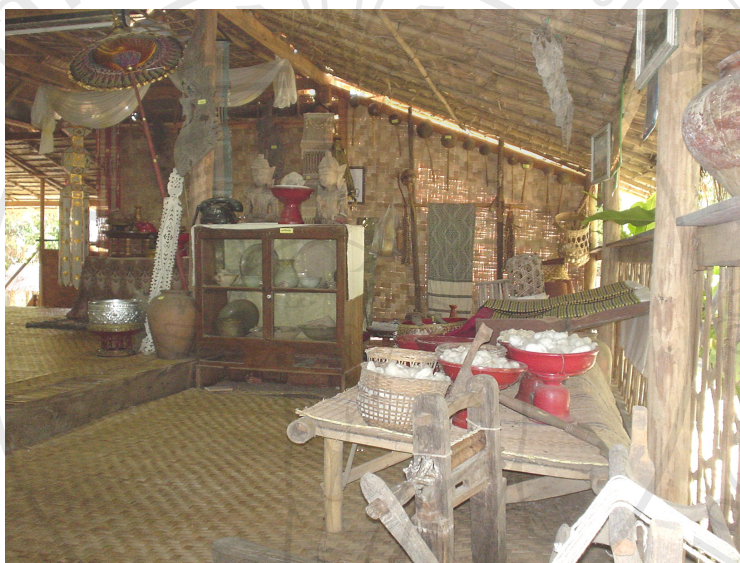
ภาพที่ 4.18 ภายในบ้านโบราณ

บ้านโบราณเป็นเรือนจัดแสดงวิถีชีวิตความเป็นอยู่ของคนล้านนาในอดีตและจัดแสดงการสาธิตต่างๆ เช่น การสาธิตการตัดตุง ตัดจ้อ จัดแสดงครกตำข้าวโบราณ และจัดแสดงนิทรรศการที่ให้ความรู้เกี่ยวกับวัฒนธรรมของชาวล้านนา (ภาพที่ 4.18, 4.19, 4.20, 4.21 และ 4.22)