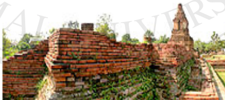
ภาพที่ 4.6 ด้านข้างวัดปู่เปี้ย