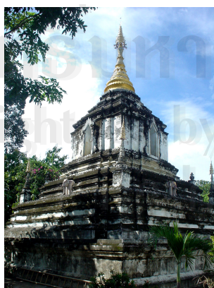
ภาพที่ 4.3 เจดีย์วัดกานโถม (ช้างค้ำ)