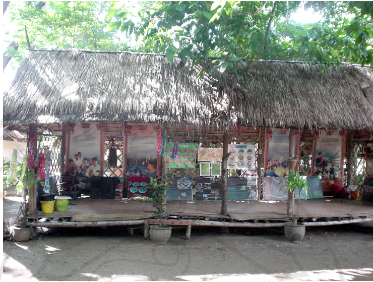
ภาพที่ 4.21 ด้านหน้าซุ้มจัดแสดงนิทรรศการ