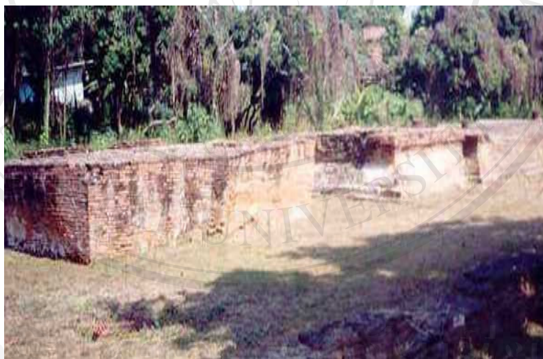
ภาพที่ 4.13 วัดกุ้อ้ายหลาน

วัดกุ้อ้ายหลาน ไม่ปรากฏความเป็นมาในเอกสารและตำนานทางประวัติศาสตร์ เป็นชื่อที่ชาวบ้านเรียกกันเนื่องจากตั้งอยู่ในที่ดินของนายหลานมาตั้งแต่ดั้งเดิม ซึ่งปัจจุบันได้รับการบูรณะแล้ว แต่ยังคงถูกทิ้งให้ร้าง ต้นหญ้าขึ้นหนาแน่น (ภาพที่ 4.13)