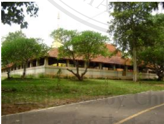
การตัดถนนใกล้ ทำให้เกิดการสั้นสะท้อน ก่อความเสียหาย