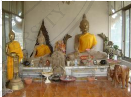
มีการจัดวางศิลปวัตถุอย่างไม่เป็นระเบียบ และไม่มีการจัดหมวดหมู่

ลิขสิทธิ์มหาวิทยาลัยเชียงใหม่ Copyright © by Chiang Mai University All rights reserved