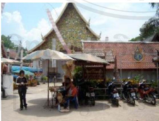
มีการใช้พื้นที่โล่งกว้างเป็นที่จอดรถ บดบังทัศนียภาพของวิหาร