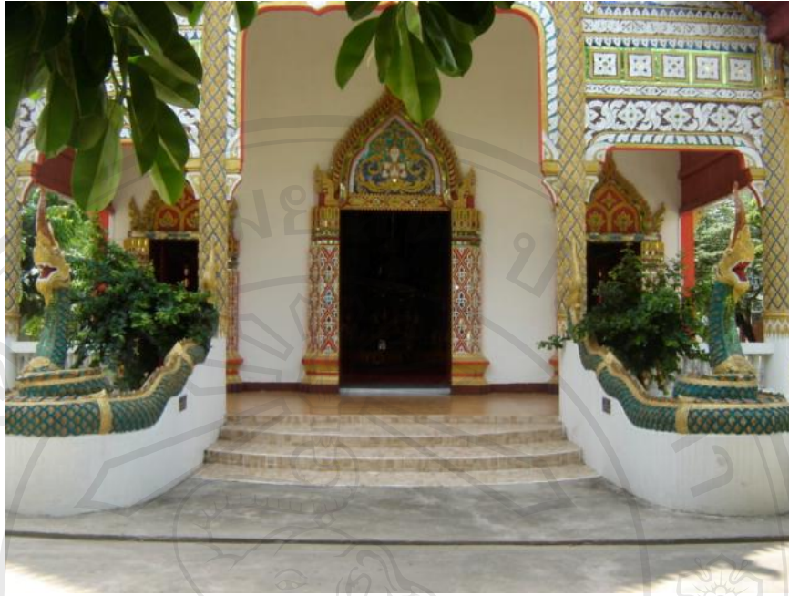
สิ่งแวดล้อมศิลปกรรมวัดประจักษ์(หัวห่านแก้ว) อำเภอเมือง จังหวัดพะเยา