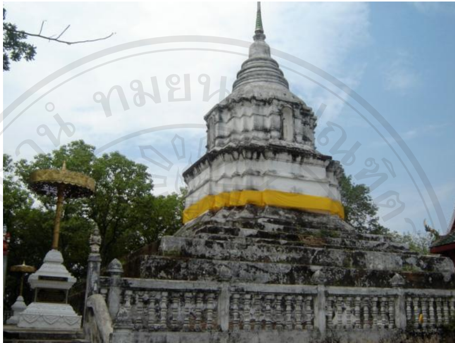
สิ่งแวดล้อมศิลปกรรมวัดป่าแดง(ดอนไชยบุญนาค) อำเภอเมือง จังหวัดพะเยา