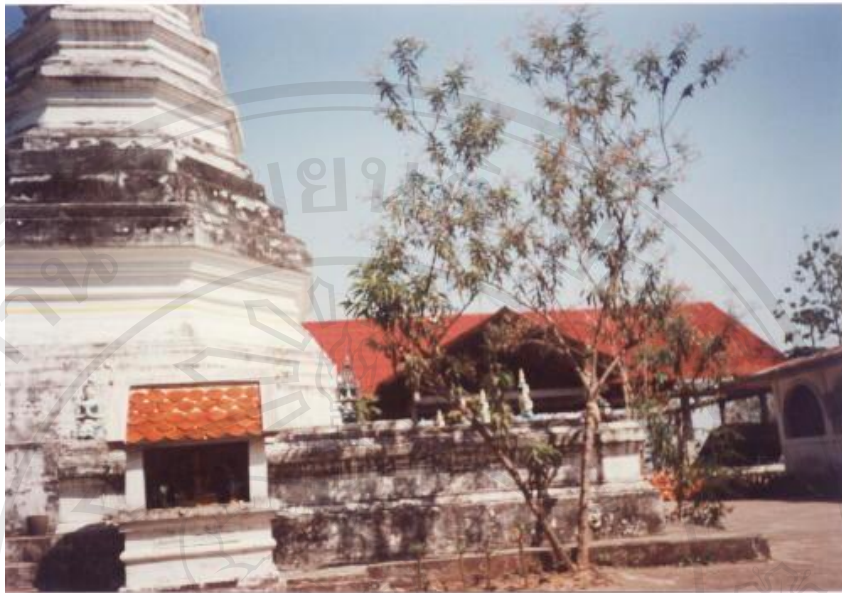
สิ่งแวดล้อมศิลปกรรมวัดพระธาตุเจ้าโว อำเภอดอกคำใต้ จังหวัดพะเยา