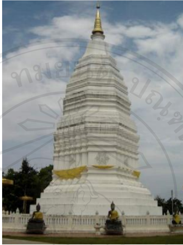
สิ่งแวดล้อมศิลปกรรมวัดลี อำเภอเมือง จังหวัดพะเยา