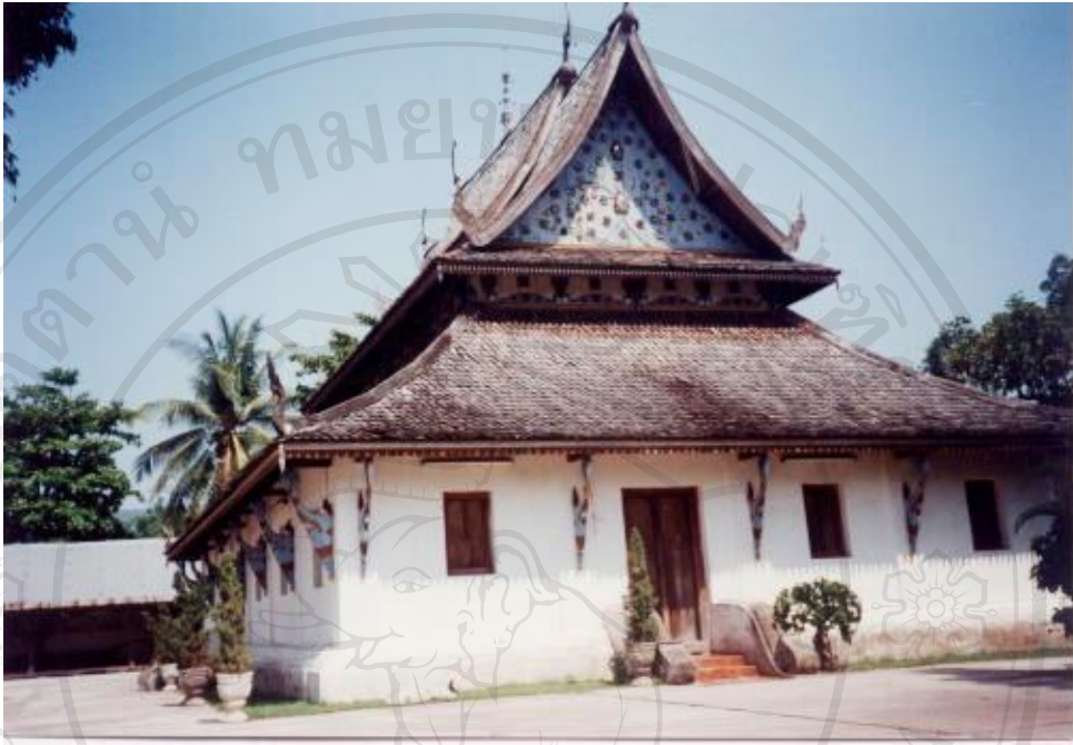
สิ่งแวดล้อมศิลปกรรมวัดท่าฟ้าใต้ อำเภอเชียงม่วน จังหวัดพะเยา