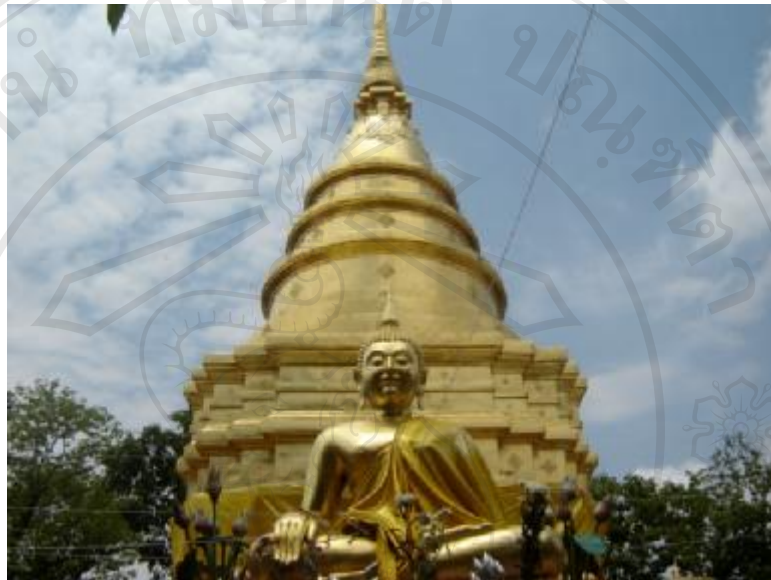
สิ่งแวดล้อมศิลปกรรมวัดพระธาตุจอมทอง