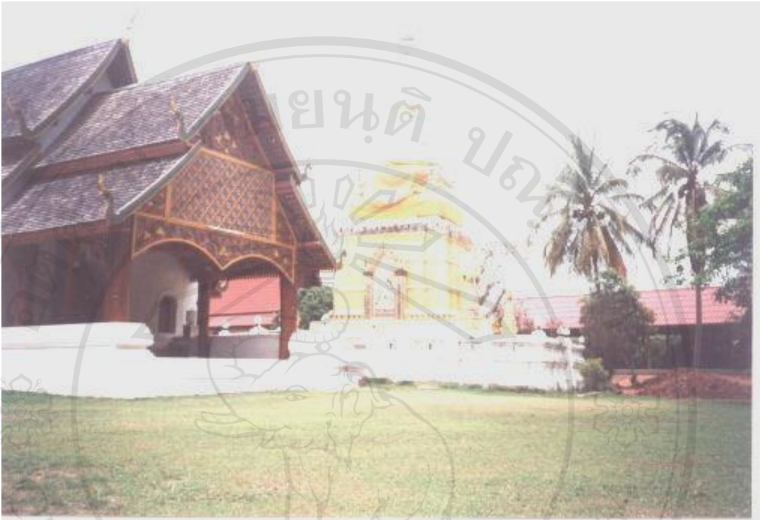
สิ่งแวดล้อมศิลปกรรมวัดพระธาตุดอยหยวก อำเภอปง จังหวัดพะเยา