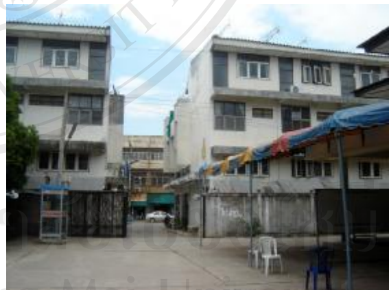
มีการปลูกสร้างอาคารที่อยู่อาศัยลูกข่ายเขต โบราณสถาน