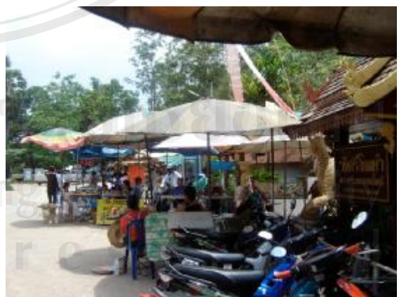
มีการใช้พื้นที่โล่งกว้างเป็นร้านค้าแผงลอยขาดความเป็นระเบียบ