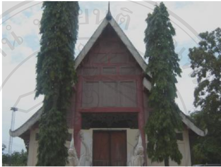
สิ่งแวดล้อมศิลปกรรมวัดหลวงราชสันฐาน