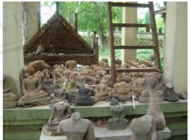
มีการจัดวางศิลปวัตถุอย่างไม่เป็นระเบียบ และไม่มีการจัดหมวดหมู่