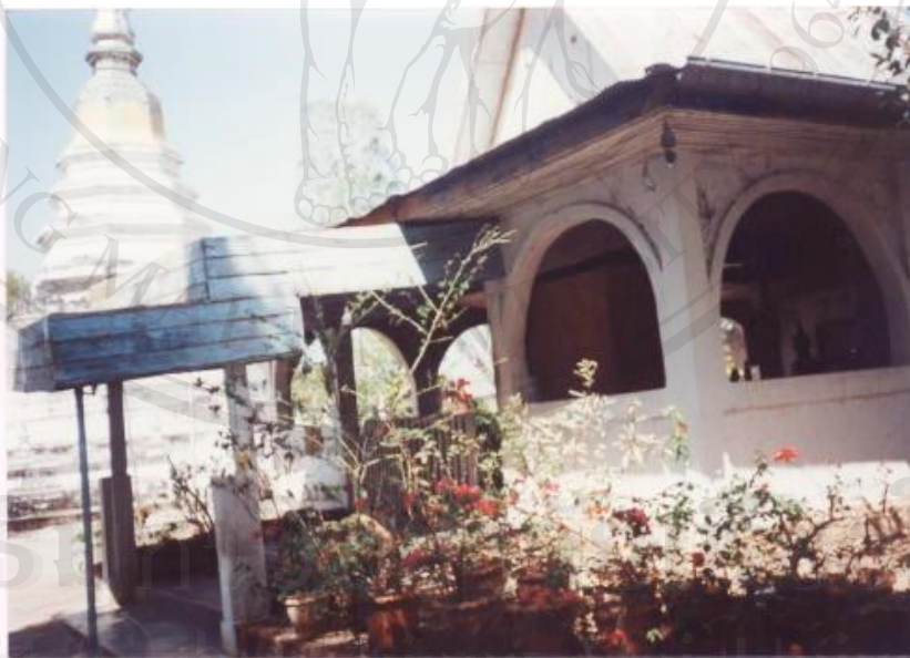
มีหญ้า ต้นไม้ วัชพืช จุลินทรีย์เกิดขึ้น