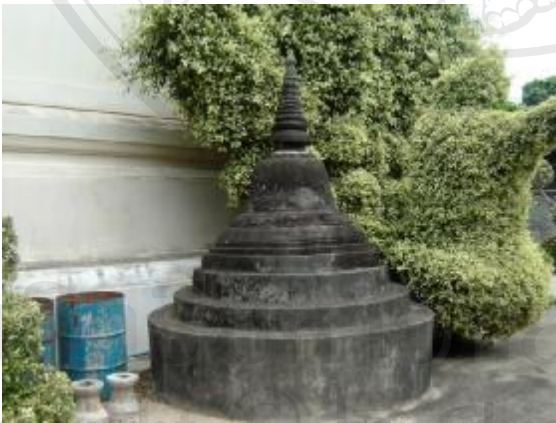
มีการทิ้งขยะมูลฝอยในเขตโบราณสถาน อันเป็นการให้เสื่อมค่า