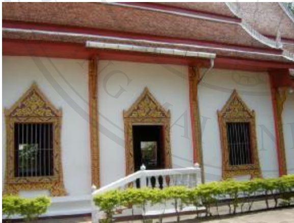
มีการซ่อมแซมใส่รางน้ำสังกะสีซึ่งไม่ถูกต้องตามหลักวิชาการไม่ผ่านการควบคุมจากเจ้าหน้าที่ศิลปากร