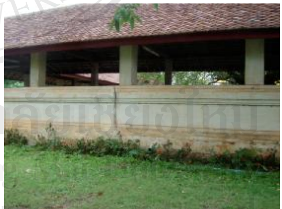
เกิดรอยร้าวที่กำแพงวิหาร