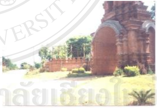
มีการผูกพัน ชำรุดเสื่อมสภาพตามธรรมชาติ