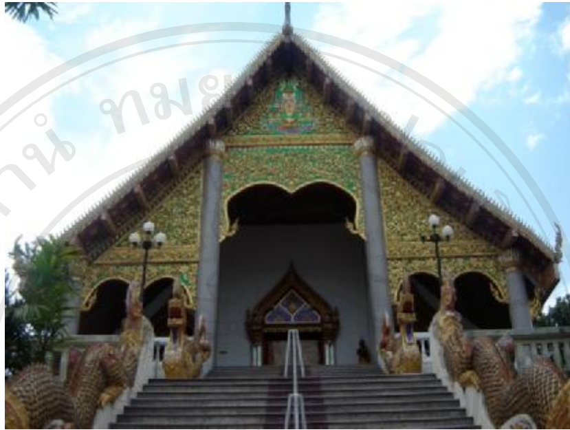
สิ่งแวดล้อมศิลปกรรมวัดอุโมงค์คำ อำเภอเมือง จังหวัดพะเยา