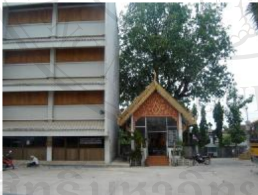
มีการก่อสร้างอาคารเหนือกว่าที่วางศิลปวัตถุ