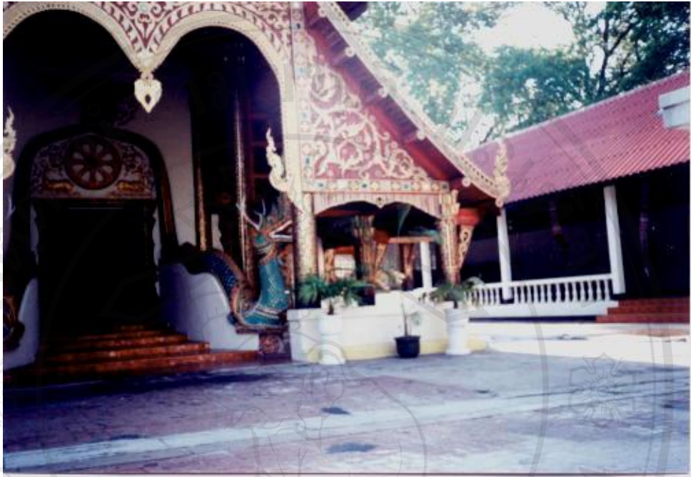
สิ่งแวดล้อมศิลปกรรมวัดแสนเมืองมา อำเภอเชิงคำ จังหวัดพะเยา