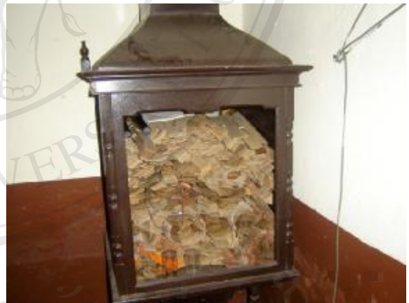
มีการจัดวางศิลปวัตถุอย่างไม่เป็นระเบียบและไม่มีการจัดหมวดหมู่