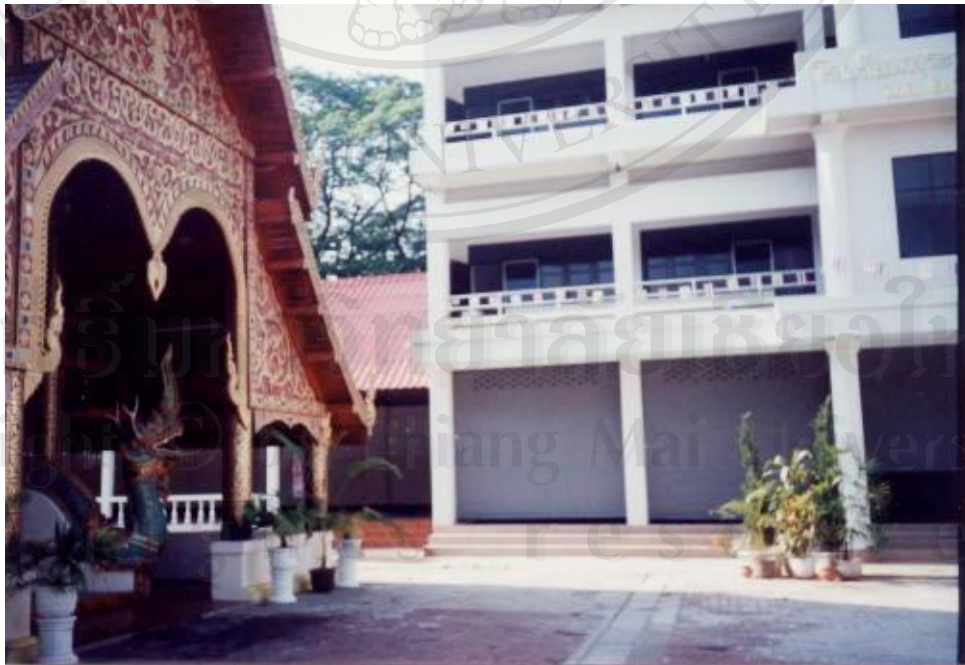
มีการก่อสร้างอาคารสูงกว่าโบราณสถาน