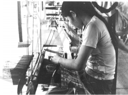
รูปภาพ 4.12 เด็กสาวช้าเหนือกับบทบาทการเข้ามาเป็นแรงงานทอผ้า ในโรงงานทอผ้าช้าเหนือที่เวียงจันทน์ สปป.ลาว

กลุ่มลูกค้าที่บริโภคผ้าเก่ากลางและผ้าเก่ามากโดยส่วนใหญ่เป็นลูกค้าต่างชาติผู้ซึ่งมีรายได้สูงและมีรสนิยมชอบซื้อหาสะสมของเก่าไว้เป็นของสะสมส่วนตัวหรือเพื่อต้องการแสดงถึงความมีรสนิยมในการบริโภคงานศิลปะ และสำหรับลูกค้าในประเทศนั้น โดยส่วนใหญ่แล้วจะบริโภคผ้าใหม่เพราะมีราคาไม่สูงมากนัก เนื่องจากลูกค้าภายในประเทศโดยส่วนใหญ่มีรายได้ต่ำ