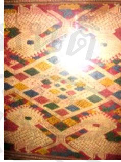
รูปภาพ 4.11 ผ้าเบี่ยง เมืองซำเหนือ อายุประมาณ 100 กว่าปี

สรุปผ้าเบี่ยง ผ้าเบี่ยงซำเหนือ ผ้าใหม่ ผ้าเก่ากลาง ผ้าเก่ามาก มักจะพบการทอด้วยเส้น ใย เทคนิค และการให้สวดลายหลัก สีเส้นหลัก ที่เหมือนกัน