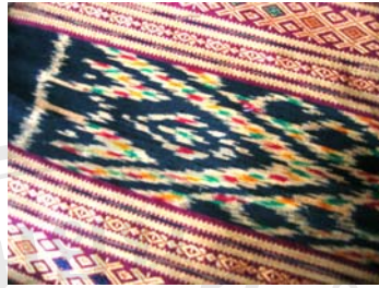
รูปภาพ 4.3 ผ้าซิ่นชำเหนียวขายในตลาดสด เมืองชำเหนียว อายุประมาณ 3-4 ปี