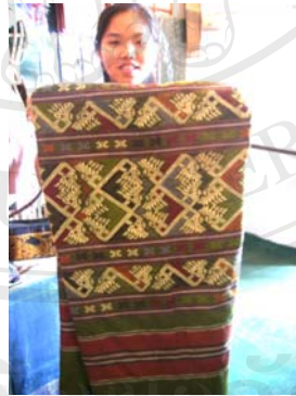
รูปภาพ 4.6 ผ้าชิ้นชำเหนื่อ เมืองชำเหนื่อ ขายอยู่ที่เวียงจันทน์ อายุประมาณ 15 ปี