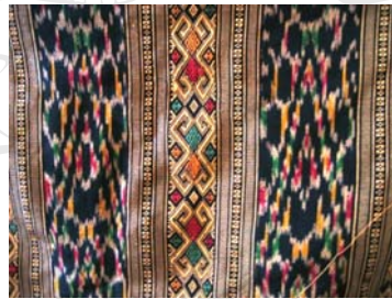
รูปภาพ 4.4 ผ้าซิ่นชำเหนียวขายในตลาดสด เมืองชำเหนียว อายุประมาณ 3-4 ปี

ลิขสิทธิ์มหาวิทยาลัยเชียงใหม่ Copyright © by Chiang Mai University All rights reserved