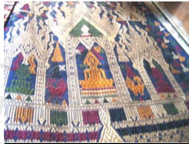
รูปภาพ 4.10 ผ้าเบี่ยง เมืองซำเหนือ อายุประมาณ 15 – 20 ปี