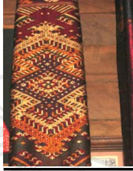
รูปภาพ 4.7 ผ้าเบี่ยง เมืองซำเหนือ แขวงหัวพัน อายุประมาณ 4-5 ปี