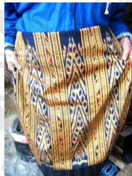
รูปภาพ 4.2 ผ้าซิ่นชำเหนียว เมืองชำเหนียว อายุ ประมาณ 2 ปี ของ นางหล้าน อายุ 42 ปี