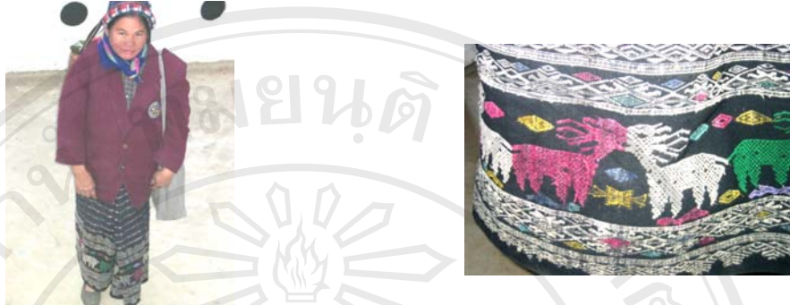
รูปภาพ 4.5 ชิ้นชำเหนื่อลายกว้างคู่ เมืองชำเหนื่อ อายุประมาณ 20 ปี ของนางไม ชนเผ่าไทแดง อายุ 50 ปี