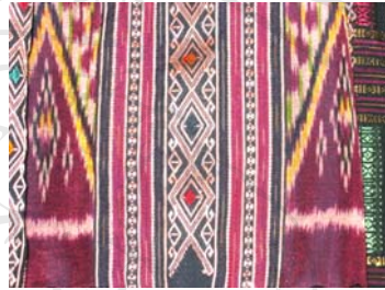
รูปภาพ 4.1 ผ้าซิ่นซิ่นชำเหนียวในตลาดสด เมืองชำเหนียว อายุ ประมาณ 3-4 ปี