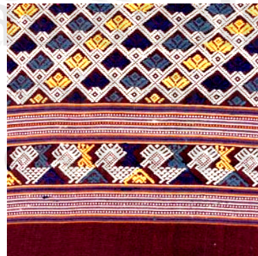
รูปภาพ 4.13 การจัดวางลวดลายและลายนกในรูปแบบใหม่บนพื้นผ้าเบียง