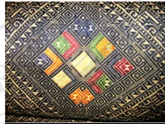
รูปภาพ 4.8 ผ้าเบี่ยง เมืองซำเหนือ แขวงหัวพัน อายุประมาณ 4-5 ปี