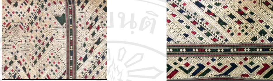
รูปภาพ 4.9 ผ้าเบี่ยง เมืองซำเหนือ อายุประมาณ 20 ปี ที่มา เวียงคอน อายุ 18 ปี เวียงจันทน์