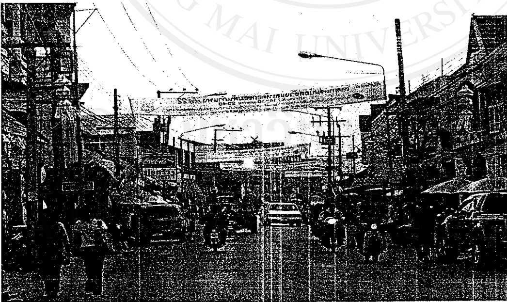
ภาพที่ 23 ร้านค้าตั้งเป็นทางยาวตามถนนของหมู่บ้าน

สภาพการท่องเที่ยวในปัจจุบันมีการขยายตัวของร้านค้าเป็นทางยาวตามถนนของหมู่บ้าน และมีร้านค้าจำนวนมาก จึงเกิดการแย่งลูกค้ากันเกิดขึ้นมีการแข่งขันเพื่อจูงใจให้มาเข้าร้านตน โดยร้านค้าที่เกิดขึ้นใหม่ๆ จะเป็นของคนต่างถิ่นและมีเงินลงทุนสูงและมีการจัดการที่ทันสมัยและมักจะมีกลยุทธ์ในการชักจูงลูกค้าด้วยวิธีต่างๆ มากมาย อาทิ มีการสาธิตการทำรมในทุกชั้นตอนให้นักท่องเที่ยวชมซึ่งเป็นการสะดวกแก่นักท่องเที่ยวที่จะได้ชมโดยไม่ต้องเดินเข้าไปชมตามหมู่บ้าน และบางร้านก็มีค่าจอดรถให้กับคฤหาสน์และคนขับรถเพื่อเป็นการจูงใจให้พานักท่องเที่ยวมายังร้านของตนอีกในครั้งต่อไป