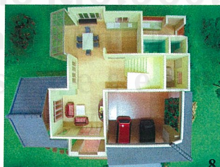
1.แปลนบ้าน