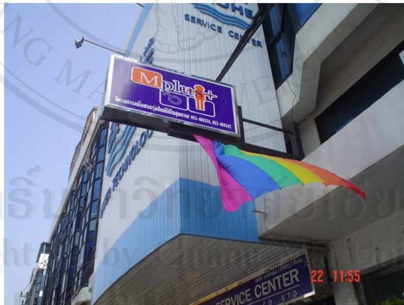
ศูนย์สุขภาพชาย (Mplus) ผู้จัดทำหลักสูตรทักษะชีวิต

หลักสูตรทักษะชีวิตเป็นหลักสูตรที่ทางศูนย์สุขภาพชาย (Mplus) จัดทำขึ้น เพื่อนำไปอบรมหรือสอนแก่พนักงานขายบริการในสถานประกอบการกลางคืน และสถานี่นวดแผนโบราณ ในจังหวัดเชียงใหม่ ทั้งหมด 25 แห่ง ระหว่างเดือน มกราคม ถึง เดือนพฤษภาคม 2549 เนื่องจากว่าในจังหวัดเชียงใหม่มีสถานประกอบการกลางคืนและสถานี่นวดแผนโบราณที่ขายบริการทางเพศร่วมด้วย อยู่เป็นจำนวนมาก ซึ่งพนักงานขายบริการเหล่านี้ส่วนใหญ่มักจะเป็นพนักงานขายบริการที่มีการศึกษาน้อยและเป็นเด็กพื้นที่สูง จึงไม่ได้ตระหนักถึงสุขภาพในการประกอบอาชีพของตนเองตลอดจนการป้องกันโรค โดยเฉพาะการป้องกันโรคติดต่อทางเพศสัมพันธ์