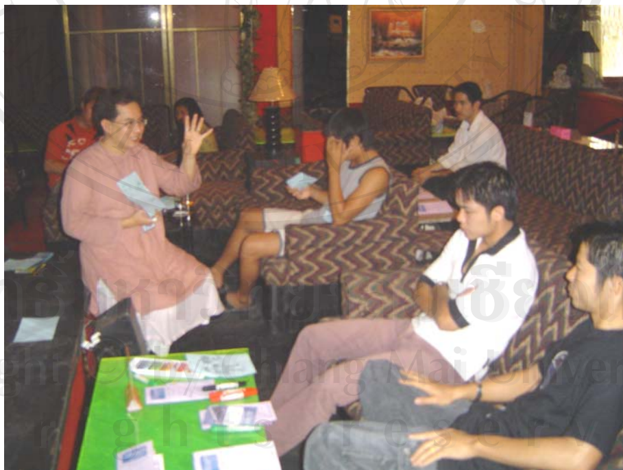
รูปแบบการทำกิจกรรมของหลักสูตรทักษะชีวิต

จากการสัมภาษณ์ผู้ทำหลักสูตรพบว่าหัวข้อกิจกรรมทั้ง 4 กิจกรรมในระหว่างการสอน ผู้สอนจะให้พนักงานขายบริการแสดงความคิดเห็นและซักถามในสิ่งที่ไม่เข้าใจ โดยจะใช้ภาษาที่เป็นกันเองใช้ศัพท์ทางวิชาการบ้างเป็นบางครั้ง รูปแบบการนั่งจะนั่งเป็นรูปครึ่งวงกลม หรือนั่งตามอักษย ก่อนที่จะเริ่มกิจกรรมจะมีการแนะนำตัวทั้งผู้เข้าอบรมและผู้สอน โดยผู้สอนให้เหตุผลว่า “เพื่อจะได้รู้จักกันและคุ้นเคยกันมากขึ้นและจะทำให้เด็กกล้าซักถามคำถามที่ตนเองไม่เข้าใจ” สถานที่ที่ใช้ในการสอนจะเป็นสถานที่ที่บาร์ เพราะง่ายต่อการรวมกลุ่มของพนักงานขายบริการ ซึ่งตรงกับ การสัมภาษณ์เจ้าของสถานประกอบการ ถึงสถานที่ที่ใช้ในการสอน เจ้าของสถานประกอบการได้บอกไว้ว่า “เด็กบางคนไม่มีรถ จะลำบากในการเดินทางจะทำให้เด็กไม่อยากเข้าอบรม มาที่บาร์จะสะดวกกว่า” เวลาในการสอนจะใช้เวลาก่อนที่พนักงานขายบริการจะทำงานหรือแล้วแต่ว่าทางเจ้าของประกอบการจะสะดวกและนัดพนักงานขายบริการให้ ส่วนเวลาในช่วงของการสอนแต่ละกิจกรรมจะใช้เวลาประมาณ 45 นาทีถึง 1 ชั่วโมง ในการสอนแต่ละกิจกรรมจะมีการแทรกเกมส์เพื่อจะทำให้พนักงานขายบริการไม่เกิดการเบื่อหน่ายในกิจกรรมการสอน