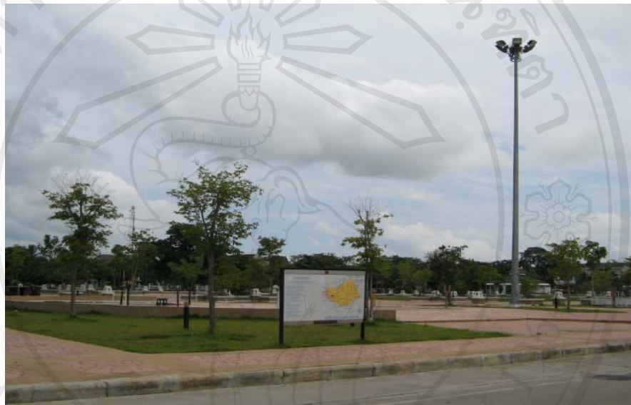
รูป 5.2 โครงการก่อสร้างสวนสาธารณะบริเวณหลังเทศบาลเมืองพะเยา

จากการสอบถามนักท่องเที่ยวท่านหนึ่ง ได้แสดงความคิดเห็นว่า “...สภาพของกว๊านพะเยา มีความเรียบร้อยกว่าเดิมค่อนข้างมาก คุณสะอาดเรียบร้อยขึ้น เหมาะสม น่าเที่ยวชมมากยิ่งขึ้น ...” (สัมภาษณ์, 23 เมษายน 2548)