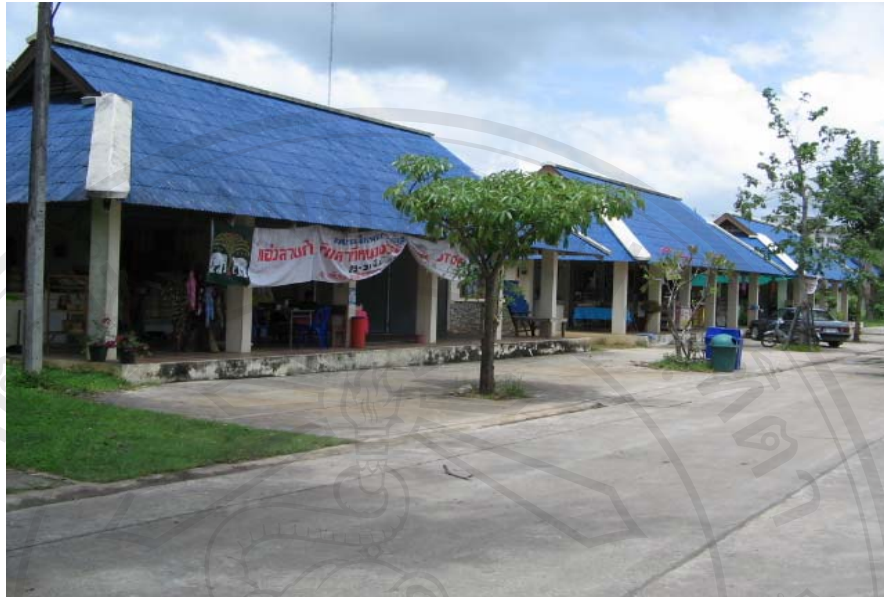
รูป 5.3 โครงการลานค้าชุมชน ตลาดชุมชนเมืองพะเยา บริเวณหนองระนุ

3.โครงการลานค้าชุมชน ตลาดชุมชนเมืองพะเยา บริเวณหนองระนุ