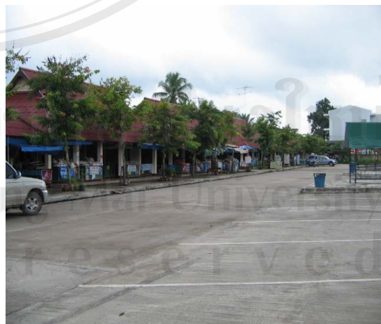
รูป 5.4 โครงการปรับปรุงภูมิทัศน์และสร้างเขื่อนริมกว๊านพะเยา บริเวณวัดศรีโคมคำ