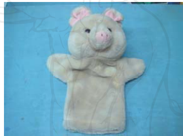
ตุ๊กตาสวมมือ