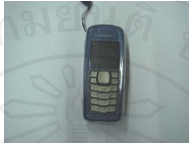
โทรศัพท์มือถือจริง