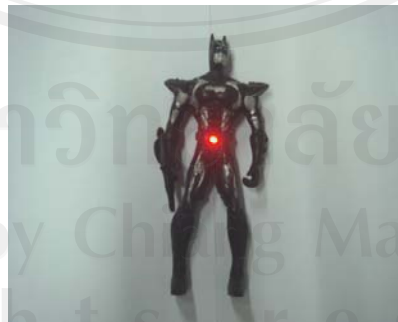
หุ่นแบทแมน