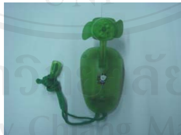
พัดลมขนาดมือถือ