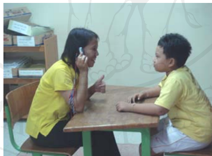
ภาพ 3 ผู้ศึกษาถือโทรศัพท์มือถือจริงไว้ชิดหางตาของผู้ศึกษา เพื่อกระตุ้นการมองร่วมกัน

ข้อสังเกต น่องหนึ่งสามารถมองร่วมกันได้มากกว่าเกณฑ์จุดประสงค์ที่ตั้งไว้คือ 7 ครั้งในเวลา 5 นาที คือมองร่วมกันได้ 8 ครั้ง จากเรียก 20 ครั้งและใช้สื่อที่มีเสียงคือโทรศัพท์มือถือ เป็นการกระตุ้นช่วยให้ น่องหนึ่งสนใจและให้ความร่วมมือในการฝึกเป็นผลดีมากขึ้นกว่าเดิม