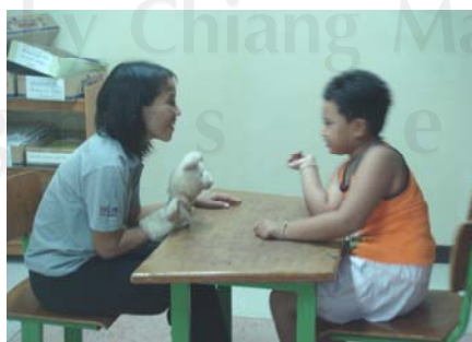
ภาพ 2 ผู้ศึกษาถือตุ๊กตาหมูสวมมือรูปหมูไว้ได้คางของผู้ศึกษาเพื่อกระตุ้นการมองร่วมกัน

ข้อสังเกต กิจกรรมที่ 1.3 ผู้ศึกษาได้ใช้ตุ๊กตาหมูสวมมือถือไว้ได้คาง และกิจกรรม ที่ 1.4 ได้งดการใช้สื่อในการฝึกเป็นตั้งจุดประสงค์เชิงพฤติกรรมไว้คือให้ห้องหนึ่งสามารถมอง ร่วมกัน 6 ครั้งในเวลา 5 นาที หลังจากการฝึกมีผลการมองร่วมกันได้มากกว่าจุดประสงค์ที่ตั้งไว้ คือ มองร่วมกันเท่ากับ 7 ครั้งและ 8 ครั้ง สังเกตได้ว่าระหว่างการฝึกห้องหนึ่งนั่งไม่นิ่ง เท้ากระดิก ไปมาและเตะเท้าของผู้ศึกษา ผู้ศึกษาบอกว่าหากไม่หยุดจะไม่ให้หลอดคาแฟและขนม ห้องหนึ่ง จึงหยุดพฤติกรรมดังกล่าวซึ่งเป็นการสร้างเงื่อนไขให้ห้องหนึ่งหยุดพฤติกรรมที่ไม่พึงประสงค์ โดยใช้สิ่งที่ห้องหนึ่งชอบมาเป็นเงื่อนไข ซึ่งผลการฝึกขึ้นอยู่กับการใช้สิ่งเสริมแรงและสื่อ ที่เด็กชอบทำให้การฝึกได้ผลดีขึ้นกว่าเดิม