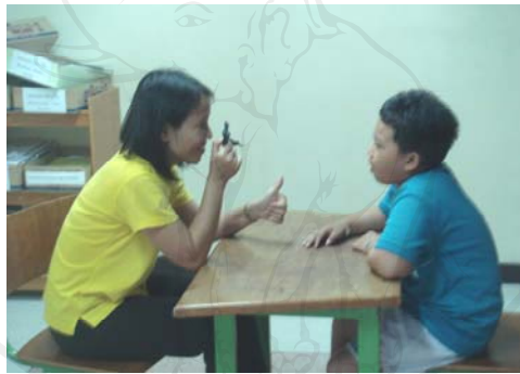
ภาพ 6 ผู้ศึกษาถือหุ่นยนต์แบทแมนไว้ระหว่างคิวของผู้ศึกษา เพื่อกระตุ้นการมองร่วมกัน

ข้อสังเกต กิจกรรมที่ 3.1-3.2 ได้ตั้งจุดประสงค์เชิงพฤติกรรมไว้คือให้น้องหนึ่งสามารถมองร่วมกัน 8 ครั้งในเวลา 5 นาที หลังจากการฝึกมีผลการมองร่วมกันได้มากกว่า จุดประสงค์ที่ตั้งไว้คือ มองร่วมกันเท่ากับ 9 ครั้งและ 12 ครั้ง น้องหนึ่งสามารถมองร่วมกันได้มากกว่าเกณฑ์ที่ตั้งไว้ เพราะจากการฝึกซ้ำ ๆ ทำให้น้องหนึ่งมีความจำเพิ่มมากขึ้น และการกระตุ้นโดยการส่องแสงสีแดงจากหุ่นยนต์แบทแมนส่องไปตามส่วนต่างๆ ของร่างกาย เพื่อดึงดูดความสนใจของน้องหนึ่งให้มองผู้ศึกษา จะเห็นได้ว่าสื่อที่มีแสงเป็นสื่อที่สามารถกระตุ้นน้องหนึ่งได้ดีทีเดียว