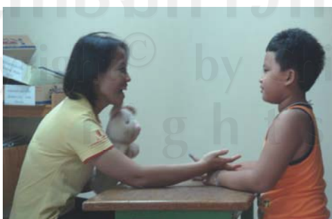
ภาพ 9 ผู้ศึกษาถือตุ๊กตาหมูไว้ได้คางของ ผู้ศึกษาเพื่อกระตุ้นการมองร่วมกัน

ข้อสังเกต นื่องหนึ่งสามารถมองร่วมกัน ได้มากกว่าเกณฑ์ที่ตั้งไว้คือ 9 ครั้งในเวลา 5 นาที เนื่องจากได้ทำการฝึกซ้ำ ๆ ทำให้เกิดความคุ้นเคยกันมากขึ้นระหว่างผู้ศึกษากับนื่องหนึ่ง ซึ่งจากเดิมก่อนเริ่มการฝึกครั้งแรก นื่องหนึ่งจะไม่สนใจและไม่ปฏิบัติตามกับผู้ศึกษาเลย จนมาถึงขณะนี้นื่องหนึ่งมีปฏิสัมพันธ์กับผู้ศึกษามากขึ้นกว่าเดิม จากการที่เมื่อเสร็จสิ้นจากการฝึก นื่องหนึ่งยังต้องการให้ผู้ศึกษาพากลับไปส่งที่ห้องพัก จะเห็นได้ว่าการมองร่วมกันเป็นการสร้างปฏิสัมพันธ์ร่วมกันอย่างหนึ่ง