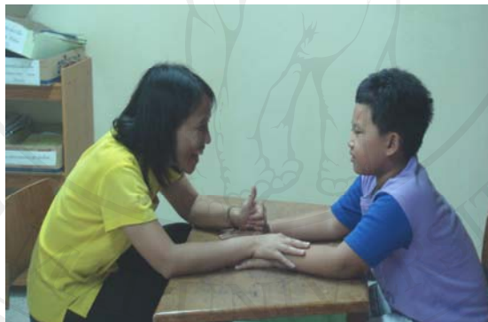
ภาพ 7 ผู้ศึกษาไม่ใช้สื่อแต่ใช้การเรียกชื่อแทน

สรุปได้ว่าการจัดสิ่งแวดล้อมที่เหมาะสมในระหว่างการฝึกทำให้นื่องหนึ่งมีสมาธิเพิ่มมากขึ้นและส่งผลทำให้มีพฤติกรรมที่เราต้องการฝึกคือการมองร่วมกันประสบผลสำเร็จได้มากขึ้นเช่นกัน