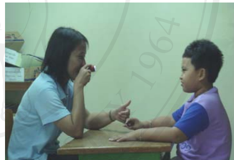
ภาพ 12 ผู้ศึกษาถือไฟฉายไว้ระหว่างคิ้วของผู้ศึกษา เพื่อกระตุ้นการมองร่วมกัน

กิจกรรมที่ 5.3 การสังเกตครั้งที่ 29 วันที่ 1 มิถุนายน 2550 ระหว่างเวลา 10.00-10.30 น. ก่อนการฝึก ช่วงเช้าหลังจากดื่มนมเสร็จผู้ศึกษายื่นตุ๊กตาหมูสวมมือนำให้น้องหนึ่ง น้องหนึ่งนำตุ๊กตาไปดม ผู้ศึกษาพูดว่า “หอมแก้มตุ๊กตาหน่อย” น้องหนึ่งทำท่าหอมหลาย ๆ ครั้ง และยื่นตุ๊กตามาที่หน้าผู้ศึกษา ผู้ศึกษาทำท่าหอมแก้มตุ๊กตาด้วย น้องหนึ่งหัวเราะชอบใจและดึงมือผู้ศึกษาให้จับตุ๊กตา จากนั้นทำการฝึก