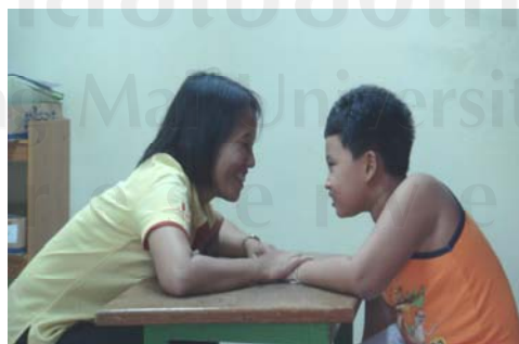
ภาพ 10 ผู้ศึกษาไม่ใช้สื่อแต่ใช้การเรียกชื่อแทน