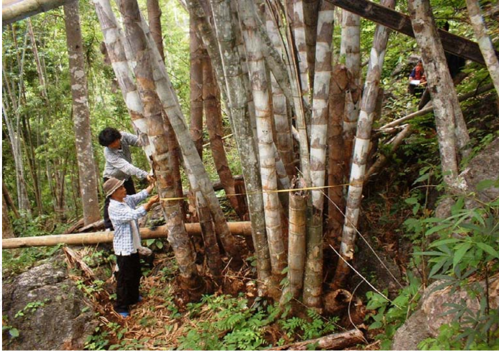
การสำรวจข้อมูลไฟ