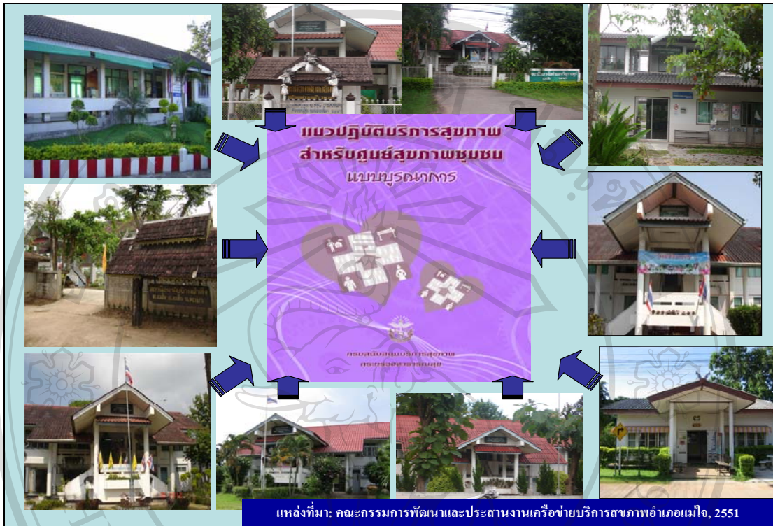
ภาพที่ 12 การดำเนินงานตามนโยบายกระทรวงสาธารณสุขในการดูแลผู้ป่วยโรคปอดอุดกั้นเรื้อรังตามแบบบูรณาการระบบบริการปฐมภูมิในลักษณะเครือข่ายสุขภาพชุมชน(คณะกรรมการประสานงานและพัฒนาคุณภาพเครือข่ายบริการสุขภาพอำเภอแม่ใจ, 2549)