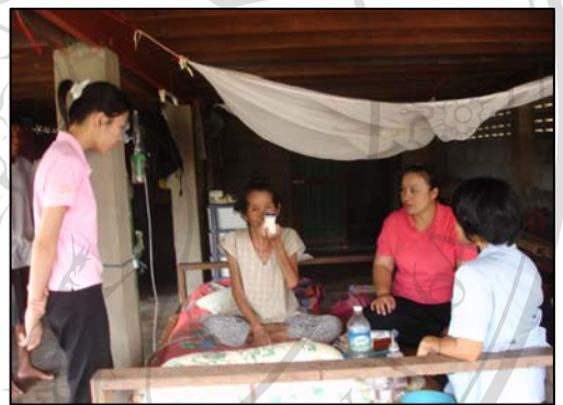
ภาพที่ 21 การเยี่ยมบ้าน