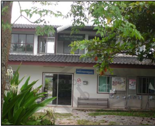
ภาพที่ 8 ศูนย์สุขภาพชุมชนตำบลแม่สุก