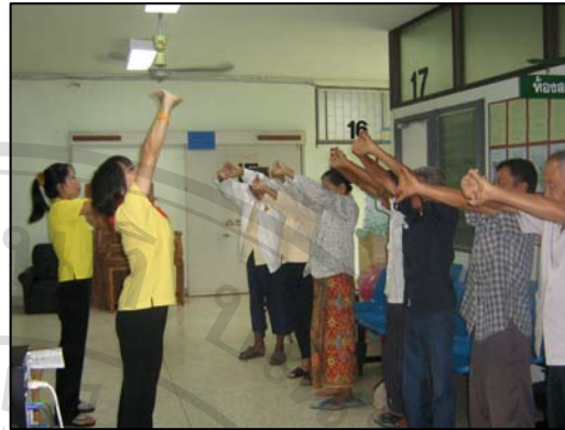
ภาพที่ 18-19 การบริการก่อนกลับบ้าน โดยการฝึกการหายใจและออกกำลังกายเพื่อฟื้นฟูสมรรถภาพปอด ทั้งรายบุคคลและรายกลุ่ม