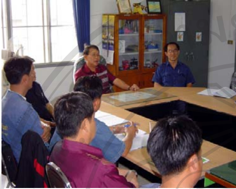
ภาพที่ 13 สำนักงานสาธารณสุขจังหวัดพะเยา ถ่ายทอดนโยบายมายังสำนักงานสาธารณสุขอำเภอ