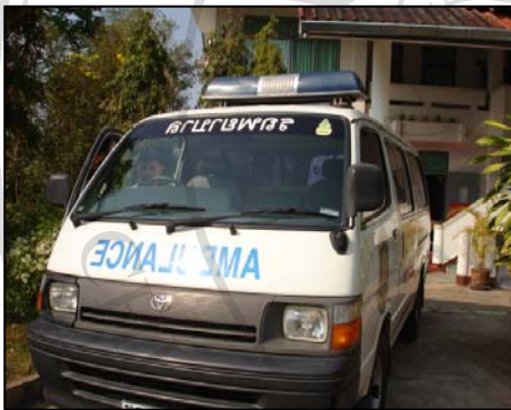
ภาพที่ 20 การส่งต่อผู้ป่วย