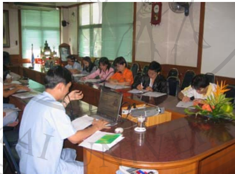
ภาพที่ 15 การรับนโยบายของศูนย์สุขภาพชุมชน