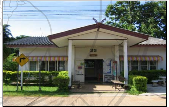
ภาพที่ 11 ศูนย์สุขภาพชุมชนโรงพยาบาลแม่ใจ