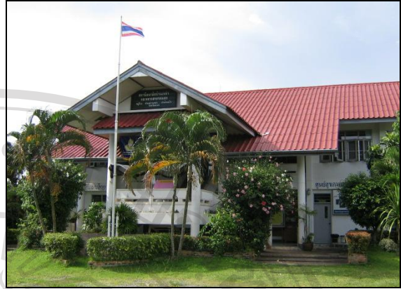
ภาพที่ 9 ศูนย์สุขภาพชุมชนตำบลบ้านหล้า