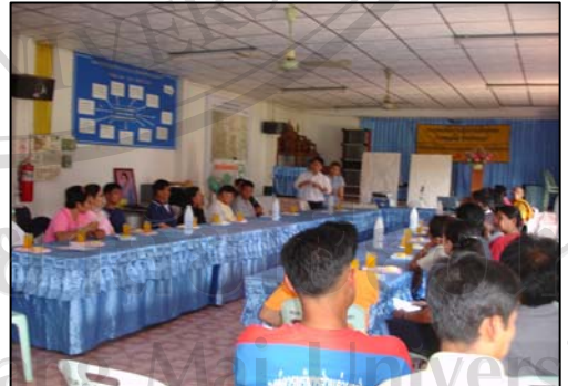
ภาพที่ 22-23 กิจกรรมในชุมชน โดยการประชุมร่วมกับแกนนำหมู่บ้าน และองค์กรส่วนท้องถิ่น