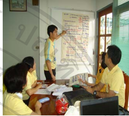
ภาพที่ 14 การรับนโยบายจากเครือข่าย ศูนย์สุขภาพชุมชน