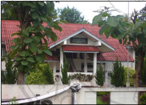
ภาพที่ 10 ศูนย์สุขภาพชุมชนตำบลป่าแฝก