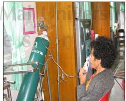
ภาพที่ 17 การดูแลผู้ป่วยฉุกเฉิน