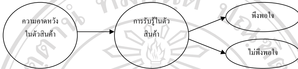
รูปที่ 2.1 แบบจำลองความพึงพอใจอันเนื่องมาจากความคาดหวัง

ค) ความไม่ตรงกัน ความแตกต่างระหว่างสิ่งที่คาดหวังกับการรับรู้ที่เกิดขึ้นจริงทำให้เกิดช่องว่างขึ้น หากความหวังนั้นตรงกับสิ่งที่เกิดขึ้นจริง มักทำให้เกิดความพึงพอใจ หากความหวังมีมากกว่าการรับรู้ที่เกิดขึ้นจริง จะนำมาซึ่งความพึงพอใจของผู้บริโภคที่สูงขึ้น สามารถแสดงการเกิดความพึงพอใจอันเนื่องมาจากความคาดหวังได้ดังรูปที่ 2.1