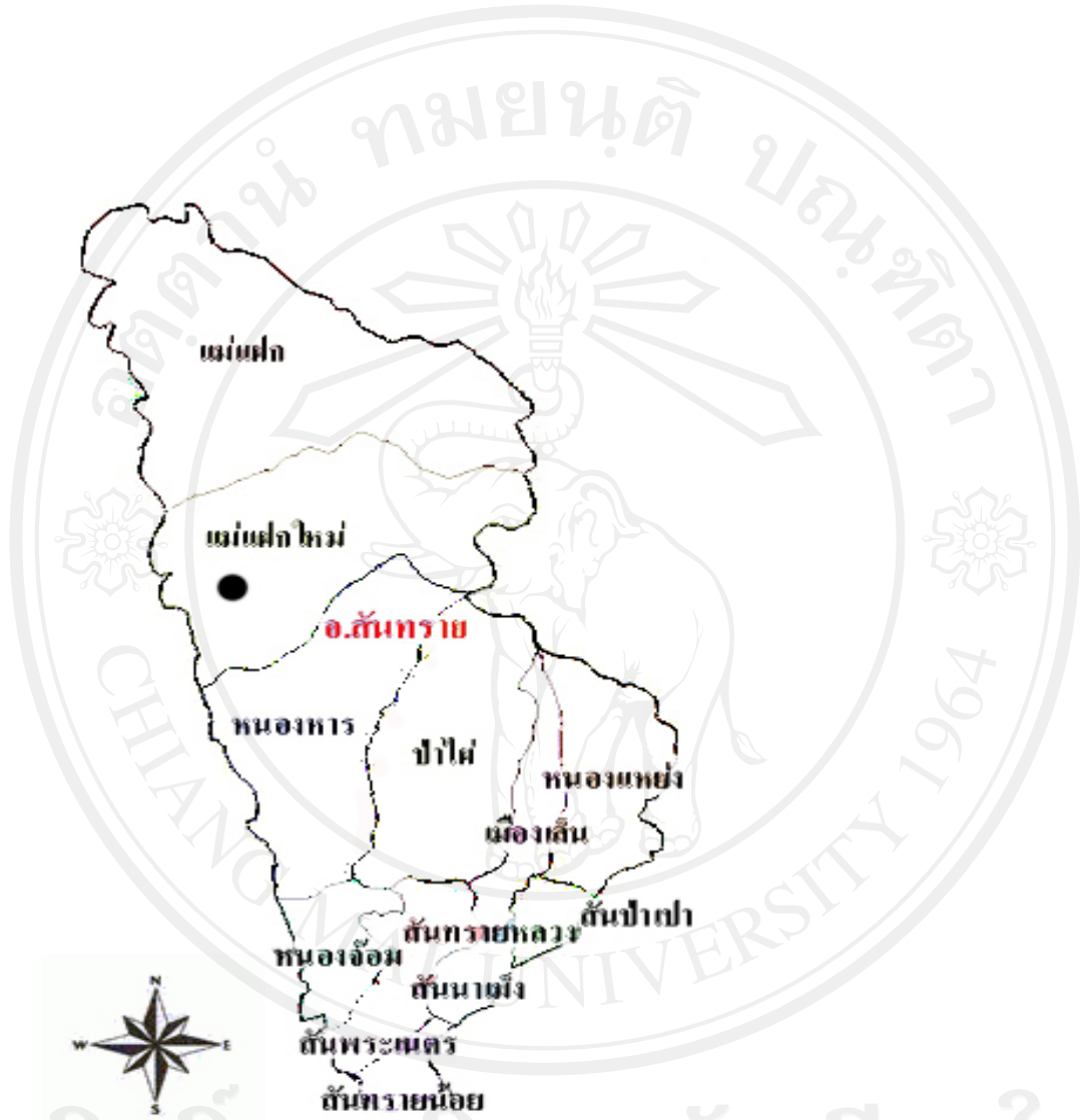
แผนภาพ 2 แผนที่อำเภอสังขาราย แสดงตำบล

ลิขสิทธิ์มหาวิทยาลัยเชียงใหม่ • ตำบลที่ทำการศึกษา