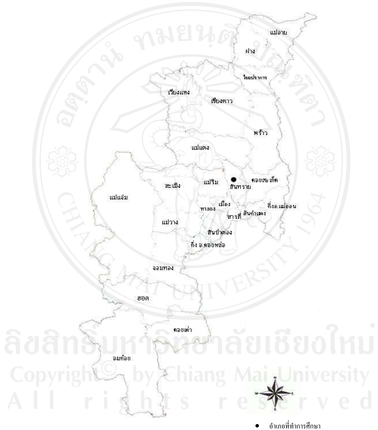
แผนภาพ 1 แผนที่ที่ตั้งของอำเภอจังหวัดเชียงใหม่