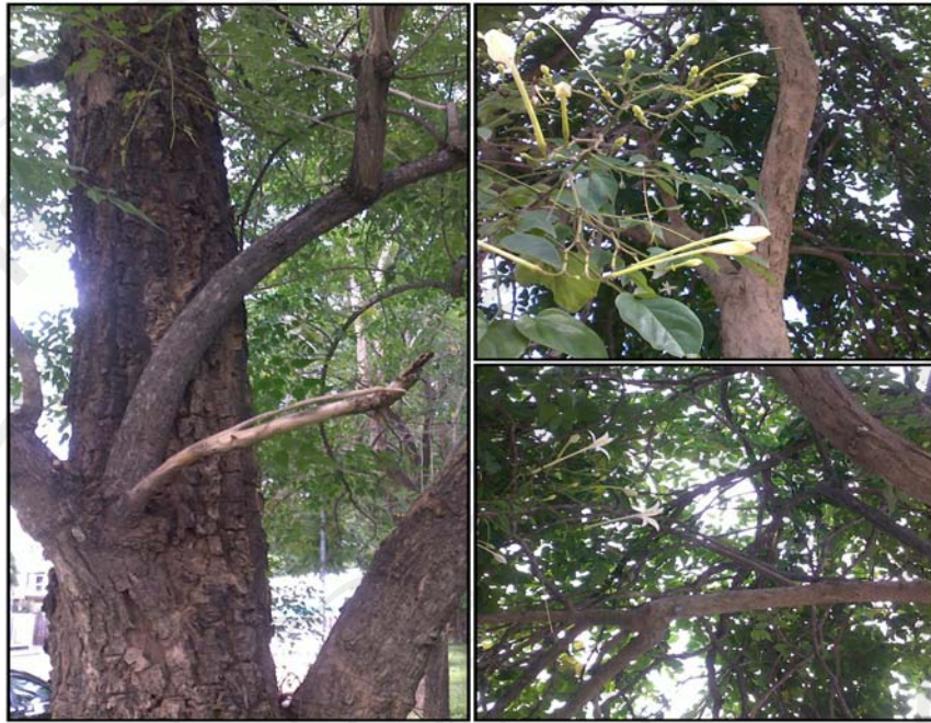
ภาพ 4-4 กาสะลอง (ต้นปีบ)

เถาพระขรรค์ไชยศรี เป็นสมุนไพรที่มีสรรพคุณในการทำให้เบื่อเมา และขับพิษสุรา โดยการขับเหงื่อ และถ่ายท้อง เถาพระขรรค์ไชยศรีจะมีลักษณะเป็นเถาไม้เลื้อย “ส่วนเถาพระขรรค์ไชยศรีก็เป็นยาเบื่อเมา” วิธีการเตรียมยา ทำโดยการสับเถาพระขรรค์ไชยศรีให้เป็นชิ้นเล็กๆ แล้วนำเอามาต้มจนกระทั่งน้ำเดือด สังเกตดูว่ามีตัวน้ำยาไหลออกมาเพียงพอตามที่ต้องการ และเหมาะสมกับผู้ที่รับประทาน ความเหมาะสมของการต้มจะพิจารณาจากธาตุในร่างกายของแต่ละบุคคล โดยธาตุในร่างกายของคนเราแต่ละคนมีความแตกต่างกัน ทำให้มีการตอบสนองต่อฤทธิ์ของการขับถ่ายแตกต่างกัน เนื่องจากเถาพระขรรค์ไชยศรีมีฤทธิ์ทำให้เกิดอาการมวนท้อง และถ่ายท้อง ดังนั้น หากใช้วิธีการต้มยาทั่วไปคือ จากน้ำ 3 ส่วน เหลือ 1 ส่วน อาจจะทำให้ตัวน้ำยาเข้มข้นมากเกินไป ส่งผลทำให้ฤทธิ์ยาเพิ่มขึ้น และอาจทำให้เกิดอันตรายจากอาการถ่ายท้องได้ “คือเค้าจะเอาเถาของมันเนี่ยนะ เอามาสับเป็นชิ้นเนาะ แล้วเอามาต้ม ต้มน้ำแล้วก็คั้น 1 แก้วนะ” “คือจริงแล้วการต้มยานี้ 1 เค้าจะต้องต้มให้เดือด พอเดือดแล้วรอประมาณสักครู่หนึ่ง ให้น้ำเดือดพอด้วยมันไหลออกมาก็พอได้แล้ว แต่ว่าตามหลักที่เค้าเขียนว่าต้ม 3 เอา 1 นั้นนะ อันนั้นมันแก่ (ตัวยาเยอะ) ไปครับ” “มันขึ้นอยู่กับไฟธาตุของคนนะ เวลาคนเรานี้มันจะไม่เหมือนกันนะ เพราะว่าบางคนกินยานิดหนึ่งมันก็ถ่ายแล้ว แต่สำหรับบางคนกินแล้วมันไม่รู้สึกระยะ การกำหนดปริมาณยามันต้องดูว่ากำลังรวมของแต่ละคนเป็นอย่างไรด้วยนะครับ”