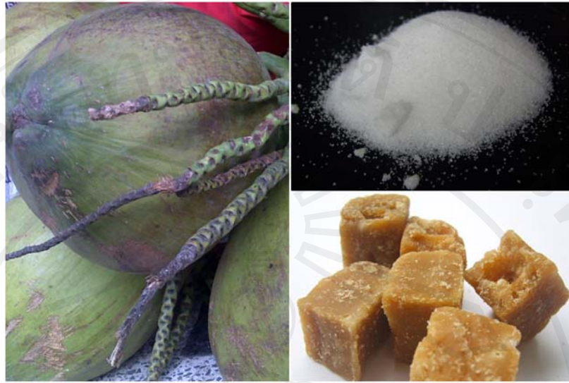
ภาพ 4-9 อาหารรสหวาน

นอกจากนั้นชาวล้านนายังมีความเชื่อเกี่ยวกับการรับประทานอาหารว่า นอกจากการรับประทานอาหารที่เป็นประโยชน์ ตรงกับความต้องการของร่างกาย ส่งผลให้ร่างกายเกิดภาวะสมดุลแล้ว ควรหลีกเลี่ยงการรับประทานอาหารแสลง เนื่องจากเมื่อรับประทานอาหารแสลงเข้าไป อาจทำให้อาการผิดปกติต่างๆ เช่น ฐู้สึกไม่สุขสบาย เพราะอาหารแสลงจะเข้าไปรบกวนสมดุลของร่างกาย ซึ่งอาหารแสลงสำหรับผู้ที่เป็นโรคติดสุรา คือ ขนุน และทุเรียน เนื่องจากเป็นอาหารรสหวานหอม และเป็นอาหารแสลงลม ซึ่งตามความเชื่อของชาวล้านนาเชื่อว่า ผู้ที่เป็นโรคติดสุราจะมีความผิดปกติของธาตุลมในร่างกายหรือที่เรียกว่าธาตุลมพิการ ดังนั้นเมื่อผู้ที่เป็นโรคติดสุรา รับประทานขนุน และทุเรียนซึ่งเป็นอาหารแสลงลม ก็จะยิ่งทำให้ธาตุลมผิดปกติมากยิ่งขึ้น เนื่องจากธาตุลมเป็นธาตุที่ไวต่อการเปลี่ยนแปลงมากที่สุด และอาจทำให้ผู้ที่เป็นโรคติดสุรา ฐู้สึกไม่สุขสบาย จุกเสียด หายใจไม่ทั่วห้อง คลื่นไส้ อาเจียน เพื่อป้องกันไม่ให้เกิดอาการไม่สุขสบายต่างๆ ที่อาจเกิดขึ้น จึงควรหลีกเลี่ยงการรับประทานขนุนและทุเรียนพร้อมกับการดื่มสุรา ดังคำกล่าวของหมอเมืองและผู้ที่เป็นโรคติดสุรา “แล้วถ้าอย่างกินเหล้าไปบะม่วน เป็นไค้ฮ้าก (อยากอาเจียน) แล้วก็ฮ้ากออกมาณะอันนี้ก็เป็นธาตุลมละลมในไส้เพราะว่าธาตุลมมันพิการ ” “คนกินเหล้าลมมันจะเข้าเส้น ธาตุลมมันเลื่อมณะก็จะเรอ จะเออะ ระบบของลมจะเรอออกมา” “ผมเคยลองครับ ก็ลองดูกินเหล้าแล้วกินขนุน กินแล้วมันจะอาเจียน จะร้อนยังงไม่ทราบ” “ไม่ได้เหมือนกันเพราะว่ามันมีรสหอมขนุนนะ ทุเรียนก็รสหอม มันจะแสลงเรื่องลม จะตีเลือดลมอย่างกับคนไม่สบายมีปัญหาเรื่องสุขภาพจะกินของพวกนี้มันก็แสลงก็เว้นไป”