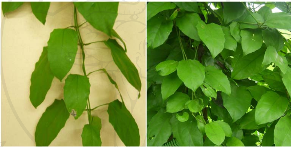
ภาพ 4-3 เครื่องนํ้านม (รางจืด)

สารพิษต่างๆ ออกจากร่างกาย ทางการอาเจียน ปัสสาวะ และทางเหงื่อ ดังคำระบุของหมอเมือง และผู้ที่เป็นโรคติดเชื้อ “รางจืดนี้จะล้างพิษ” “(รางจืด) มันช่วยได้หลายอย่างครับ มันช่วยแก้โรคประจำตัวเรา เหล้านี้บางที่เรากินไปแล้วผมว่ามันอาจจะถอนพิษได้เหมือนกันครับ” “สมมติว่าเมาเหล้านี้ละ เค้าก็จะเอาเครื่องนํ้านมต้มกิน มันจะทำให้หายเมาได้นะ เพราะว่ามันจะอาเจียนแล้วมันจะสร้างเมานะ (หายเมา) เวลาเราเมาเหล้าแล้วขำ (อาการเมาค้าง) เราก้จะใช้เครื่องนํ้านมนี้แหละ” “(รางจืด) ไซ้มันจะมีทางออกลงไปทางท่อปัสสาวะอย่างเดียว บางทีก็ออกจากรูขุมขนมันก็คายสารออกไป ที่มันคือหัวมันก็ทำให้โล่ง”