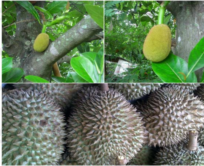
ภาพ 4-10 อาหารแสลงลม (ทุเรียนและขนุน)