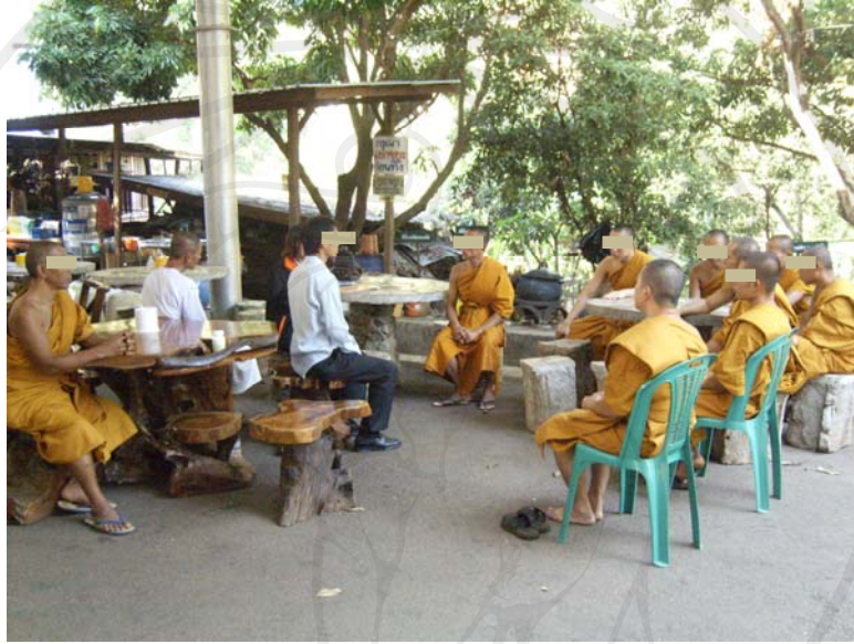
ภาพ 4-11 การบำบัดผู้ที่เป็โรคจิตสุราโดยใช้หลักพุทธศาสนา

การชักจูงให้ผู้ที่เป็โรคจิตสุราเห็นโทษของการติดสุรา เชี่ยวยาปัญหาทางด้านจิตใจ และเพื่อป้องกันไม่ให้ผู้ที่เป็โรคจิตสุรากลับไปดื่มสุราซ้ำ การใช้พุทธศาสนาเป็นสื่อกลางในการเลิกสุรา ประกอบไปด้วย วิธีการทางพิธีกรรมทางศาสนา คือ การบวชเพื่อเลิกสุรา การรักษาเบญจศีล การเลิกเหล้าเข้าพรรษา และการสอนให้คิดพิจารณาเหตุผล ดังสาระต่อไปนี้