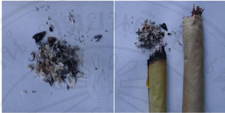
ภาพ 4-5 ซิบบุหรี่ยาจีน (ซิบบุหรี่ยาฉุน)

อย่างไรก็ตามหอมเมืองได้ให้แนวคิดเกี่ยวกับการใช้ซิบบุหรี่ยาจีนว่า ผลจากการผสมซิบบุหรี่ยาจีนในสุราเพื่อให้ผู้ที่เป็โรคติดสุราดื่มนั้น เป็นเพียงผลในการเบื่อเมาระยะสั้นหรือส่งผลทำให้ผู้ที่เป็โรคติดสุราเข็ดหลาบ และมีความรู้สึกไม่ยอกดื่มสุราในช่วงสั้นๆ ประมาณ 1 อาทิตย์เท่านั้น แต่หลังจากนั้นหากผู้ที่เป็โรคติดสุราไม่มีกำลังใจที่เข้มแข็งเพียงพอ หรือไม่ได้มีความตั้งใจที่อยากจะเลิกดื่มสุราอย่างจริงจัง ก็จะทำให้ผู้ที่ติดสุรากลั้บมาดื่มสุราอีก ดังนั้นการบำบัดรักษาและการดูแลสุขภาพของผู้ที่เป็โรคติดสุรา ที่จะได้ผลดีจะต้องใช้กับผู้ที่มีความต้องการ และมีความตั้งใจจริงในการเลิกสุรา “เอาซิบบุหรี่ใส่ในเหล้าแล้วก็คนๆ แล้วก็เอาให้เพื่อนกินนะ มันก็จะอยากอาเจียน เป็นอ้วก แล้วก็ม่กินเหล้าอีกหลายวันเลย แต่ส่วนมากก็กลับไปกินอีก แต่หลายคนก็คิดว่ามันกินไปก็ม่มีประโยชน์ก็เลิกนะ แต่ความจริงมันอยู่ที่ใจนะ มันอยู่ที่ใจ ถ้าใจจะเลิกมันก็เลิกได้ทันที แต่ถ้าใจม่เลิกบางครั้งเราอายุอะไรให้มันกินบางครั้งกลับมากินเหมือนเดิม มันเป็นเรื่องยาก”