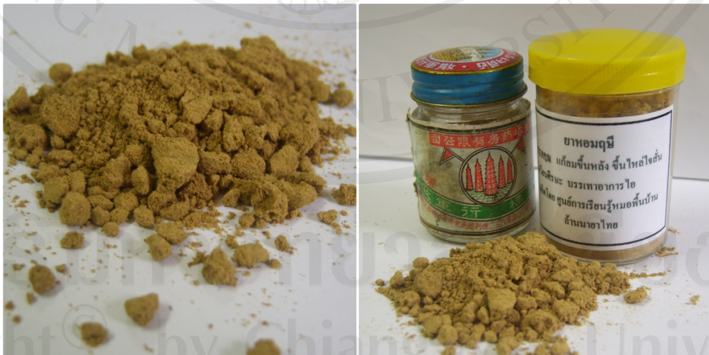
ภาพ 4-8 ยาหอม