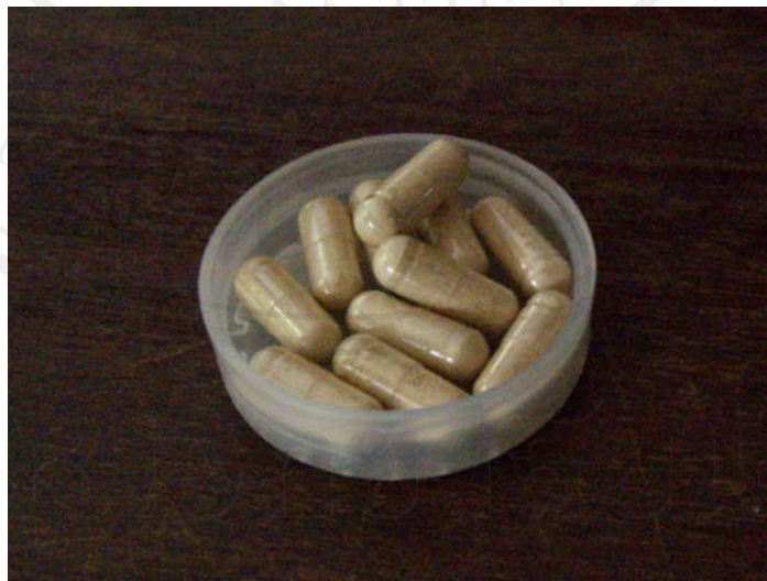
ภาพ 4-2 สมุนไพรสามรากแบบแคปซูล

“...ฝนนที่ละตัว เทคนิคการฝนนที่ให้ได้น้ำยาบางคนเขาก็บอกว่าฝนนเอาทิพย์คุณ ก็อาจจะฝนนเขาไม่ได้กำหนดขนาดนะ คือสมัยก่อนหมอเมือง บางคนก็จะบอกว่าเอา 3 หยด บางคนก็บอกว่าเอาแค่ตัวยาไหลคือ ฝนนไปฝนนมาน้ำยามันหยด มันจะมีสีขุ่นๆ...” “ยาฝนนที่ผมนกินนั้นแหละเป็นยาอัดเม็ด...เพราะว่ายาฝนนหมดตอนนี้เป็นอัดเม็ด เป็นแคปซูลไปละ”