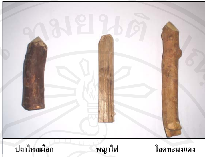
ภาพ 4-1 สมุนไพรสามราก

“...ฝนนที่ละตัว เทคนิคการฝนนที่ให้ได้น้ำยาบางคนเขาก็บอกว่าฝนนเอาทิพย์คุณ ก็อาจจะฝนนเขาไม่ได้กำหนดขนาดนะ คือสมัยก่อนหมอเมือง บางคนก็จะบอกว่าเอา 3 หยด บางคนก็บอกว่าเอาแค่ตัวยาไหลคือ ฝนนไปฝนนมาน้ำยามันหยด มันจะมีสีขุ่นๆ...” “ยาฝนนที่ผมนกินนั้นแหละเป็นยาอัดเม็ด...เพราะว่ายาฝนนหมดตอนนี้เป็นอัดเม็ด เป็นแคปซูลไปละ”