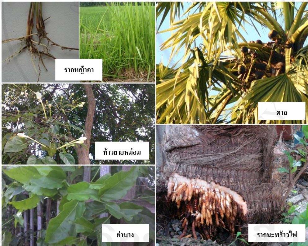
ภาพ 4-6 สมุนไพรสมุนไพร

สมุนไพรสมุนไพร จะดื่มประมาณ 1 แก้ว ก่อนกินอาหารในมือเช้าและมือเย็น “ยาถอนนี้กินก่อนข้าว ครั้งละแก้ว” “เราก็จะให้กิน สมมติยาต้ม (สมุนไพรสมุนไพร) นะก็กิน เช้าเย็น เช้าเย็นไป” ระยะเวลาของการรับประทานยาสมุนไพรสมุนไพรในผู้ที่ เป็นโรคติดเชื้อ จะขึ้นอยู่กับลักษณะอาการ ความรุนแรงของการติดเชื้อของผู้ที่เป็นโรคนั้นๆ ในแต่ละราย ซึ่งบางราย อาจจะต้องรับประทานเป็นเดือนๆ แต่บางรายก็รับประทานเพียง 10 วัน ทั้งนี้ก็ขึ้นอยู่กับว่าผู้ที่เป็น โรคนั้นๆ ยังคงมีอาการอยากดื่มอยู่หรือไม่ ถ้ามีอาการก็จะพิจารณาลดและหยุดยาได้ ดังคำกล่าว ของหมอเมือง “(ยาถอน) ก็กินแล้วแต่อาการ อาการคือดื่มมานานไหม กินมาเยอะจนสั้น จนอม (อาการตัวสั้น มือสั้น) ก็ต้องกินเป็นเดือน...” “ถ้ากินมันระยะว่า คนนี้เป็นเยอะ เราก็จะให้กิน โดยตั้ง กำหนดไว้ให้เค้าเดือนหนึ่งนะตั้งระยะไว้ให้กิน กินยาไปสักเดือน จนกระทั่งที่ว่าจิตใจที่เราอยาก กินเหล่านี้ค่อยลงมา ถอยลงมาแล้ว”