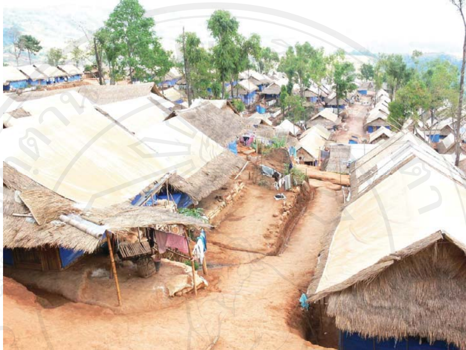
ภาพที่ 22-23 สภาพความเป็นอยู่ภายในที่ตั้งแห่งใหม่