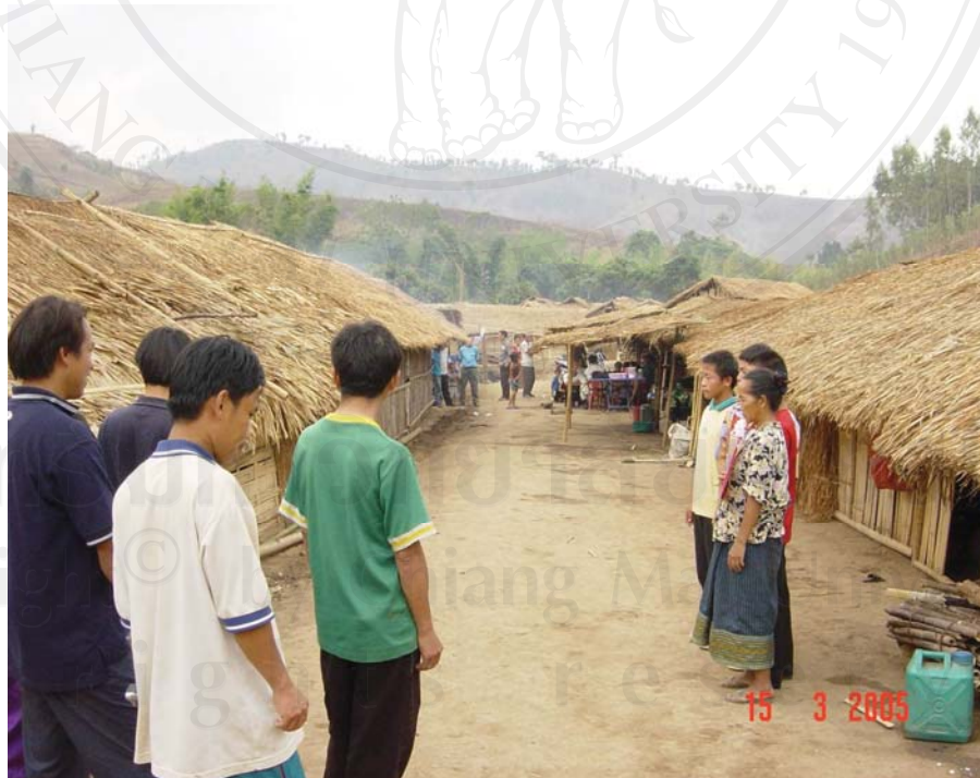
ที่มาภาพ : พ.ต.ต.สมบัติ บุญปาน (พนักงานสอบสวน สถานีตำรวจภูธรเมือง เพชรบูรณ์)