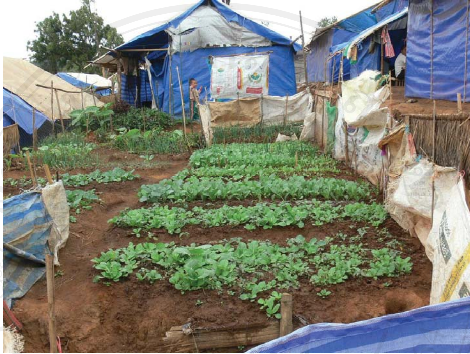
ภาพที่ 32-33 สภาพความเป็นอยู่ภายในที่ตั้งแห่งใหม่