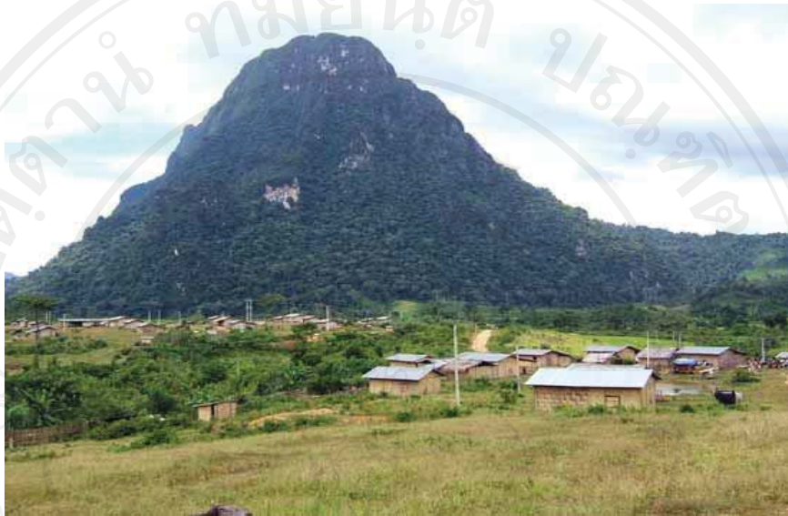
ภาพที่ 42-43 ภาพที่ปักพืงแห่งใหม่ บ้านพัฒนาผาหลัก เมืองกาสิ แขวงเวียงจันทน์ สปป. ลาว