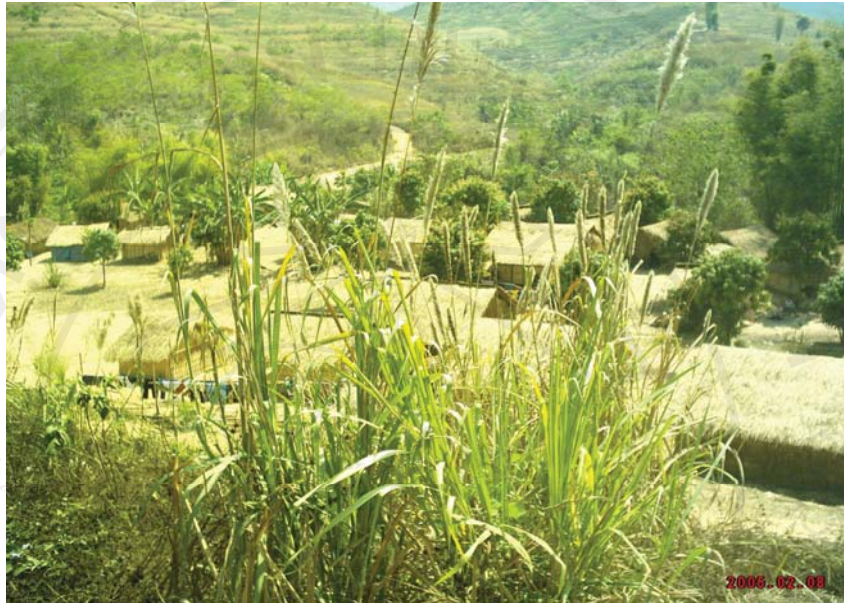
ภาพที่ 6-7 สภาพความเป็นอยู่ก่อนที่จะมีการจัดระเบียบและตั้งพื้นที่ควบคุมชั่วคราว ฉก.พตท.เขาค้อ