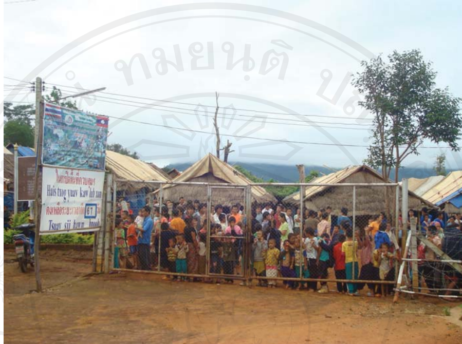
ภาพที่ 24-25 สภาพความเป็นอยู่ภายในที่ตั้งแห่งใหม่