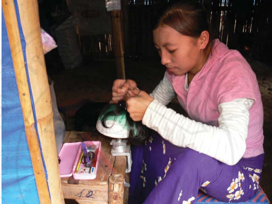
ภาพที่ 38-39 การส่งเสริมอาชีพให้แก่ชาวมังลาวก่อนส่งกลับภูมิลำเนา