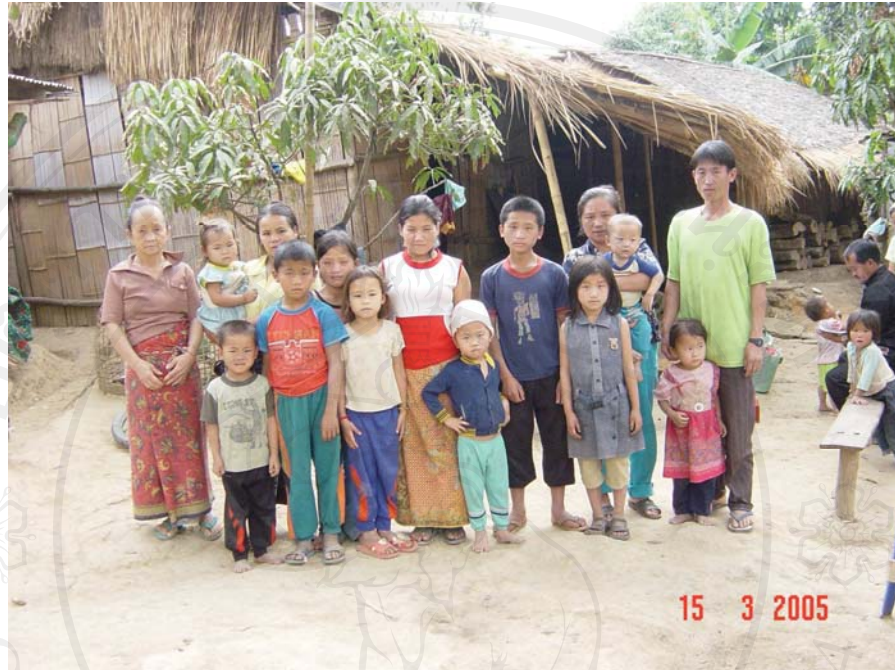
ภาพที่ 10-11 สภาพความเป็นอยู่ก่อนที่จะมีการจัดระเบียบและตั้งพื้นที่ควบคุมชั่วคราว นค.พตท.เขาค้อ