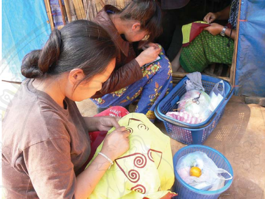
ภาพที่ 36-37 การส่งเสริมอาชีพให้แก่ชาวมังลาวก่อนส่งกลับภูมิลำเนา