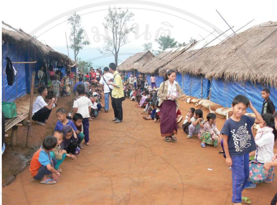
ภาพที่ 26-27 สภาพความเป็นอยู่ภายในที่ตั้งแห่งใหม่