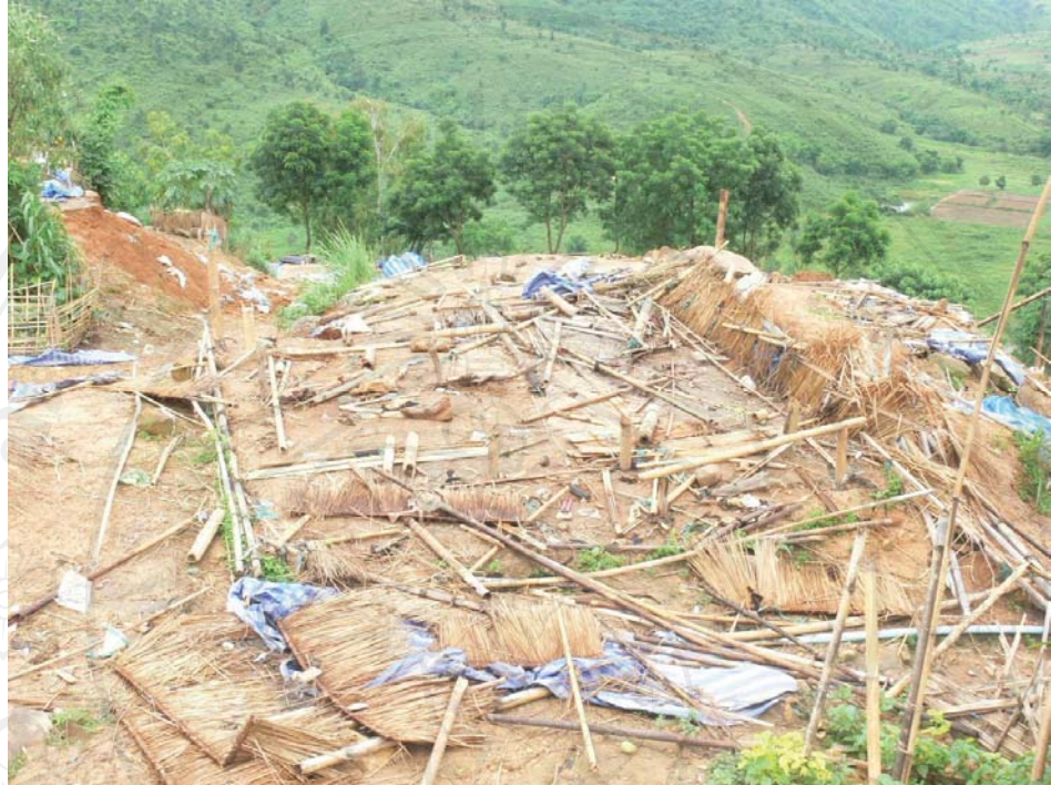
ภาพที่ 14-15 สภาพหลังการขนย้ายชาวม้งลาวไปอยู่ในพื้นที่ควบคุมชั่วคราวฯพื้นที่ใหม่