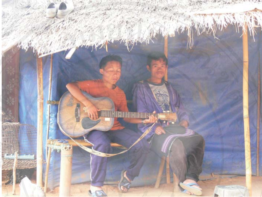
ภาพที่ 30-31 สภาพความเป็นอยู่ภายในที่ตั้งแห่งใหม่