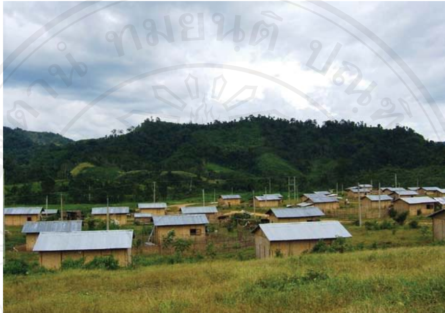
ภาพที่ 40-41 ภาพที่ปักพืงแห่งใหม่ บ้านพัฒนาผาหลัก เมืองกาสิ แขวงเวียงจันทน์ สปป. ลาว