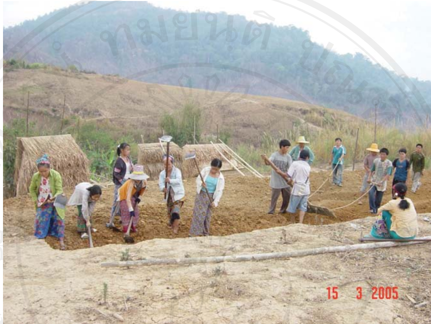
ภาพที่ 8-9 สภาพความเป็นอยู่ก่อนที่จะมีการจัดระเบียบและตั้งพื้นที่ควบคุมชั่วคราว ฉก.พตท.เขาค้อ