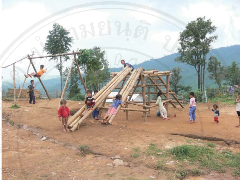
ภาพที่ 28-29 สภาพความเป็นอยู่ภายในที่ตั้งแห่งใหม่