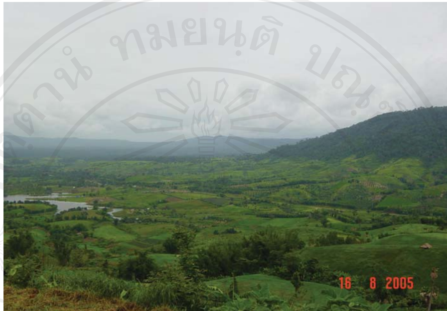
ภาพที่ 4-5 สภาพภูมิประเทศโดยทั่วไปของตำบลเข็กน้อย