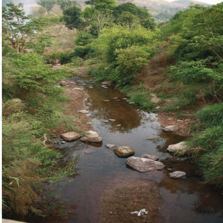
ภาพที่ 16-17 สภาพของลำห้วยเข็กภายหลังจากได้ทำการย้ายที่ปักพืงชั่วคราวฯไปพื้นที่แห่งใหม่แล้ว