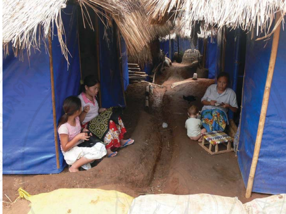
ภาพที่ 34-35 สภาพความเป็นอยู่ภายในที่ตั้งแห่งใหม่