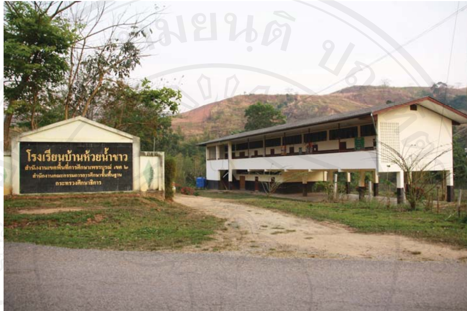
ภาพที่ 12-13 โรงเรียนบ้านห้วยน้ำขาว ที่ตั้งเดิมของพื้นที่พักพิงชั่วคราวฯ(พื้นที่เก่า) ในห้วงแรกที่มีการจัดตั้ง อค.พตท.เขาค้อ (พ.ศ.2549)