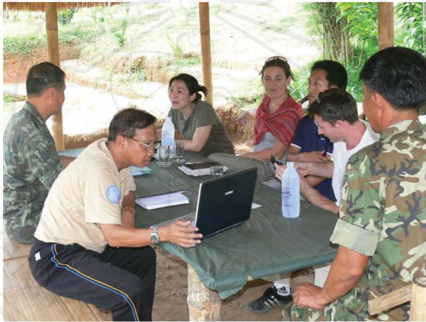
ภาพที่ 5.16 ทีมอาสาสมัครองค์กรแพทย์ไร้พรมแดนเข้าหารือและรายงานผลการดำเนินงาน