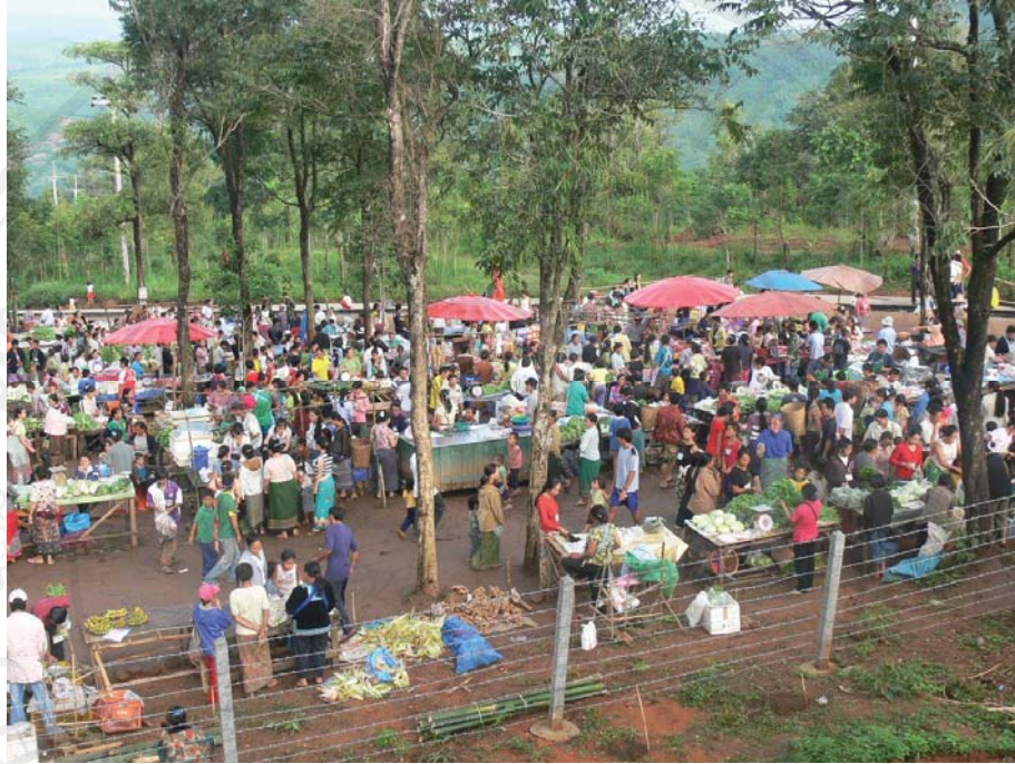
ภาพที่ 5.1-5.2 ตลาดเช้า โดยอนุญาตให้มีในบริเวณด้านหน้า จก.พตท.เขาค้อทุกวันเสาร์