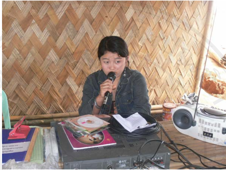
ภาพที่ 5.15 การแจ้งข่าวประชาสัมพันธ์ภายใน นคร.พตท.เขาค้อ