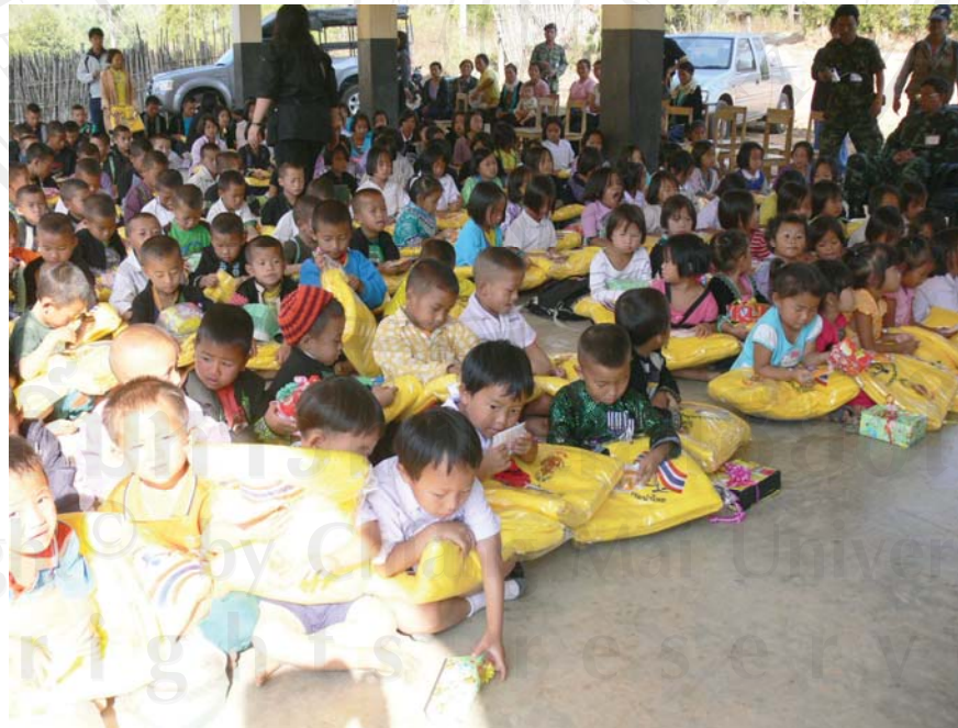
ที่มา : หน่วยเฉพาะกิจผสมพลเรือน ตำรวจ ทหารเขาค้อ (ฉก.พตท.เขาค้อ)