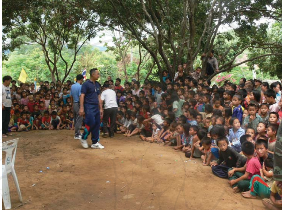
ภาพที่ 5.3-5.4 กิจกรรมสันตนาการต่างๆ จากมูลนิธิรักไทยและจากอาสาสมัครชาวเกาหลี