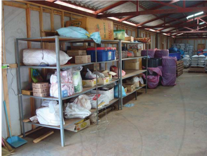
ภาพที่ 5.17 - 5.18 อาคารสโตร์เก็บเครื่องอุปโภคบริโภคสำหรับแจกจ่าย ขององค์กร อาสาสมัครแพทย์ไร้พรมแดน