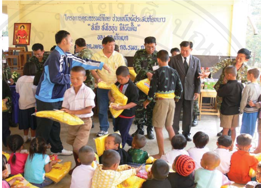
ภาพที่ 5.12-5.13 เจ้าหน้าที่ทหารแจกผ้าห่มแก่เด็กทั้งม้งลาวและม้งไทย