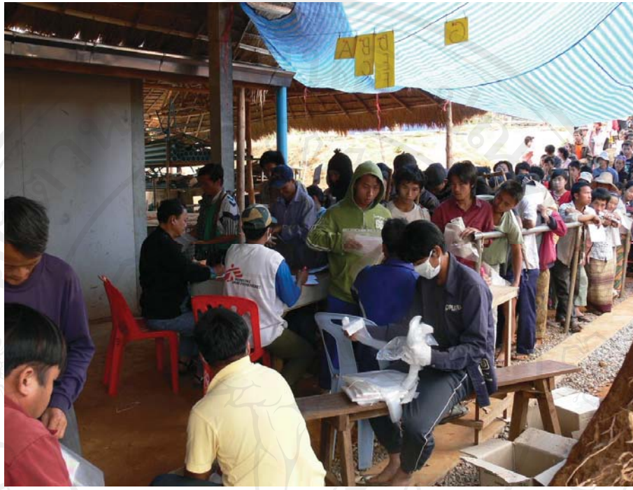
ภาพที่ 5.19 – 5.20 บรรยากาศในการแจกจ่ายเครื่องอุปโภคบริโภค