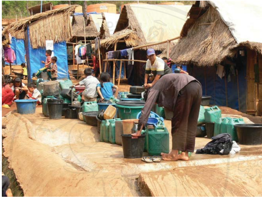
ภาพที่ 5.9 เด็กหญิงชาวมังลาวกับแกลลอนใส่น้ำ