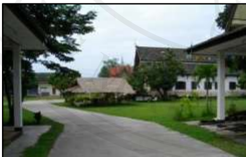
รูปที่ ๑.๘ วัดชัยสถิตย์