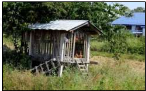
รูปที่ ๑.๗ หอผีเสื่อนา