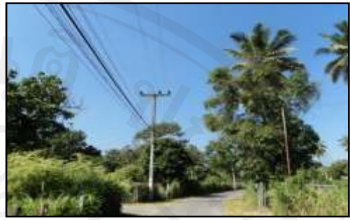
รูปที่ ๑.๕ เส้นทางเข้าหมู่บ้าน