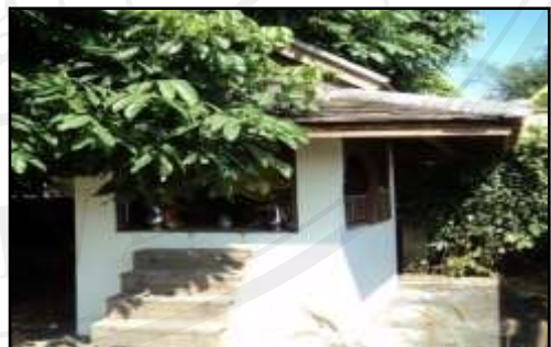
รูปที่ ๑.๙ หอผีเสื่อวัด