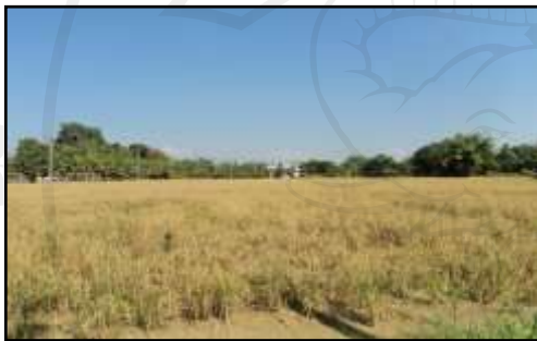
รูปที่ ๑.๖ การประกอบอาชีพเกษตรกรรม