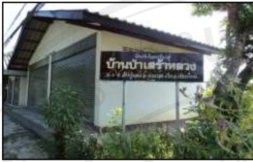
รูปที่ ๑.๔ ป้ายหมู่บ้านป่าเส้าหลวง