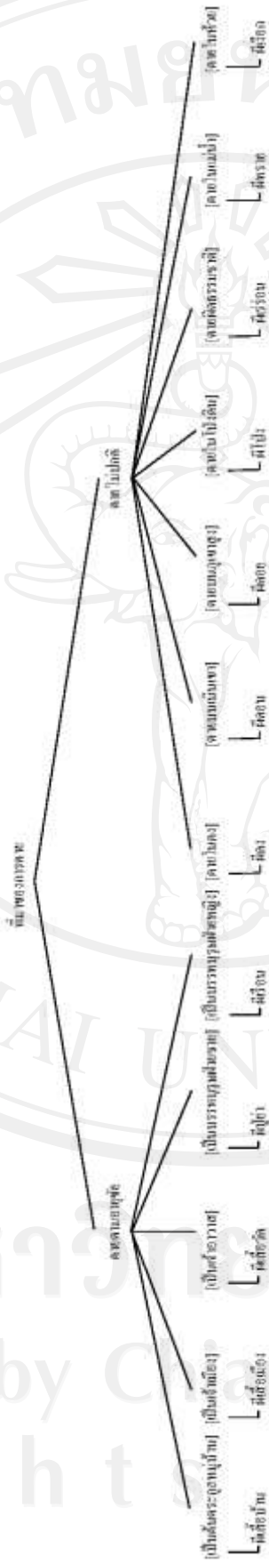
แผนผังที่ ๓.๗ มิติแห่งความแตกต่างเรื่อง “ที่มาของนิทานพื้นบ้านไทยถิ่นเหนือ” ของคำเรียกนิทานพื้นบ้านไทยถิ่นเหนือ