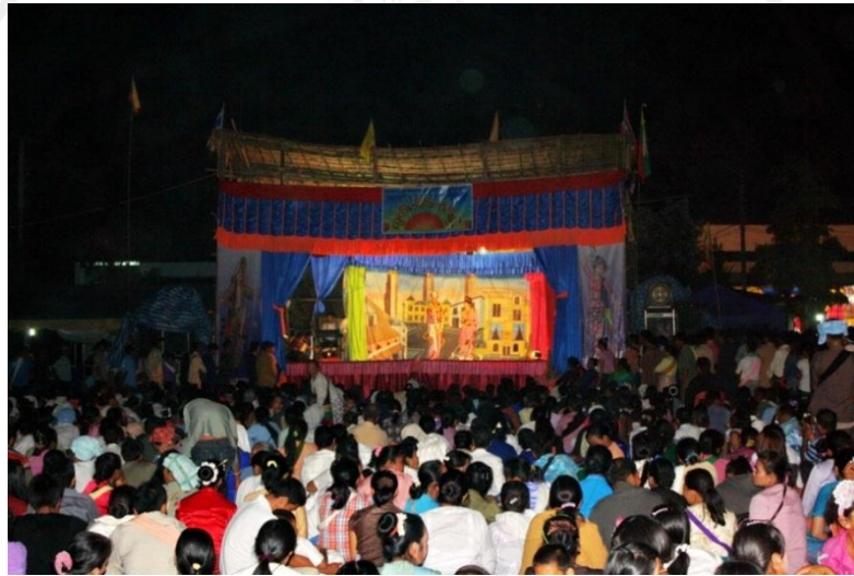
รูปที่ 70 ความนิยมของคนรับชมจอไตในงานปอย

ดั่งสื่อในสมัยนั้นแต่สำหรับกลุ่มวัยรุ่นไทใหญ่ปัจจุบันมีการเสพลีและความเจริญมากยิ่งขึ้น ดังนั้นอาจไม่จำเป็นต้องพึ่งพาการรับชมความบันเทิงผ่านจอไตอย่างในอดีตแต่ก็ได้ละเว้นการรับชมจอไต เนื่องจากเคยผ่านระบบปลุกฝังให้นั่งดูจอไตตั้งแต่เด็ก อนาคตความนิยมจอไตจะเป็นเช่นไรไม่มีอะไรชี้วัดได้แน่นอน ขึ้นอยู่กับความมีสำนึกของการหวงแหนทางวัฒนธรรมที่คงต้องตกอยู่ในกลุ่มเยาวชนไทใหญ่ให้เป็นผู้ตัดสิน