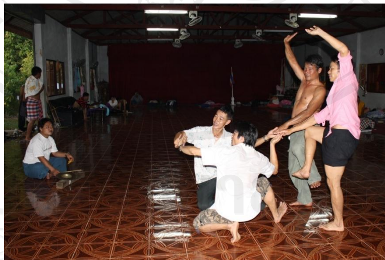
รูปที่ 64 การฝึกท่าใหม่ก่อนขึ้นแสดงจ๊าดไต

ครอบครัวแน่ ด้วยเหตุผลบีบบังคับทางเศรษฐกิจเหล่านี้นักแสดงบางคนจึงต้องจำยอมออกจากบ้าน เพื่อออกมาหางานทำ แต่ก็มิได้ละเลิกละความเป็นจ๊าดไตยังคิดคำนึงถึงการแสดงจ๊าดไตอันเป็นการแสดงที่ยังคงฝังอยู่ในสายเลือดด้วยการหาโอกาสกลับมาช่วงงานเทศกาลสำคัญของชาวไทยใหญ่กับคณะดั้งเดิมถ้าหากตนสามารถปลีกเวลามาได้ นักแสดงในคณะมองถึงแรงบันดาลใจในการกลับมาเล่นจ๊าดไตถึงแม้ว่าตัวจะอยู่ไกลพื้นที่ที่จะไปแสดงแค่ไหนแต่ก็ไม่ได้เป็นอุปสรรคในการเดินทาง เพราะเขามองว่า “เราเป็นลูกจ้างทำงานในเมืองใหญ่ไม่มีใครเห็นความสามารถของเรา แต่พอเรากลับมาแสดงจ๊าดไตในพื้นที่คนไทใหญ่เราก็มีคนพิเศษที่พวกเขาเห็นคุณค่า”(ข้อมูลการสัมภาษณ์ ตานहु่ นักแสดงคณะจ๊าดไตยอดแข้งแดงใหม่ อายุ 24 ปี )ปัญหานักแสดงขาดแคลนมักเกิดขึ้นกับกลุ่มนักแสดงวัยรุ่นเสียส่วนมากด้วยเหตุผลดังที่กล่าวมา แต่นักแสดงรุ่นพ่อ รุ่นแม่กลับยังคงเป็นกลุ่มเดิม ทำอาชีพทำไร่ ทำสวน รับจ้างทั่วไปตามหมู่บ้านของตน อาจมีบางคนที่เดินทางออกมาหางานทำต่างจังหวัดแต่ก็พยายามกลับมาเติมเต็มพลังให้กับชีวิตและทำหน้าที่ของการเป็นจ๊าดไตด้วยการกลับตามวาระโอกาสเท่าที่จะปลีกเวลากลับมาได้ ซึ่งสมาชิกคนเก่าแก่ในวงจะเข้าใจดีเกี่ยวกับเหตุผลการขาดแคลนนักแสดงและการต้องหาสมาชิกใหม่ในวงเข้ามาเรื่อยๆ ด้วยวิธีการข้างต้นเพื่อสร้างคนรุ่นใหม่หัวใจรักวัฒนธรรมไทใหญ่ช่วยกันสืบสานลมหายใจทางวัฒนธรรมผ่านการแสดงจ๊าดไตให้มีการสืบเนื่องต่อไปถึงแม้ว่าการค้นหาอาจเจออุปสรรคและอาจไม่ได้เป็นอย่างใจหวังไว้ก็ตาม