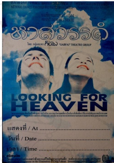
รูปที่ 68 โปสเตอร์ประชาสัมพันธ์ละครชุมชนเรื่องหาสวรรค์