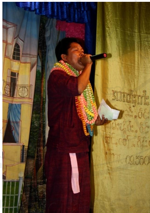
รูปที่ 62 จายมูหริ่งด๊ะ ฟังบุญ หมอกความประจำคณะขอคแซงแลงใหม่