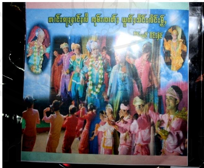
รูปที่ 59 ซีตีการแสดงคณะจ้าไตยอดแขวงแลงใหม่

จากบทเพลงทั้งหลายนี้ประเด็นหลักของการผลิตซีตีนั้นแน่นอนต้องมีเรื่องราวได้เข้ามาทางศิลปินมีการตกลงว่ารายได้ร้อยละ 50 จะแบ่งเข้าเงินกองกลางของคณะเพื่อนำไปจัดสรรการพัฒนาคณะต่อไปแต่รายได้ไม่ได้เป็นตัวสำคัญของการผลิต หากแต่เป็นตัวช่วยในการประชาสัมพันธ์เกี่ยวกับการมีหมอกความที่มีความสามารถในการร้อง การแต่งบทเพลง ให้ผู้ชมนั้นเกิดความชื่นชอบประทับใจในตัวศิลปินและติดตามคณะจ้าไตยอดแขวงแลงใหม่ เพื่อเป็นตัวช่วยอย่างหนึ่งให้คณะมีผู้ติดตาม หรือ “แฟนคลับ” ของคณะอันเป็นพลังขับเคลื่อนของกำลังใจนักแสดงให้สืบสานการแสดงจ้าไตและมีแรงใจในการผลิตบทเพลงอันทรงคุณค่าทางจิตใจของคนไทใหญ่นี้ต่อไป