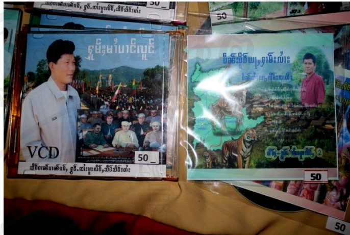
รูปที่ 60 แผ่นเสียงแสวงไตของหมอกวามในคณะยอดแสวงแสงใหม่