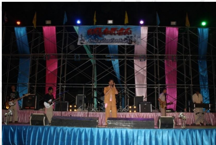
รูปที่ 67 วงดนตรีบ้านใหม่บ้านหลักแต่ง

ของคณะจำกัดโดยอดแสวงแสงใหม่) นับว่าจำกัดไต้หวันมีความหลากหลายทางการแสดงเพื่อเป็นจุดดึงดูดคนดูและการมีนักแสดงมากไปด้ด้วยความสามารถมากกว่าดนตรีบ้านใหม่ จึงไม่แปลกที่จำกัดไต้หวันจะเป็นฝ่ายชนะบ้านใหม่อย่างขาดลอย มีหลายคนบอกว่าสมัยก่อนบ้านเมืองไทใหญ่ในรัฐฉานไม่มีไฟฟ้าใช้ ไม่มีทีวีให้ดูเหมือนตอนมาอยู่ไทย ทีวีของเขาก็คือละครจากการรับชมจำกัดไต้หวันนั้นถึงเข้ามาอาศัยอยู่ในประเทศไทยแล้วได้ดูทีวีมากยิ่งขึ้นแต่ก็รู้สึกชอบดูละครจากจำกัดไต้หวันมากกว่า เพราะมันคือละครสดและมีเนื้อหาโดนใจกับชีวิตของคนไทใหญ่ แม้ว่าละครไทยมักจะผลิตหนังในเชิงละครน้ำเน่าก็ตามแต่หากได้มาสัมผัสกับชีวิตของคนไทใหญ่ผู้ผ่านความลำบากแล้วดีแต่ออกมาทางละครจำกัดไต้หวันคิดว่าละครน้ำเน่าของไทยต้องพ่ายไปเลยทีเดียว แต่นั่นก็ไม่ได้หมายถึงว่าจำกัดไต้หวันมีชัยชนะเหนือดนตรีบ้านใหม่เสมอไปเนื่องจากปัจจุบันกระแสโลกาภิวัตน์ ทุนนิยม บริโภคนิยม กำลังคุกคามเข้ามายังสังคมไทใหญ่อย่างมิสามารถต้านทานได้ จำกัดไต้หวันต้องมีการปรับตัวให้อยู่รอดภายใต้คู่แข่งสำคัญอย่างวัฒนธรรมบ้านใหม่ได้มาน้อยเพียงใด ได้แต่หวังใจว่าการรักษาจำกัดไต้หวันแบบดั้งเดิมของคณะอดแสวงแสงใหม่นั้นยังคงรักษาระดับและมีการพัฒนาให้ยังคงสืบต่อไปบนพื้นฐานของจำกัดไต้หวันแบบดั้งเดิมอยู่ เพื่อให้แข่งอัตลักษณ์ทางวัฒนธรรมไว้ตราบนาน