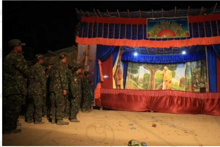
รูปที่ 61 เหล่าทหารบนคอยไตแลงกำลังรับชมความบันเทิง