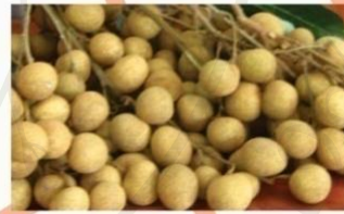
ภาพที่ 2.2 ปกหน้า (ด้านใน) ของบัญชีต้นทุนการทำสวนลำไย (2)