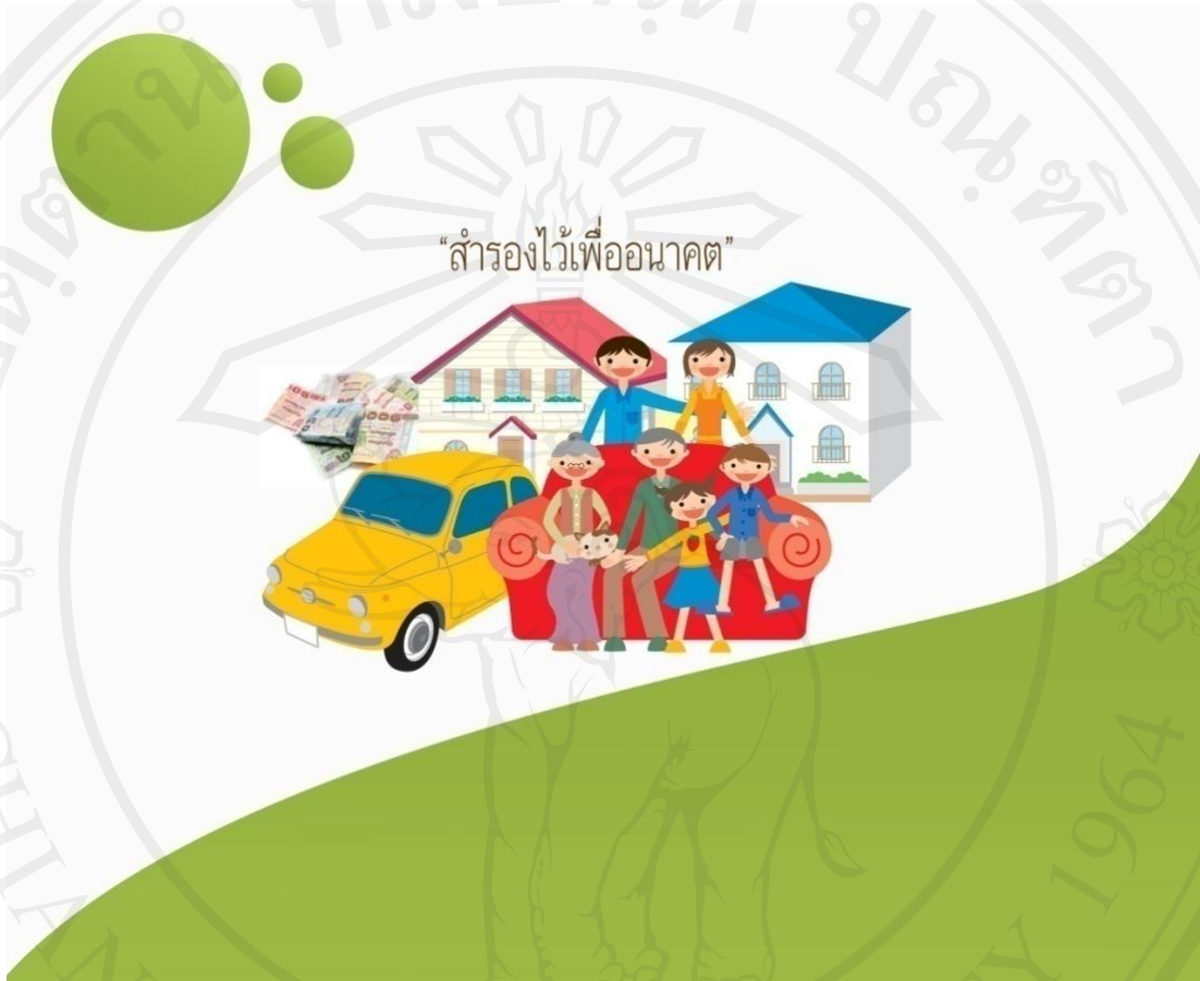
ภาพที่ 2.16 ปกหลัง (ด้านนอก) ของบัญชีต้นทุนการทำสวนลำไย (2)