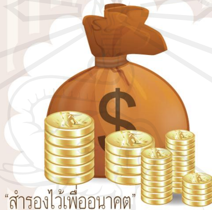
ภาพที่ 1.7 ปกหลัง ของบัญชีต้นทุนการทำสวนลำไย (1)