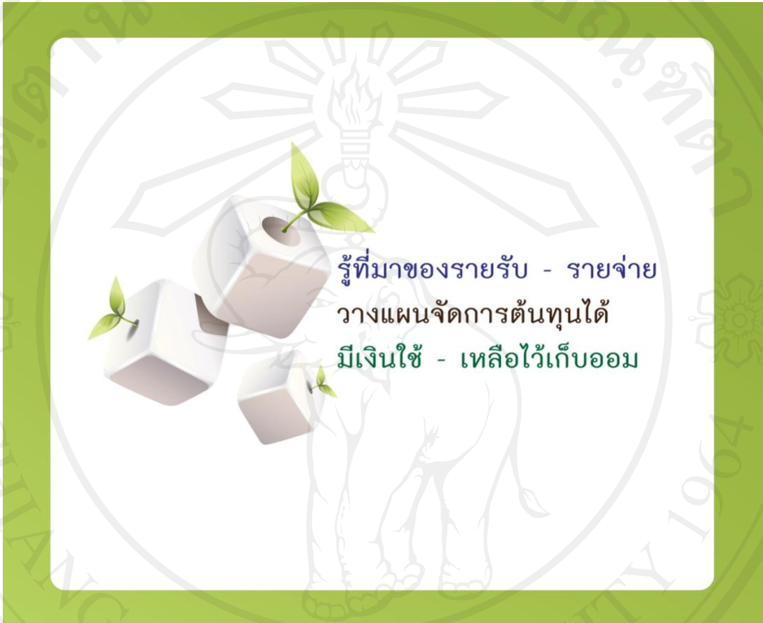
ภาพที่ 2.15 ปกหลัง (ด้านใน) ของบัญชีต้นทุนการทำสวนลำไย (2)