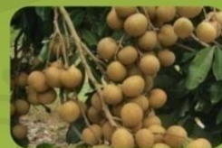
ภาพที่ 2.1 ปกหน้า (ด้านนอก) ของบัญชีต้นทุนการทำสวนลำไย (2)