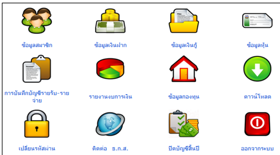
ภาพที่ 2 แสดงเมนูและกิจกรรมต่างๆ

โปรแกรมระบบบัญชีกองทุนหมู่บ้าน ได้พัฒนาขึ้น โดย ธ.ก.ส. ร่วมกับ สำนักงานกองทุน หมู่บ้านและชุมชนเมืองแห่งชาติ เพื่อช่วยในการทำงานของคณะกรรมการกองทุนหมู่บ้านและชุมชน เมือง ในการจัดทำบัญชีได้อย่างถูกต้องตามระเบียบที่กำหนดและเป็นปัจจุบัน ช่วยให้กองทุนสามารถ นำข้อมูลที่ได้ไปใช้ในการบริหารจัดการได้อย่างมีประสิทธิภาพ และเตรียมความพร้อมในการยก ฐานะเป็นสถาบันการเงินชุมชนในโอกาสต่อไปตามเจตนารมณ์แรกเริ่มของการจัดตั้งกองทุนหมู่บ้าน และชุมชนเมือง โปรแกรมระบบบัญชีกองทุนหมู่บ้านแบ่งออกเป็น 12 เมนู ตามภาพที่ 2 แสดง เมนูและกิจกรรมต่างๆ