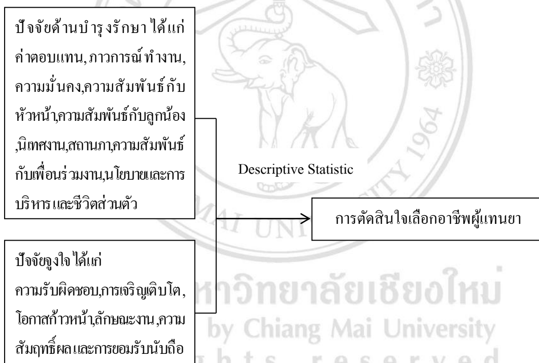
ภาพที่ 1 กรอบแนวคิดการค้นคว้าแบบอิสระของ ดุสิต กิ่งสุคนธ์ (2551)

ดุสิต กิ่งสุคนธ์ (2551) ได้ศึกษาเรื่องปัจจัยจูงใจที่มีผลต่อการเลือกอาชีพผู้แทนขายของนักศึกษา คณะเกษตรศาสตร์ มหาวิทยาลัยเชียงใหม่ ทำการเก็บข้อมูลจากนักศึกษาจำนวน 168 คน โดยใช้แบบสอบถามเกี่ยวกับทฤษฎีสองปัจจัยของ เฮอรัชเบอร์ค คือ ปัจจัยจูงใจที่มีผลต่อการเลือกอาชีพผู้แทนขายปัจจัยด้านบำรุงรักษาทั้ง 10 ด้าน คือ ด้านนโยบายและการบริหาร ด้านนิเทศงาน ด้านความสัมพันธ์กับหัวหน้า ด้านภาวะการณ์ทำงาน ด้านค่าตอบแทน ด้านความสัมพันธ์กับเพื่อนร่วมงาน ด้านชีวิตส่วนตัว ด้านความสัมพันธ์กับลูกน้อง ด้านสถานภาพและด้านความมั่นคง และศึกษาเกี่ยวกับด้านปัจจัยจูงใจทั้ง 6 ด้าน คือ ด้านความสัมฤทธิ์ผล ด้านการยอมรับนับถือ ด้านลักษณะงาน ด้านความรับผิดชอบ ด้านปัจจัยโอกาสก้าวหน้าและด้านการเจริญเติบโต โดยมีกรอบแนวคิดและวิธีที่ใช้ในการวิจัย ดังภาพที่ 1