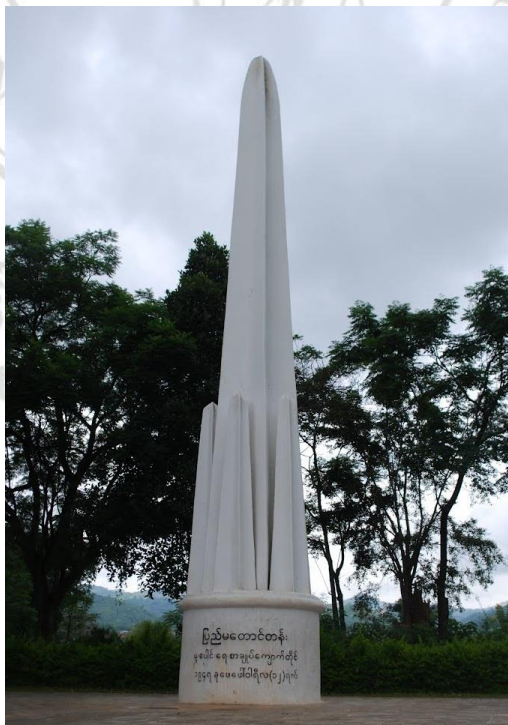
ภาพที่ 3.6 อนุสาวรีย์ปางโหลง