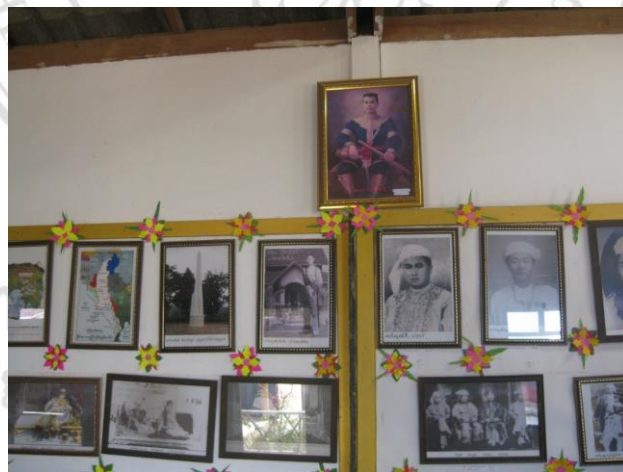
ภาพที่ 3.3 รูปสมเด็จพระนเรศวรฯและเจ้าฟ้าเมืองต่างๆ ในหอประวัติศาสตร์วัดฟ้าเวียงอินทร์ ตำบลเปียงหลวง อำเภอเวียงแหง

โครงสร้างการปกครองระบอบเจ้าฟ้า ยังคงสอดคล้องกับโครงสร้างการสร้างตำนานการกำเนิดของอาณาจักร ดังที่กล่าวไปแล้วนั้นว่า ฟ้า เป็นสิ่งสูงสุดในการประทาน “เจ้าฟ้า” มาปกครองดินแดน ดังนั้นประวัติศาสตร์ของไทใหญ่จะต้องมีเรื่องของ “วีรบุรุษ” ที่เป็นทั้งนักรบและนักปกครองที่เก่งกาจ มีตำนานเล่าขานการเกิดที่ผิดแผกจากมนุษย์ทั่วไป และเป็นต้นแบบของนักปกครองในยุคต่อมา ทั้งนี้โครงสร้างการปกครองและการสร้างประวัติศาสตร์ที่เล่าผ่าน วีรบุรุษแห่งชาติ นั้น ไม่พบเพียงเฉพาะไทใหญ่เท่านั้น ทั้งไทย และพม่า ก็ใช้หลักการนี้เช่นกัน เรียกว่ามีจุดร่วมในการใช้โครงสร้างการสร้างประวัติศาสตร์แบบราชาชาตินิยม (Royal- national history) นั่นเอง