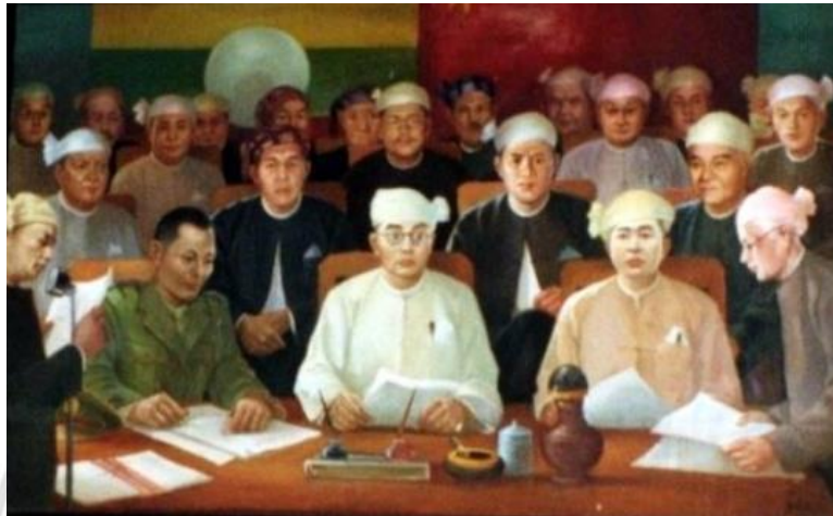
ภาพที่ 3.5 การลงนามสนธิสัญญาปางโหลง เจ้าส่วยไตได้รับการเลือกตั้งเป็นประธานาธิบดีคนแรกของสหภาพพม่า (คนกลาง) ที่มา: www.english.panglong.org

ก่อให้เกิดความวุ่นวายภายในประเทศ จนกระทั่งนายพลเนวินเข้ามาทำการยึดอำนาจ และสนธิสัญญาปางโหลงก็ถูกยกเลิกไป