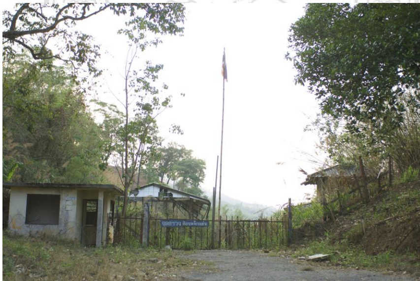
ภาพที่ 3.8 ช่องหลักแต่ง ชายแดนไทย-พม่า ตำบลเปียงหลวง

พื้นที่ตำบลเปียงหลวงเป็นพื้นที่ที่มีพรมแดนและเส้นทางเดินเท้าเข้าสู่รัฐฉาน ประเทศพม่า ผ่านช่องหลักแต่ง มีหมู่บ้านไทใหญ่ในเขตรัฐฉานใกล้เคียงช่องหลักแต่ง 2 หมู่บ้าน คือ ปางก้ำก่อ ปางใหม่สูง ทำให้เมื่อมีสถานการณ์ทางการเมืองที่ไม่สู้ดีนักของพม่า การปราบปราม กองกำลังชาติพันธุ์ เมื่อปี 2545 บริเวณนี้ได้เกิดการสู้รบอย่างรุนแรงระหว่างทหารพม่ากับ กองกำลังไทใหญ่ SSA เป็นเหตุให้ชาวบ้านจากหลายหมู่บ้านในฝั่งรัฐฉาน รวมถึงสอง หมู่บ้านใกล้เคียงช่องหลักแต่ง ถูกขับไล่อพยพเข้ามาตั้งศูนย์ลี้ภัยอยู่ในฝั่งไทยเกือบ 1,000 คน ในฐานะผู้อพยพลี้ภัยทางการเมือง (กลุ่มอพยพกลุ่มที่ 3) และรัฐบาลไทยได้มีการจัดพื้นที่เขต อพยพให้ผู้ลี้ภัยเหล่านี้อยู่ที่ ศูนย์อพยพกรุงจ่อ ตำบลเปียงหลวง