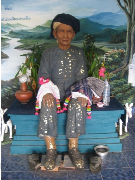
ภาพที่ 3.9 อนุสาวรีย์ปู่เหงชาววา ในศาลปู่เหงชาววา บ้านเมืองแหง ต. เมืองแหง

จากการศึกษาพบว่า ในภาพการรับรู้ของคนท้องถิ่นนั้นเชื่อว่าปู่เหง ชาววาเป็นบุคคลจริงในประวัติศาสตร์ ซึ่งนักประวัติศาสตร์และนักมานุษยวิทยาโดยทั่วไปแล้วก็อาจจัดเจ้าปู่เหงเป็นบุคคลในตำนาน ผู้นำในตำนาน หรือวีรบุรุษในตำนาน เพราะเป็นเรื่องเล่าที่ไม่สามารถหาข้อสรุปหรือข้อพิสูจน์ความถูกต้องของข้อมูลได้ โดยคนในท้องถิ่นมีวิธีการสืบทอดตำนานโดยคำบอกเล่ารุ่นต่อรุ่น หรือที่เรียกว่ามุขปาฐะตำนานปู่เหง ชาวนั้น เปรียบได้เป็นตำนานวีรบุรุษผู้สร้างบ้านแปงเมืองของชุมชนเวียงแหงยุคแรก การสร้างตำนานมักมีการบอกเล่าที่เกินจริงเพื่อเสริมสร้างความยิ่งใหญ่และให้เป็นที่น่านับถือยำเกรงมากขึ้น อย่างในกรณีตำนานปู่เหงเองนั้น ข้อสังเกตอย่างหนึ่งที่ทำให้ตำแหน่ง เหง (การควบคุมประชากร ต้องมีจำนวนตั้งแต่ 1000 หลังคาเรือน) ซึ่งขัดแย้งกับในสมัยที่เมืองแหง ไม่ได้มีสถานะเป็นอำเภอ เพียงแต่เป็นเมืองค้าขายแถบชายแดน คาดว่าจำนวนครัวเรือนไม่ถึง 1000 หลังคาเรือน แต่น่าจะเป็นเป็นการให้เกียรติผู้ก่อตั้งมากกว่า ข้อสังเกตอีกประการหนึ่งคือ ตำนานปู่เหงนั้นได้รับการยอมรับแต่ไม่ได้เป็นที่นิยมในทางปฏิบัติระดับพิธีกรรมเท่าใดนัก เพราะจากสภาพศาลที่ตั้งไว้รวมถึงอนุสาวรีย์ก็ถูกละเลย ส่วนหนึ่งมาจากความเชื่อและตำนานของสมเด็จพระ