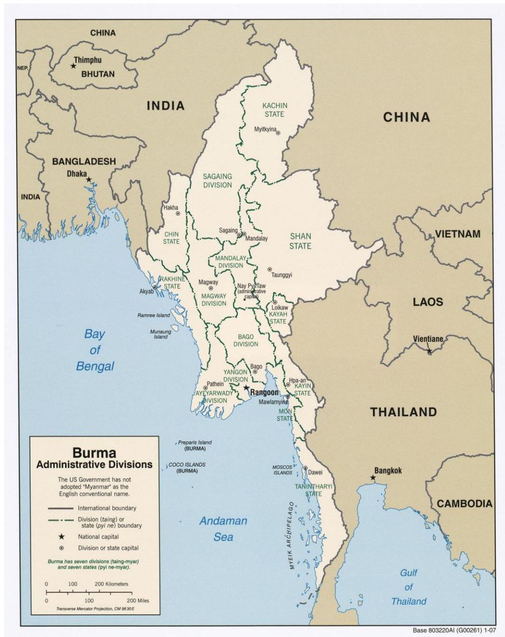
ภาพที่ 3.4 การแบ่งเขตการปกครองของพม่า

ต้นแบบของการสร้างอุดมการณ์ชาตินิยม โดยแบบเรียนประวัติศาสตร์ทั้งหมดเป็นของพม่า และห้ามการเรียนการสอนที่บรรจุแบบเรียนประวัติศาสตร์ไทใหญ่