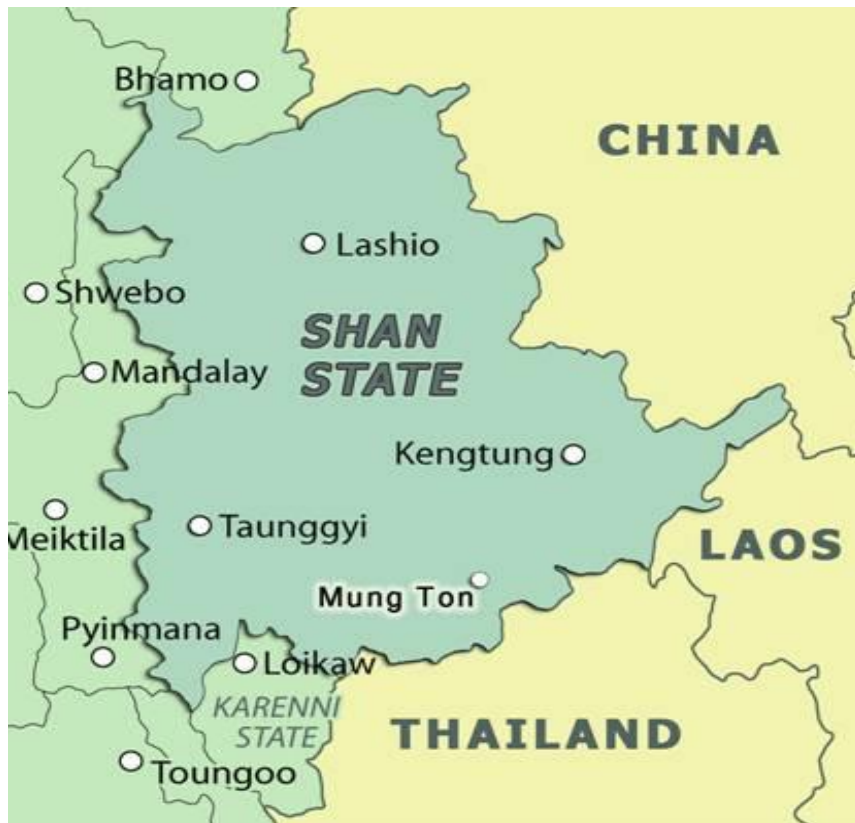
ภาพที่ 3.2 แผนที่รัฐฉาน มีเมืองหลวงคือเมืองตองกิ (ตัวนตี)