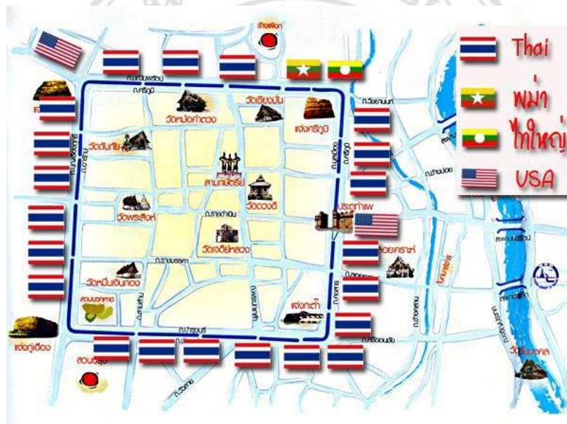
ภาพที่ 3.1 แผนผังการคาดคะเนการเล่นน้ำสงกรานต์รอบคูเมืองเชียงใหม่ของแต่ละชาติ

ตามการพาดหัวข่าวเนื่องจากภาพลักษณ์ของกลุ่มไทใหญ่ไม่ค่อยดีนักใน เมื่อเกิด เหตุการณ์ก่อความไม่สงบ การไม่ยอมรับกลุ่มคนไทใหญ่ของคนไทยนั้นแสดงออก หลายทาง แม้กระทั่งแผนผังแสดงพื้นที่เล่นน้ำสงกรานต์ที่ถูกส่งต่อทางสื่อสังคม ออนไลน์ มีวัตถุประสงค์ที่แจ้งเขตการเล่นน้ำของแต่ละชาติไว้ พร้อมข้อความเตือนที่มี นัยยะสร้างภาพความรุนแรงและผู้ก่อความไม่สงบไว้ว่า “อยากเถื่อน เชิญแจ้งศรีภูมิ” 3 ซึ่งรวมไปถึงกลุ่มแรงงานพม่าด้วยเช่นกัน ในขณะที่กลุ่มคนอเมริกันมีภาพลักษณ์ที่ ดีกว่า เพราะเป็นกลุ่มนักท่องเที่ยวต่างชาติ