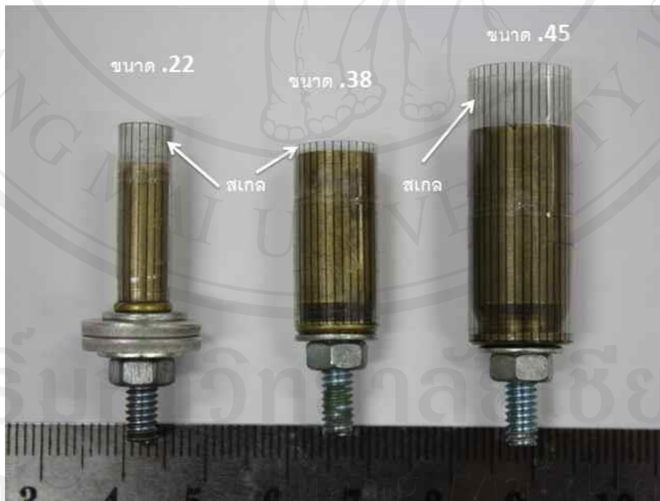
ภาพแสดงตัวจับยึด