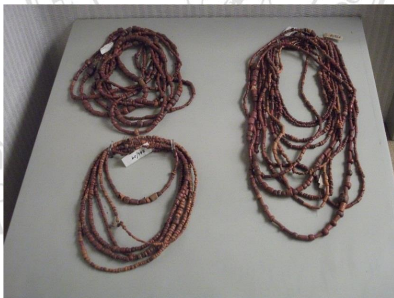
ภาพที่ 2.5 ลูกปัดดินเผาไม่เคลือบ พบที่แหล่งโบราณคดีสมัยทวารวดี

ลูกปัดหิน ได้แก่ หินคาร์เนเลียน (carnelian) ดังภาพที่ 2.7 ซึ่งมีสีส้ม พบว่าได้รับความนิยมนำมาทำลูกปัดเป็นอย่างมาก และพบแล้วตั้งแต่สมัยก่อนประวัติศาสตร์ รองลงมาได้แก่ หินอาเกต (agate) สีดำสลับขาว และอื่นๆ เช่น หินควอทซ์ แกลซิโตนี โมรา ออนิกซ์ โคมอลท์ และจำพวกรัตนชาติ เช่น นิล มุขราคัม โกเมน หยก เป็นต้น ลูกปัดที่ทำจากหินนี้จะมีรูปทรงที่แตกต่างกันออกไป ได้แก่ ทรงกลมรี ซึ่งพบเป็นจำนวนมาก อาจกลมเป็นแบบผลส้ม กลมแบน กลมรีแบบลูกมะกอกหรือแบบเม็ดถั่วลิสง เป็นต้น ทรงกระบอก เป็นรูปแบบที่พบอยู่โดยทั่วไปเช่นเดียวกัน มีทั้งสั้นและยาว ทรงกระบอกแบบถังเบียร์ รวมทั้งความนิยมในการสลักรูป ทั้งตามขวางและตามยาว และทรงเหลี่ยมต่างๆ เป็นรูปแบบที่ต้องตกแต่งเป็นพิเศษ และจะพบในกลุ่มลูกปัดหินเป็นส่วนใหญ่ เพราะเป็นการตกแต่งเฉพาะชิ้น เช่น แปดเหลี่ยมลูกบาศก์ สี่เหลี่ยมผืนผ้า สี่เหลี่ยมขนมเปียกปูน และหลายๆ เหลี่ยม เป็นต้น