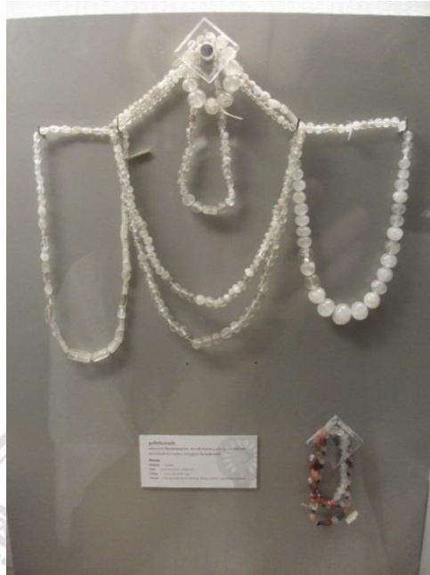
ภาพที่ 2.3 ลูกปัดหินควอทซ์ พบที่แหล่งโบราณคดีสมัยทวารวดี