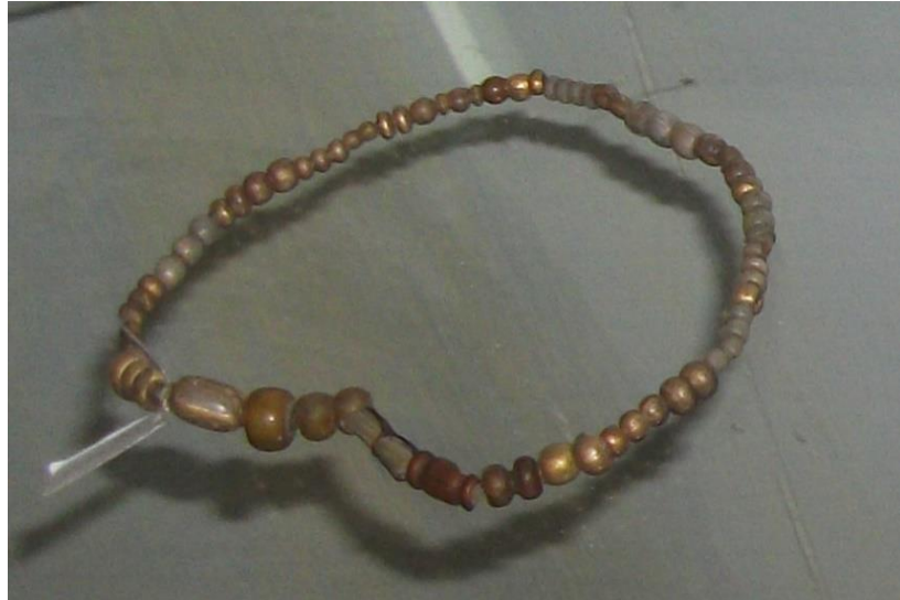
ภาพที่ 2.11 ลูกปัดสีอำพันทอง พบที่แหล่งโบราณคดีสมัยทวารวดี

แหล่งโบราณคดีทุ่งตึกนิยมในลูกปัดรูปทรงกระบอกมากที่สุด ส่วนใหญ่ลูกปัดแก้วที่พบมีขนาดเล็ก พบว่าเทคนิคในการหลอมแก้วใช้วิธีการดึง-ยืดแก้วให้เห็นหลอดยางแล้วตัดออกเป็น ส่วนๆ ทำให้เกิดลูกปัดแก้วในรูปร่างต่างๆกัน ได้ ซึ่งขึ้นอยู่กับการตัดว่าจะให้ออกมาในรูปทรง แบบไหน