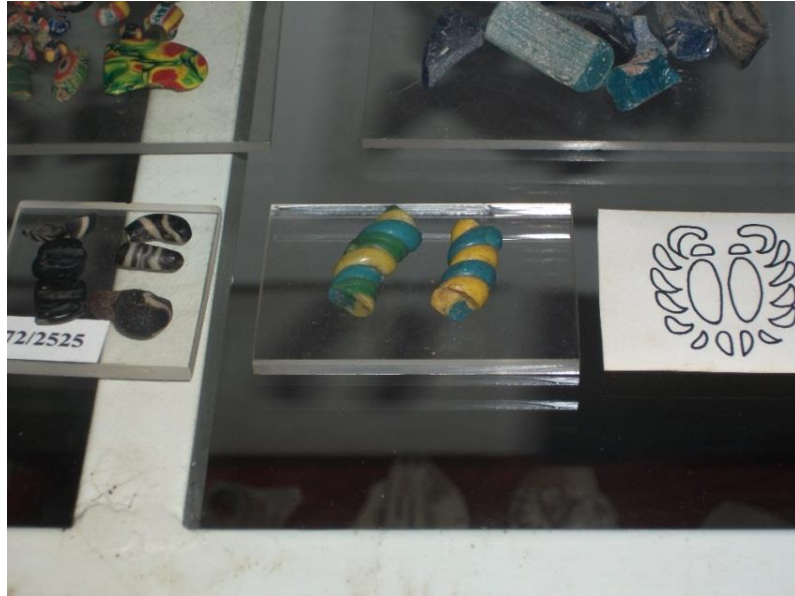
ภาพที่ 2.10 ลูกปัดเกลียว พบที่แหล่งโบราณคดีสมัยก่อนประวัติศาสตร์

กลุ่มลูกปัดก้อนกลม พบมากในแหล่งโบราณคดีสมัยแรกเริ่มประวัติศาสตร์ ได้แก่ ชุมชนโบราณคลองท่อม อ.คลองท่อม จ.กระบี่ ชุมชนโบราณไชยา อ.ไชยา จ.สุราษฎร์ธานี ชุมชนโบราณพุนพิน(เขาศรีวิชัย) อ.พุนพิน จ.สุราษฎร์ธานี ชุมชนโบราณตะกั่วป่า (เหมืองทอง) อ.ตะกั่วป่า จ.พังงา ชุมชนโบราณเขาสามแก้ว อ.เมืองชุมพร จ.ชุมพร