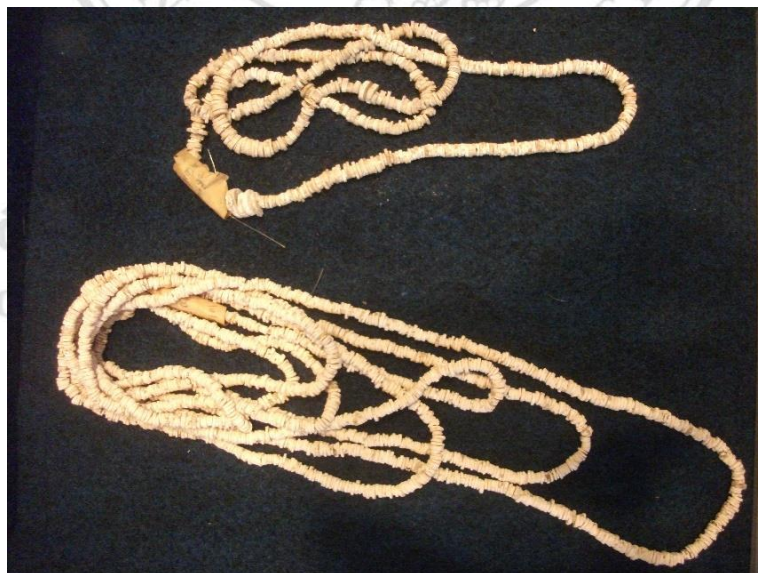
ภาพที่ 2.9 ลูกปัดเปลือกหอย พบที่แหล่งโบราณคดีสมัยทวารวดี

กลุ่มลูกปัดทรงระบอกและรูปร่างอื่น พบที่ชุมชนโบราณไชยา (แหลมโพธิ์) อ.ไชยา จ.สุราษฎร์ธานี ได้แก่ ลูกปัดแก้ว กลุ่มลูกปัดเกลียวและลูกปัดเชื่อมต่อแถว ลูกปัดเกลียว ดังภาพที่ 2.10 เป็นรูปแบบเฉพาะของแหล่งโบราณคดีสทิงพระ ต.จะทิ้งพระ จ.สงขลา และพบลูกปัดเชื่อมต่อแถวที่ชุมชนโบราณเขาสามแก้ว อ.เมืองชุมพร จ.ชุมพร ชุมชนโบราณไชยา อ.ไชยา จ.สุราษฎร์ธานี ชุมชนโบราณคลองท่อม .คลองท่อม จ.กระบี่ ชุมชนโบราณพุนพิน อ.พุนพิน จ.สุราษฎร์ธานี ชุมชนโบราณท่าเรือ อ.เมืองนครศรีธรรมราช จ.นครศรีธรรมราช