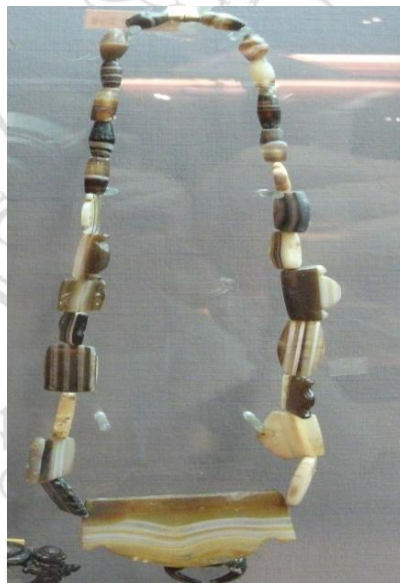
ภาพที่ 2.4 ลูกปัดหินอาเกต พบที่แหล่งโบราณคดีสมัยทวารวดี

ศักดิ์ชัย สายสิงห์ เสนอว่าการจัดประเภทลูกปัดที่พบในแหล่งโบราณคดีสมัยทวารวดีโดยทั่วไป มักแยกตามวัสดุที่ใช้ทำ ได้แก่ (ศักดิ์ชัย สายสิงห์, 2543: 174-175)