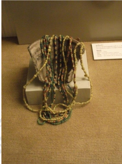
ภาพที่ 2.6 ลูกปัดแก้ว (ลูกปัดกลมสีนํ้า) พบที่แหล่งโบราณคดีสมัยทวารวดี