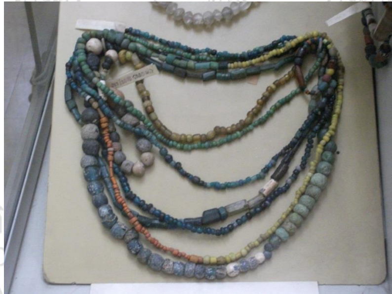
ภาพที่ 2.8 ลูกปัดแก้ว ซึ่งสีที่พบมากคือสีฟ้า พบที่แหล่งโบราณคดีสมัยทวารวดี