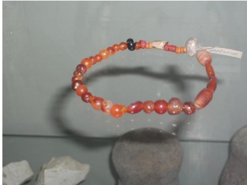
ภาพที่ 2.2 ลูกปัดหินคาร์เนเลียน พบที่แหล่งโบราณคดีสมัยก่อนประวัติศาสตร์