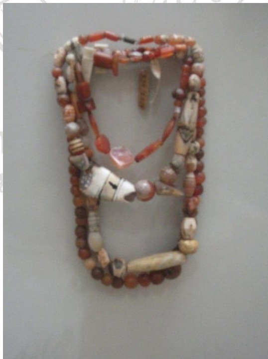
ภาพที่ 2.7 ลูกปัดหินคาร์เนเลียน รูปแบบต่างๆ พบที่แหล่งโบราณคดีสมัยทวารวดี