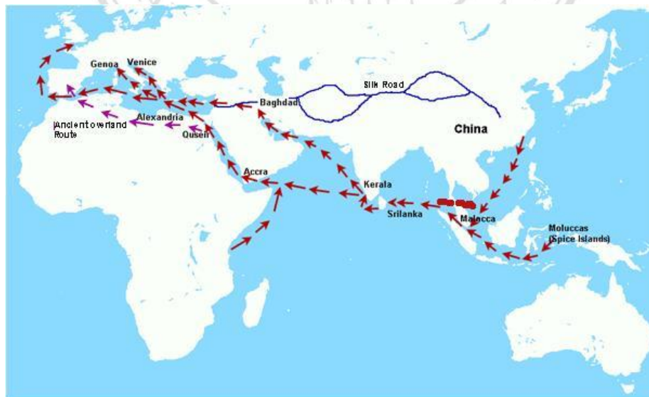
ภาพที่ 3.1 แผนที่เส้นทางการค้าดัดแปลงจากสารคดีค้นร่องส่องไทย

ด้วยเหตุที่กษัตริย์ราชวงศ์โมริยะได้กระตุ้นให้พ่อค้าชาวอินเดียเดินทางออกไปค้าขายยังต่างแดนเพื่อนำรายได้มาบำรุงประเทศ จึงทำให้มีการเดินทางของกลุ่มพ่อค้าชาวอินเดียไปยังดินแดนห่างไกลทั้งทางตะวันตกและตะวันออก ต่อมาได้ปรากฏร่องรอยเด่นชัดขึ้นในช่วงหลังยุคเหล็ก หรือเรียกตามยุคสมัยทางประวัติศาสตร์ว่า สมัยกุษาณ-คุปตะ (พุทธศตวรรษที่ 6-9) หรือสมัยอินโด-โรมัน เป็นช่วงที่อินเดียมีการติดต่อค้าขายกับอาณาจักรโรมัน ดังได้พบร่องรอยโบราณวัตถุแบบโรมันบริเวณเมืองท่าโบราณ และเมืองโบราณฝั่งตะวันตก เช่น เมืองเนวาชะ เมืองจันทราวาลลี เมืองพรหมบุรี เมืองโกณฑปุระ และฝั่งตะวันออกเฉียงใต้ เช่น เมืองอริกเมฑู และเมืองกาเวรีปู้ญญันัม นอกจากนี้ยังพบว่าการตั้งถิ่นฐานของชาวโรมันในอินเดียในบริเวณเมืองท่าสำคัญด้วย