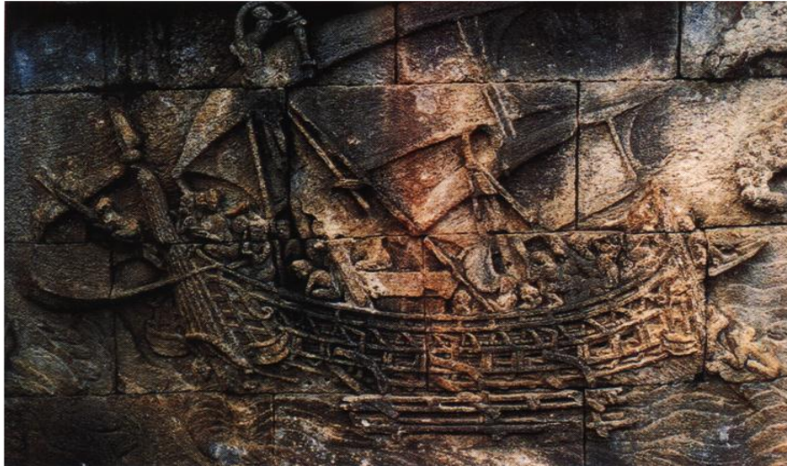
ภาพที่ 3.2 จาก Dato' Dr Nik Hassan Shuhaimi Nik Abdul Rahman. (2006). The Encyclopedia of Malaysia : Vol. 4 Early History. Malaysia: Archipelago Press.