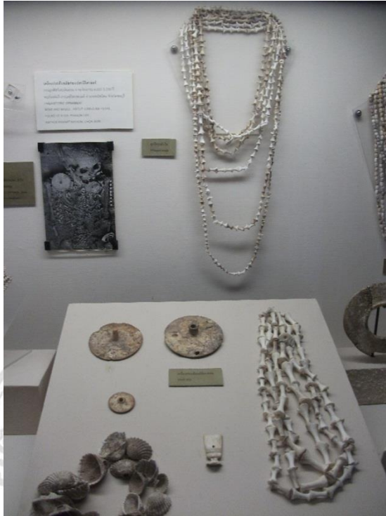
ภาพที่ 3.4 ลูกปัดรูปตัว I พิพิธภัณฑสถานแห่งชาติ ปราจีนบุรี