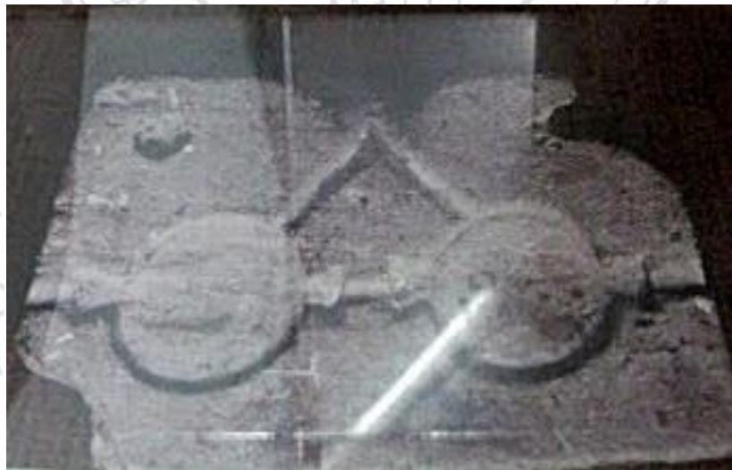
ภาพที่ 4.2 แม่พิมพ์สำหรับหล่อลูกปัดทรงลูกทูน เป็นหลักฐานว่าลูกปัดแบบนี้ผลิตที่แหล่งควนลูกปัด คลองท่อม จังหวัดกระบี่

ดังนั้น ลูกปัดที่พบที่ควนลูกปัด อ.คลองท่อม จึงมีลักษณะเฉพาะที่เรียกว่า “ลูกปัดพื้นถิ่น” หรือผลิตขึ้นเอง ณ แหล่งโบราณคดีแห่งนี้ เนื่องจากว่าได้พบหลักฐานต่างๆ หลายอย่างที่ทำให้เชื่อได้ว่าลูกปัดบางชนิดผลิตขึ้นที่ควนลูกปัดดังที่กล่าวไปแล้ว แต่วัตถุดิบที่ใช้ทำนั้นอาจได้มาจากต่างประเทศหรือภายในประเทศเอง เนื่องจากว่าได้พบเศษหินแร่ที่สวยงามชนิดเดียวกับที่ใช้ทำลูกปัดที่ยังคงทิ้งร่องรอยชัดเจนว่าถูกสกัดออกไปทำลูกปัด รวมทั้งเศษก้อนแก้วซึ่งเป็นแก้วชนิดเดียวกับที่ใช้ทำลูกปัดแก้วเป็นจำนวนมาก ปะปนอยู่กับลูกปัดที่ทำเสร็จแล้ว นอกจากนี้ยังได้พบลูกปัดที่ยังทำไม่เสร็จเรียบร้อยเป็นจำนวนมาก เพียงแต่ทำเป็นรูปร่าง ยังไม่มีการเจาะรู หรือเจาะรูแล้วเพียงครึ่งเม็ด และยังได้พบลูกปัดแก้วที่ทำติดกันเป็นแถวยาวๆ ยังไม่มีการเจาะรู รวมทั้งลูกปัดที่ทำแล้วใช้งานไม่ได้ถูกนำกลับไปหลอมรวมกันใหม่ ถ้าหาเป็นของที่นำมาจากแหล่งอื่นๆ จะทำเสร็จเรียบร้อยมาแล้ว