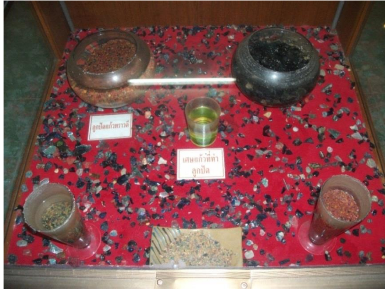
ภาพที่ 4.3 เศษแก้วที่เป็นวัตถุดิบในการผลิตลูกปัดจำนวนมาก ณ พิพิธภัณฑ์วัดคลองท่อม อ.คลองท่อม จ.กระบี่