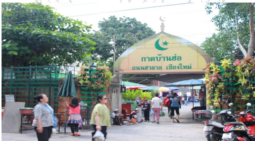
รูปภาพ 2.1 บริเวณทางเข้าด้านหน้าของกาดบ้านฮ่อ

หลังจากการเข้ามาของผู้ค้ากลุ่มเล็กๆ จนกระทั่งเกิดการบอกต่อกันถึงการทำการค้าขายของในตลาด จึงทำให้เกิดการชักชวนกลุ่มผู้ค้าจากที่ต่างๆ เช่น ดอยอ่างขาง อำเภอฝาง อำเภอเชียงดาว ฯลฯ จากเดิมที่เป็นตลาดเล็กๆจึงค่อยๆเกิดการขยายตัวของกลุ่มผู้ค้าเพิ่มมากขึ้น ตลาดแห่งนี้จึงถูกเรียกในหลายๆชื่อ เช่น “กาดจีนฮ่อ” “ตลาดชาวเขา” และชื่อที่เป็นทางการของตลาดแห่งนี้ในปัจจุบันคือ “กาดบ้านฮ่อ” โดยสาเหตุที่เรียกว่ากาดบ้านฮ่อเพราะตลาดตั้งอยู่ตรงข้ามกับมัสยิดบ้านฮ่อนั่นเอง