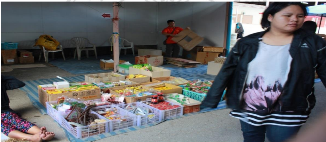
รูปภาพ 2.5 สินค้าชาติพันธุ์ชนิดต่างๆทั้งเครื่องอุปโภคบริโภคที่ถูกนำเข้ามาจากต่างประเทศ

โฆษณาสินค้าโดยทั่วไป ในส่วน โฆษณาสินค้าดังกล่าวจะอยู่บริเวณส่วนทางเข้าด้านหน้าและกลางของ ตลาดไม่ห่างจากโชนอิสลามมากนัก โดยสินค้าในโชนนี้ค่อนข้างจะมีความหลากหลายซึ่งประกอบ ไปด้วยการขายสินค้าที่นำเข้ามาจากต่างประเทศ อาหารชาติพันธุ์ชนิดต่างๆ เช่น แป้งพม่า ข้าวแรมพื้น ผักดองจีนฮ่อ เนื้อกึ่งปลา ไก่สด ฯลฯ ซึ่งสินค้าเหล่านี้ได้ดึงดูดผู้ซื้อกลุ่มชาติพันธุ์ต่างๆ เช่น ไทยใหญ่ พม่า เข้ามาจับจ่ายสินค้าดังกล่าวได้ด้วยเช่นกัน เนื่องจากสินค้านี้ค่อนข้างหายากใน ตลาดทั่วไป แต่ทั้งนี้ทั้งนั้นก็ยังมีสินค้าที่หาซื้อได้ทั่วไปไปอย่างเช่น เสื้อผ้า เครื่องประดับ เครื่องสำอางชนิด ต่างๆขายในส่วนบริเวณนี้เช่นกัน ซึ่งเจ้าหน้าที่กาแลไนท์บาชาร์ได้เสนอว่าลูกค้ามาจ่ายตลาดซึ่งที่ไม่ ควรจะได้สินค้าที่หาซื้อยากแต่เพียงอย่างเดียว แต่ควรได้สินค้าชนิดอื่นติดมือไปด้วย ซึ่งจะไม่ทำให้ ลูกค้าต้องเสียเวลาแวะตลาดอื่นเพื่อเลือกซื้อสินค้าเหล่านี้อีก หรือกล่าวอีกความหมายคือ มาภาค บ้านฮ่อครั้งเดียวควรจะได้สินค้าหลากหลายชนิดติดมือกลับบ้านไปด้วยนั่นเอง