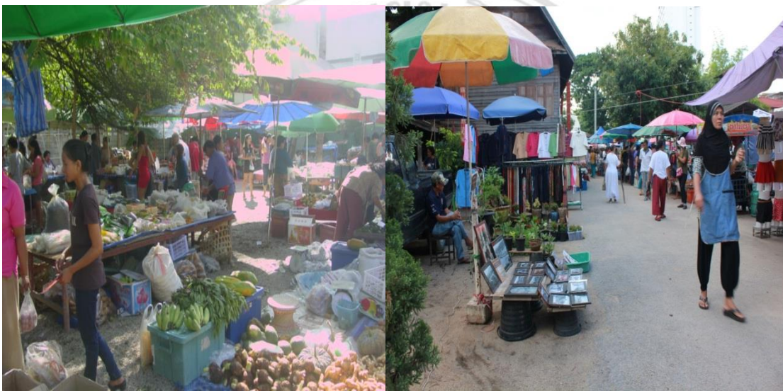
รูปภาพ 2.2 ภาพซ้ายและภาพขวาแสดงให้เห็นถึงการพัฒนาของภาคบ้านฮ่อโดยการสร้างถนนและการจัดโซนตลาดให้มีความชัดเจนรวมทั้งการปรับปรุงภูมิทัศน์ของตลาดให้ดีขึ้น

แหล่งท่องเที่ยวดังกล่าว เช่น โรงแรม พลาซ่า ศูนย์การค้า ซอปปิงเซนเตอร์ ฯลฯ ซึ่งนโยบายนั้นนอกจากจะเอื้อผลประโยชน์ให้กับทางบริษัทเองแล้วยังทำให้เกิดการสร้างงานและสร้างเงินให้กับผู้คนในจังหวัดเชียงใหม่อีกด้วย ถึงแม้ว่าทางบริษัทจะมีนโยบายในการสร้างแหล่งท่องเที่ยวเชิงวัฒนธรรมขึ้นมาใหม่ แต่สำหรับภาคบ้านฮ่อทางบริษัท จะไม่มีการเปลี่ยนแปลงบรรยากาศของตลาดแม่แต่น้อย จะมีก็แค่การปรับปรุงในด้านภูมิทัศน์และสิ่งอำนวยความสะดวกสำหรับผู้ค้าและผู้ซื้อ เช่น การนำหินลูกรังมาลงในพื้นที่ของภาคบ้านฮ่อเพื่อทำให้พื้นไม่เกิดฝุ่นละอองและทำให้พื้นที่ไม่เกิดดินโคลนเฉอะแฉะในช่วงฤดูฝน การทำคันที่ผ้าใบในตลาดเพื่อป้องกันแสงแดดให้แก่ผู้ค้าและผู้ซื้อหรือแม้กระทั่งการสร้างห้องน้ำเพื่ออำนวยความสะดวกให้กับผู้ค้าและผู้ซื้อ เป็นต้น