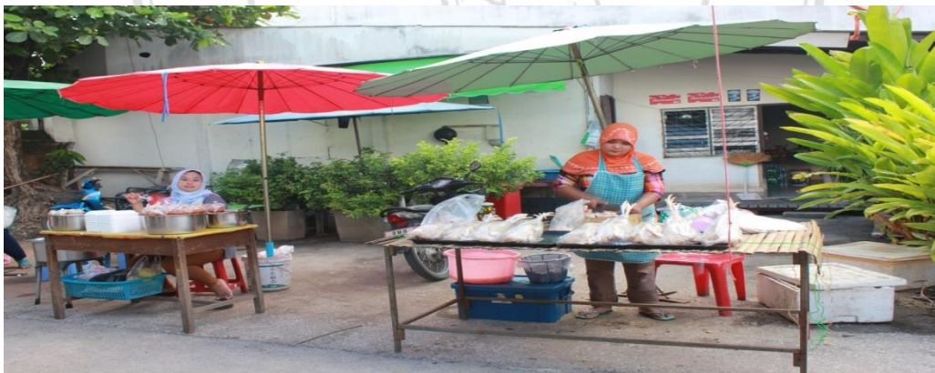
รูปภาพ 2.3 ผู้ค้าชาวมุสลิมะห์ในโซนอิสลามที่สามารถสังเกตได้ง่ายผ่านการแต่งตัวโดยการคลุมศีรษะ

โซนผู้ค้าที่เป็นชาวมุสลิม หากเข้ามาจากทางเข้าด้านหน้าของกาดบ้านฮ่อจะพบว่าโซนผู้ค้ามุสลิมหรือโซนอิสลามนั้นจะเป็นโซนแรกที่นักท่องเที่ยวและผู้จ่ายตลาดจะต้องเจอเป็นโซนแรก ทางบริษัทกาแลไนท์บাজারให้ความสำคัญกับโซนอิสลามค่อนข้างมาก เนื่องจากกาดบ้านฮ่อในสมัยแรกนั้นจะมีผู้ค้ามุสลิมเป็นส่วนใหญ่ ด้วยเหตุนี้จึงจัดให้กลุ่มผู้ค้ามุสลิมเข้ามาอยู่ในโซนดังกล่าวซึ่งถือเป็นทำเลขายที่ดี ซึ่งผู้จ่ายตลาดหรือนักท่องเที่ยวส่วนใหญ่จะเข้ามาเจอส่วนสินค้าดังกล่าวก่อนโซนสินค้าอื่นๆ และอยู่ไม่ยอ้อลีงจนเกินไป สิ่งที่โดดเด่นอีกประการหนึ่งที่จำแนกโซนอิสลามให้แตกต่างจากโซนสินค้าอื่นๆ คือการแต่งตัวของผู้ค้าชาวมุสลิมต่างๆ โดยที่มุสลิมะห์ (ผู้หญิงมุสลิม) จะโพกศีรษะ (ผู้คลุมหัว) ซึ่งจะทำให้นักท่องเที่ยวและผู้จ่ายตลาดทราบทันทีว่าได้เข้ามาอยู่ในส่วนโซนอิสลามแล้วผ่านการสังเกตการแต่งกายดังกล่าว และนอกจากนั้นยังทำให้ผู้จ่ายตลาดหรือนักท่องเที่ยวชาวมุสลิมมีความมั่นใจเพิ่มอีกในระดับหนึ่งว่าสินค้าดังกล่าวสามารถบริโภคได้เนื่องจากเห็นการแต่งกายของผู้ค้านั่นเอง