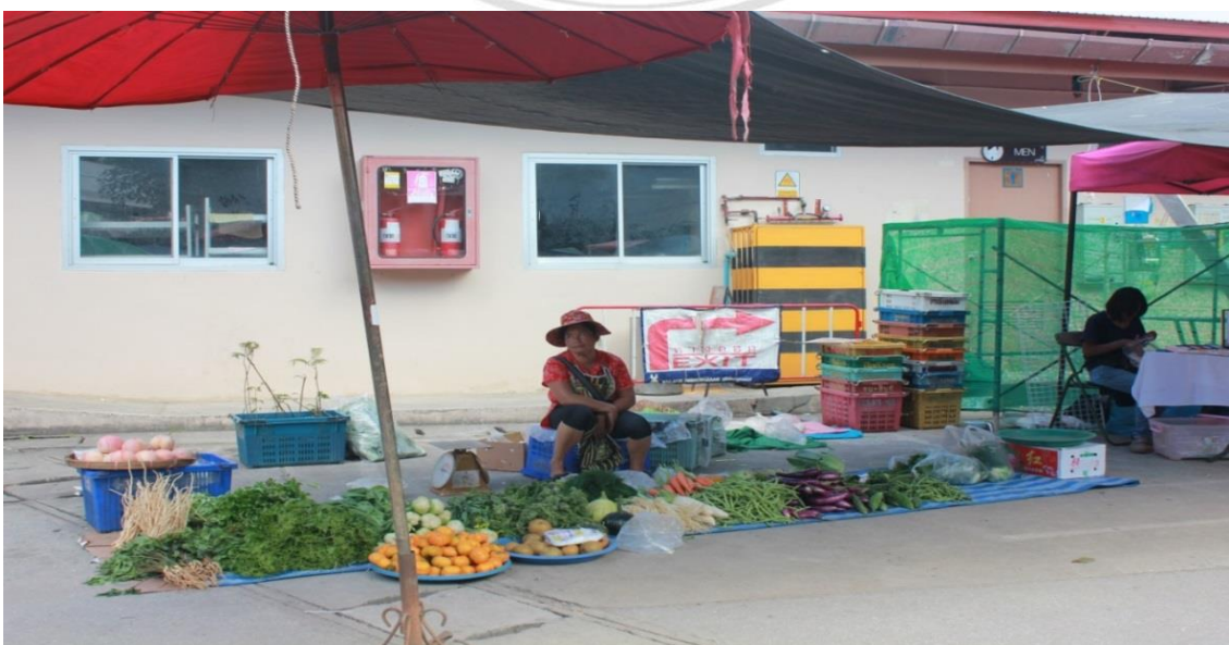
รูปภาพ 2.4 แม่ค้าในโชนพืชผักที่นำพืชผักเมืองหนาวชนิดต่างๆขายแบบแบกะดิน

โชนพืชผัก ถึงแม้ในส่วนของโชนดังกล่าวจะค่อนข้างอยู่ในส่วนบริเวณกลางไปจนถึงท้ายตลาดซึ่งทำเลอาจจะไม่ดีเท่ากับโชนอิสลามซึ่งอยู่บริเวณด้านหน้าของตลาดก็ตาม แต่ด้วยสินค้าที่โดดเด่นและหาซื้อได้ยากและไม่มีขายในตลาดทั่วไปในจังหวัดเชียงใหม่อย่างพืชผักเมืองหนาวที่ขุดมาขายสดๆวันต่อวัน โดยจะสังเกตได้จากดินที่ติดกับรากของพืชผักบางชนิด สามารถดึงดูดกลุ่มผู้จ่ายตลาดและนักท่องเที่ยวเข้ามาซื้อผักชนิดดังกล่าวกันเป็นจำนวนมาก ทำให้โชนพืชผักมีลูกค้าเยอะไม่แพ้กับโชนสินค้าอื่นๆแม้แต่น้อย ในส่วนของโชนนี้จะเป็นการจำกัดให้ขายเฉพาะพืชผักเมืองหนาวจากคอกอย่างขางและผักที่มาจากอำเภอเชียงดาวเป็นส่วนใหญ่ เนื่องจากเสน่ห์ของกาดบ้านฮ่อคือการเข้ามาจับจ่ายซื้อผักสดที่ไม่สามารถหาซื้อได้ทั่วไปตามตลาดต่างๆในจังหวัดเชียงใหม่ได้ และทางบริษัทได้ให้ความสำคัญกับสินค้าชนิดนี้ค่อนข้างมาก ซึ่งจะเห็นได้จากการประชาสัมพันธ์ในสื่อ Social Network ของบริษัท โดยจะมีการถ่ายรูปบรรยากาศของตลาดพร้อมกับมีข้อความว่า “สินค้าอุปโภคบริโภค สดจากคอกอย่างขาง” เนื่องจากผู้ค้าพืชผักเมืองหนาวในกาดบ้านฮ่อร้อยละ 70% - 80% จะเดินทางมาจากคอกอย่างขางเป็นส่วนใหญ่