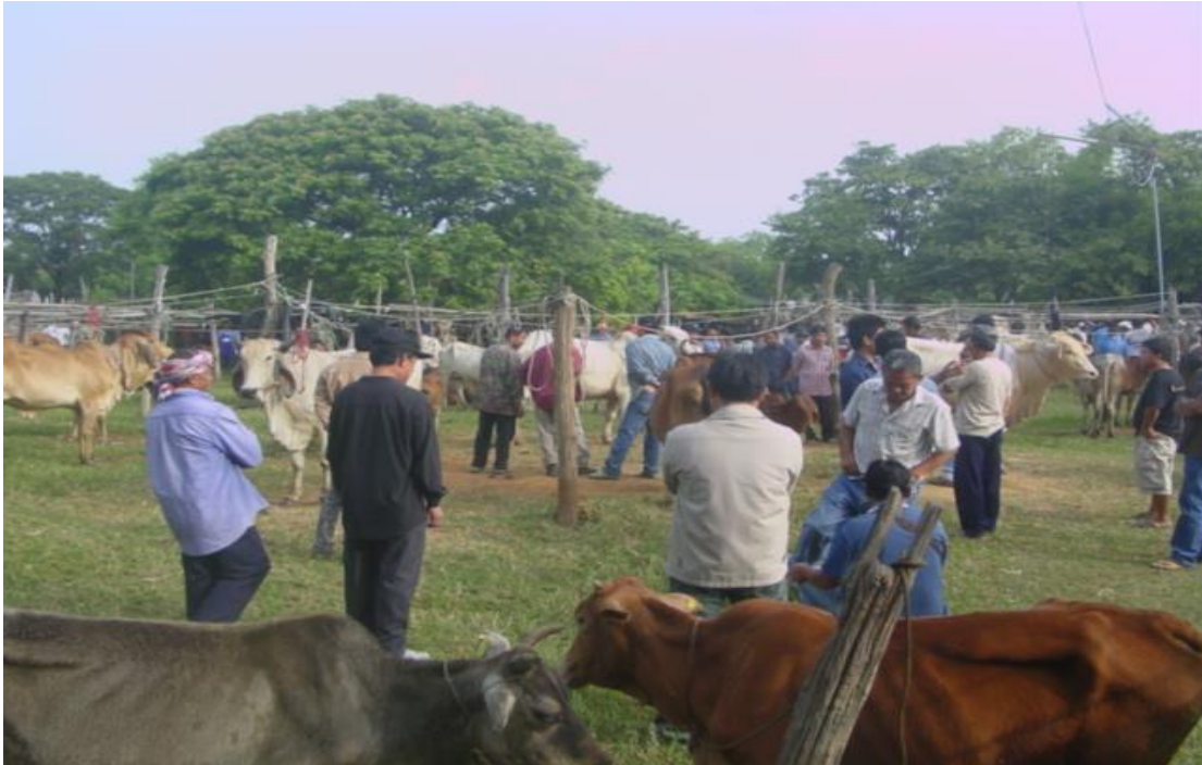
รูปภาพ 4.8 บรรยากาศของกาดวัวที่ผู้ค้าและผู้ขายมักจะมาคัดเลือกซื้อวัวอยู่เป็นประจำ

ในบริเวณพื้นที่ขายวัวนั้นผู้เขียนสังเกตว่าพื้นที่ดังกล่าวแทบไม่มีผู้หญิงปรากฏตัวอยู่ในพื้นที่นี้แม้แต่น้อย ทั้งผู้ค้าและผู้ขายล้วนเป็นผู้ชายแทบทั้งหมด อย่างไรก็ตามที่สุดผู้หญิงจะมีบทบาทคอยช่วยสามีในเรื่องต่างๆเล็กน้อยเช่นการเก็บเงินที่ได้จากการขายวัวให้สามีซึ่งเป็นผู้ค้าเพียงเท่านั้น ในเรื่องของการบรรยายสรรพคุณและการต่อรองราคาวัวมักจะตกเป็นหน้าที่ของฝ่ายชายแทบทั้งสิ้น คงไม่ผิดนักที่จะมองว่าเพศชายเป็นผู้ผูกขาดการซื้อขายวัวแต่เพียงฝ่ายเดียว