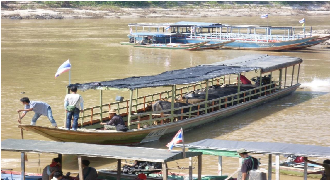
รูปภาพ 4.5 การขนส่งวัวผ่านเรือขนส่งข้ามฟากชายแดนไทย-พม่า บริเวณแม่น้ำสาละวิน จังหวัดแม่ฮ่องสอน

ด้วยเหตุนี้เองการติดต่อซื้อขายวัวของนายหน้านั้นจำเป็นที่จะต้องข้ามแม่น้ำสาละวินเพื่อเข้าไปติดต่อหรือหาวัวตามใบสั่งของผู้ค้ากับผู้ค้ากลุ่มต่างๆที่อยู่ในฝั่งพม่า หรือแม้กระทั่งเมื่อมีการขนส่งวัวและผู้ค้าวัวจะทำการตรวจสอบวัวที่ส่งมานั้นก็จำเป็นที่จะต้องมีการตรวจสอบวัว ณ บริเวณริมแม่น้ำแม่น้ำสาละวินฝั่งไทยเท่านั้น ผู้ค้าไม่สามารถข้ามไปคัดเลือกสัตว์ทั้งบนฝั่งไทยหรือบนฝั่งพม่าโดยได้ เนื่องจากทั้งผู้ค้าและผู้ขายไม่ได้มีสัญชาติตรงกันข้ามกับตนเอง เช่น ผู้ค้าวัวไม่ได้มีสัญชาติพม่าหรือกะเหรี่ยง หรือผู้ค้าในฝั่งพม่าก็ไม่ได้มีสัญชาติไทย เป็นต้น ด้วยเหตุนี้เองแม่น้ำสาละวินจึงเป็นส่วนเชื่อมหรือจุดนัดพบในการติดต่อเจรจาธุรกิจและการค้าขายวัวที่สำคัญเพียงแห่งเดียวนั่นเอง