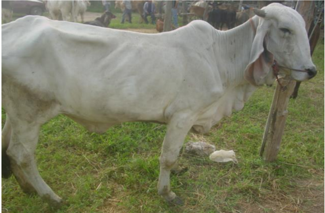
รูปภาพ 4.9 วัวบราห์มันในภาคจัว

นอกจากวัวหลากหลายสายพันธุ์ที่มีให้เลือกซื้อแล้ว ผู้เขียนยังพบว่าผู้ค้าในภาคจัวยังมีหลายประเภท เช่นเดียวกัน ตั้งแต่กลุ่มผู้ค้ารายย่อยที่มีมากสุดในภาคจัว โดยมักซื้อวัวต่อจากกลุ่มผู้ค้ารายใหญ่อีกทอดหนึ่งเพื่อนำมาเก็งกำไรในการขายต่อ ผู้ค้ารายย่อยบางรายอาจจะนำวัวไปเลี้ยงให้อ้วนก่อนนำมาขายได้เช่นกัน โดยจะมีวัวที่นำมาขายไม่เกิน 4 ตัว ส่วนผู้ค้าอีกกลุ่มหนึ่งคือกลุ่มผู้ค้ารายใหญ่ซึ่งส่วนใหญ่จะขนวัวมาจากอำเภอแม่สะเรียงโดยตรง (เช่นพ่อเลี้ยงคืบ) หรือผู้ค้ารายใหญ่ที่กว้านซื้อวัวจากอำเภอแม่สะเรียงจำนวนมากเข้ามาขายยังภาคจัวอีกต่อหนึ่ง ผู้ค้ารายใหญ่เหล่านี้มักจะมีวัวในครอบครองเป็นจำนวนไม่ต่ำกว่า 10 ตัวขึ้นไป โดยส่วนใหญ่วัวที่ซื้อมาจะเป็นวัวที่เคยอยู่ในจุดพักหรือฟาร์มของตนเองในช่วงระยะเวลาหนึ่งก่อนนำมาขายต่อยังภาคจัว