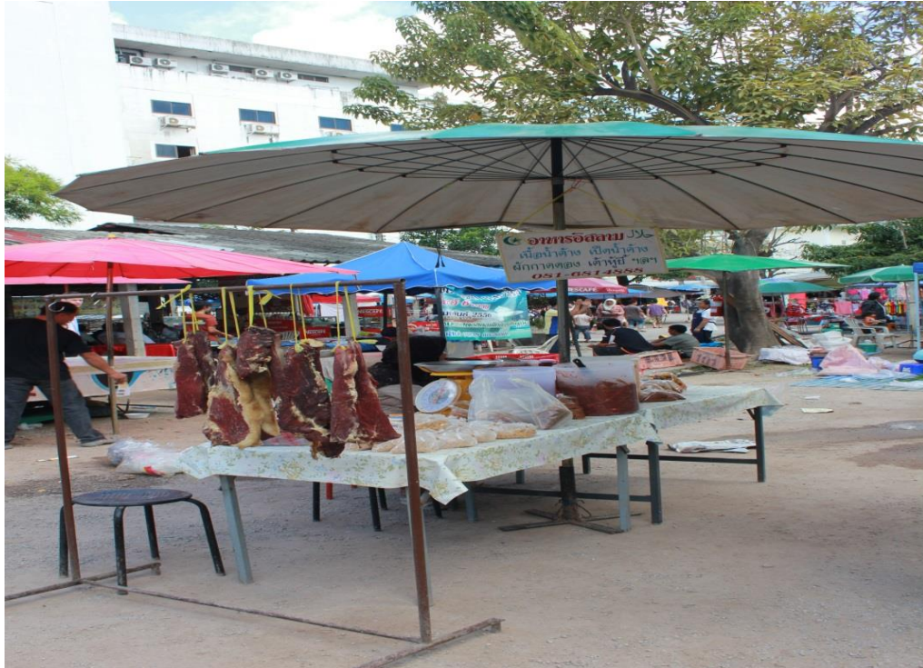
รูปภาพ 4.1 เนื้อกึ่งป่าที่ห้อยแขวนเพื่อขายในกาดบ้านฮ่อม

เนื้อกึ่งป่าสามารถนำมาประกอบอาหารได้หลายชนิด เช่น ผัดผักใส่เนื้อกึ่งป่า เนื้อกึ่งป่าผัดขิง ฯลฯ แต่วิธีการประกอบอาหารที่นิยมมากที่สุดคือการทอดเนื้อกึ่งป่า ซึ่งการทอดเนื้อกึ่งปานั้นมีขั้นตอนในการทำพอสมควร โดยการทอดเนื้อกึ่งปานั้นจะใช้วิธีการชอยเนื้อให้มีความบางมากที่สุดเป็นชิ้นๆพอดีคำ ขั้นตอนต่อไปคือขั้นตอนที่สำคัญพอๆกันก็คือการทอด โดยการทอดเนื้อกึ่งปานั้นจะต้องตั้งน้ำมันให้ร้อนแต่ไม่ถึงกับเดือด และที่สำคัญจะต้องใช้ไฟที่อ่อนอยู่ตลอดเวลาในการทอดเนื้อ ซึ่งถ้าหากใช้ไฟที่ร้อนมากเกินไปจะทำให้เนื้อที่มีความบางอยู่แล้วกรอบเกินไปจนกระทั่งไหม้ก็เป็นได้ และการทอดนั้นจะต้องทอดอย่างน้อยสองครั้ง โดยครั้งแรกนั้นจะยังทอดให้เนื้อไม่สุกมากนัก (ระยะเวลาในการทอดนั้นแล้วแต่การคาดคะเนของผู้ทอด ไม่สามารถระบุระยะเวลาได้อย่างแน่ชัด) และจึงนำเนื้อที่ทอดในน้ำมันแรกขึ้นมาพักซักครู่จึงนำเนื้อที่ไปทอดในน้ำมันที่สองจนสุกพร้อมมารับประทาน