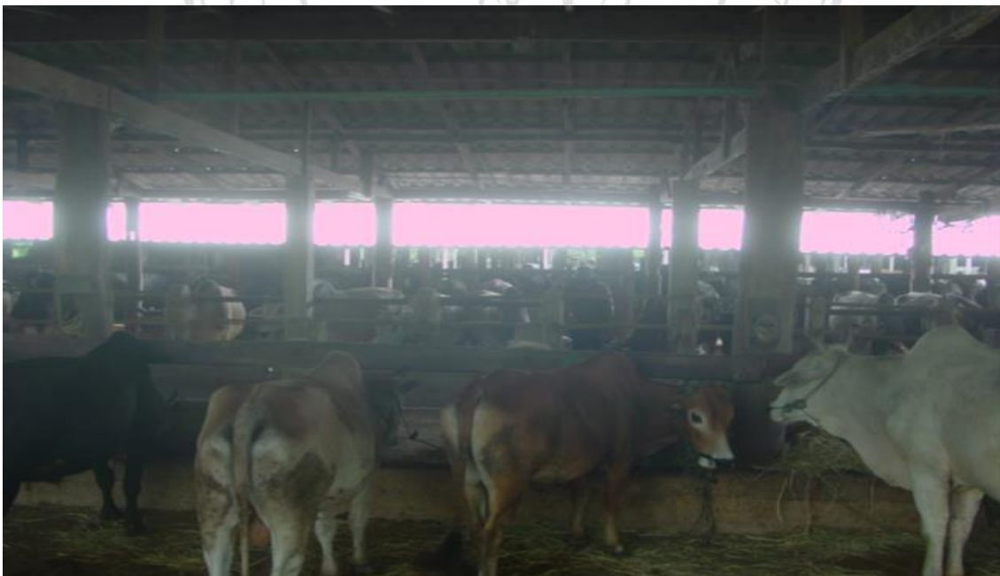
รูปภาพ 4.2 บรรยากาศของฟาร์มของพ่อเลี้ยงตีบ

จะเห็นได้ว่านายหน้านั้นถือเป็นตัวแปรสำคัญอีกหนึ่งตัวแปรที่ทำให้การค้าขายวัวระหว่างผู้ค้าชาวไทยและผู้ค้าฝั่งพม่ามีความราบรื่นมากขึ้น หากไม่มีนายหน้าอย่างเช่นหม่องเต็งแล้วการค้าขายวัวของพ่อเลี้ยงตีบก็อาจจะมีความยากลำบากในหลายขั้นตอน ไม่ว่าจะเป็นทางด้าน การสื่อสารผ่านภาษากะเหรี่ยง หรือแม้กระทั่งการเข้าไปคัดเลือกวัวตามคุณสมบัติที่ลูกค้าสั่งมาได้หรือบางที่อาจจะถึงขั้นที่ไม่สามารถติดต่อซื้อขายเลยก็ได้ทีเดียว