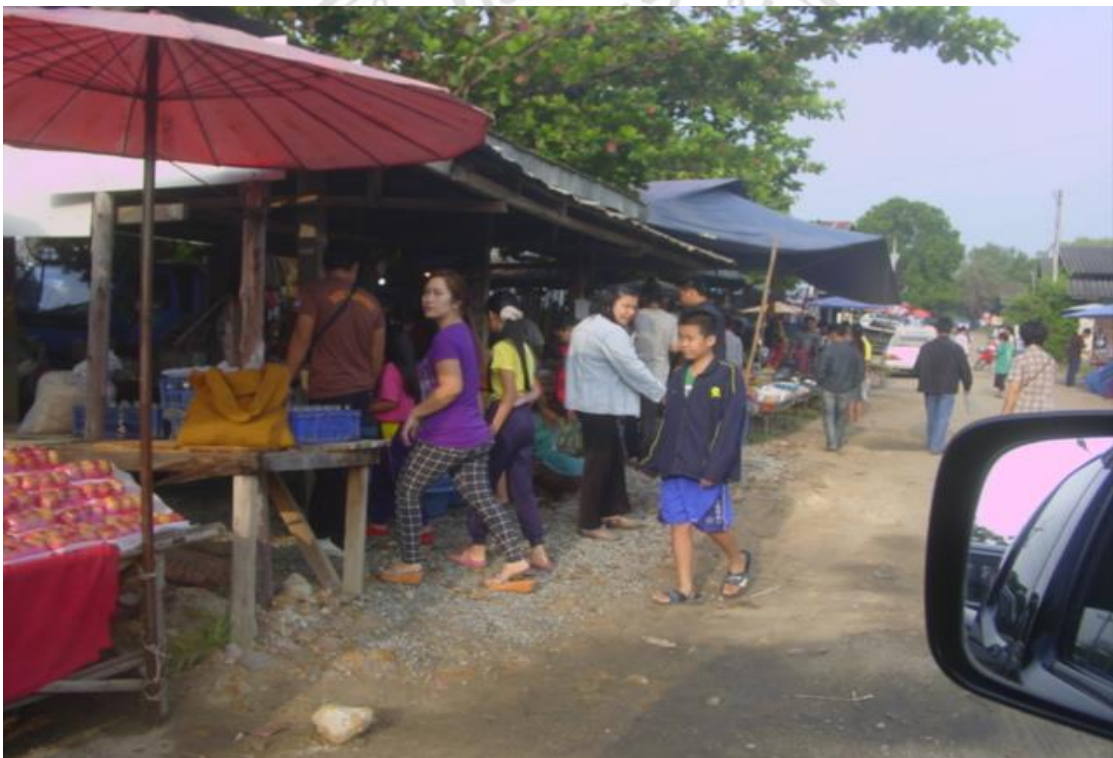
รูปภาพ 4.7 กาดจัวบริเวณส่วนจำหน่ายอาหารและของใช้ทั่วไปซึ่งมีผู้มาจ่ายตลาด อย่างไม่ขาดสาย

สินค้าที่มีจำหน่ายหลากหลายประเภท ทำให้พื้นที่ของตลาดแห่งนี้ขยับขยายออกไปเป็นพื้นที่กว้างมาก ซึ่งกินบริเวณสองฝั่งริมถนนเส้นชุปเปอร์ไฮเวย์บริเวณอำเภอสันป่าตอง ซึ่งในแต่ละฝั่งก็จะมีการขายสินค้าที่แตกต่างชนิดกันซึ่งสามารถจำแนกกลุ่มสินค้าหลักๆ ได้สองชนิด ฝั่งหนึ่งเน้นขายสินค้าจำพวกอาหารหรือเครื่องอุปโภคบริโภคหรือแม้แต่เครื่องใช้ไฟฟ้าชนิดต่างๆ ในขณะที่อีกฝั่งซึ่งถือเป็นหัวใจหลักของตลาดแห่งนี้จะมีสินค้าคือ รถยนต์และรถจักรยานยนต์มือสอง สัตว์เลี้ยงชนิดต่างๆ อย่างเช่น ไก่ชน และโดยเฉพาะสินค้าเด่นของฝั่งนี้คือวัวพันธุ์ต่างๆ ซึ่งกินเนื้อที่เกือบทั้งตลาดในฝั่งนี้ราวกับฟาร์มวัวขนาดมหึมาแห่งหนึ่งก็ว่าได้ ซึ่งมีการจัดสรรปันส่วนพื้นที่ในการขายค่อนข้างเป็นสัดส่วนไม่ปนกัน