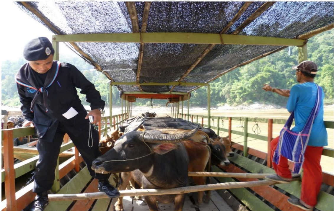
รูปภาพ 4.3 เจ้าหน้าที่รัฐกำลังทำการตรวจสอบจำนวนการขนส่งวัวและควาย บริเวณริมแม่น้ำสาละวิน จังหวัดแม่ฮ่องสอนฝั่งประเทศไทย

เข้าไปสำรวจแร่ที่ใช้ในการผลิตไฟฟ้ายังฝั่งชายแดนประเทศพม่า ในขณะที่กลุ่มคณะกำลังเดินทางในฝั่งพม่า นั้น ได้ถูกกลุ่มกองกำลังไม่ทราบฝ่ายยิงจนเสียชีวิต ตัวอย่างจากเหตุการณ์นี้ยิ่งตอกย้ำให้เห็นถึงความสำคัญของนายหน้าค้าวัวเป็นอย่างยิ่ง หากปราศจากนายหน้าแล้วผู้ค้าวัวก็ไม่สามารถที่จะข้ามฝั่งไปติดต่อเจรจาทางการค้ากับผู้ค้าในฝั่งพม่าได้โดยตรง เนื่องจากพวกเขาไม่มีคุณสมบัติทางด้านภาษา กะเหรี่ยงและที่สำคัญที่สุดผู้ค้านี้ไม่ได้เป็นคนในกลุ่มกะเหรี่ยงเหล่านั้นนั่นเอง ด้วยเหตุนี้ นายหน้าจึงเปรียบเสมือนตัวเชื่อมต่อระหว่างการค้าระหว่างท้องถิ่นกับการค้าระดับโลกให้ได้เข้ามาพบปะกันได้อย่างมีประสิทธิภาพและราบรื่นนั่นเอง