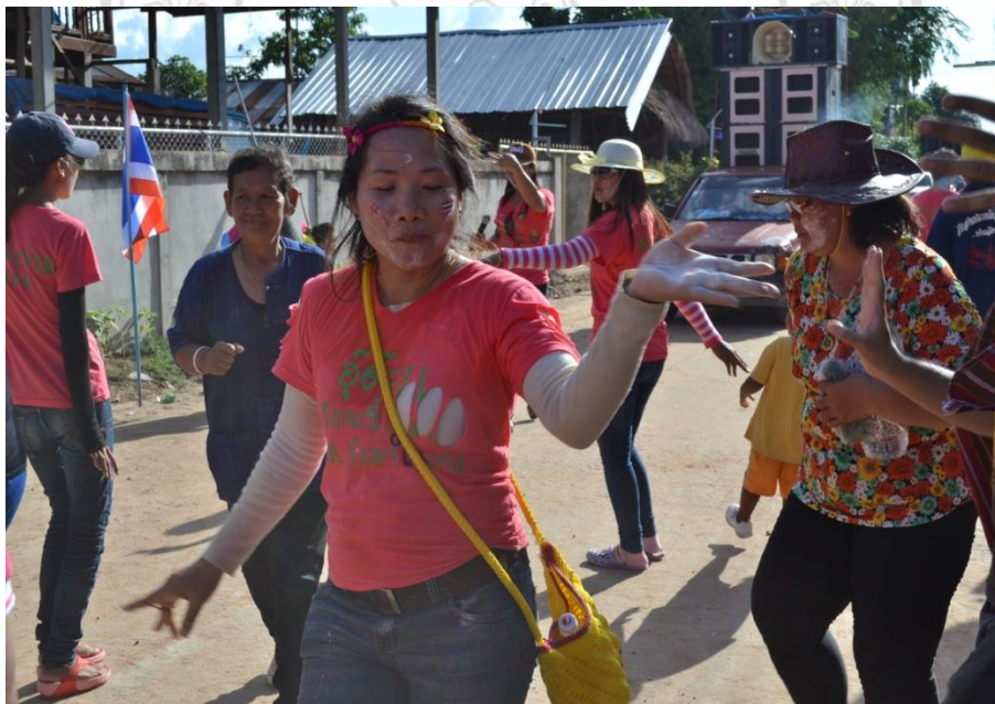
ภาพที่ 4.5 บรรยากาศผู้เข้าร่วมขบวนแห่งานบุญบั้งไฟ (วันโสม) ปี 2557