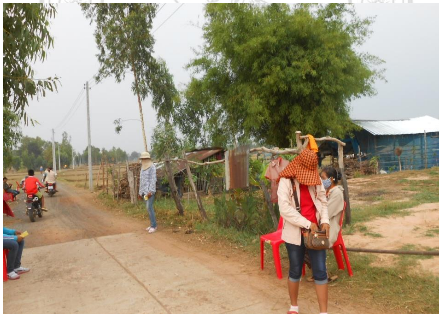
ภาพที่ 4.8 คนรอเก็บเงินค่าเข้าไปยังสนามบั้งไฟ เดือนมิถุนายน ปี 2557

ตามประเพณีดั้งเดิมวันจุดบั้งไฟ บั้งแรกจะไปจุดที่ดอนปู่ตาเพื่อถวายท่าน คลันดาลให้การจัดงานเป็นไปอย่างราบรื่น สนามบั้งไฟจะตั้งบริเวณหนองหญ้าซึ่งจะมีระยะทางห่างไกลจากตัวหมู่บ้านพอสมควร หลังจากนั้นประมาณเก้าโมงกลุ่มเซียนบั้งไฟ (นักพนันบั้งไฟ) ก็จะหลั่งไหลมาจากทั่วสารทิศ ในเดือนมิถุนายนปี 2557 การเข้าสนามบั้งไฟจะมีการเก็บค่าเข้า คนละ 300 บาท คนในหมู่บ้านเข้าฟรีหรือญาติพี่น้องเพื่อนฝูงจะเข้าสนามบั้งไฟฟรีเมื่อเข้าพร้อมกับคนในหมู่บ้าน