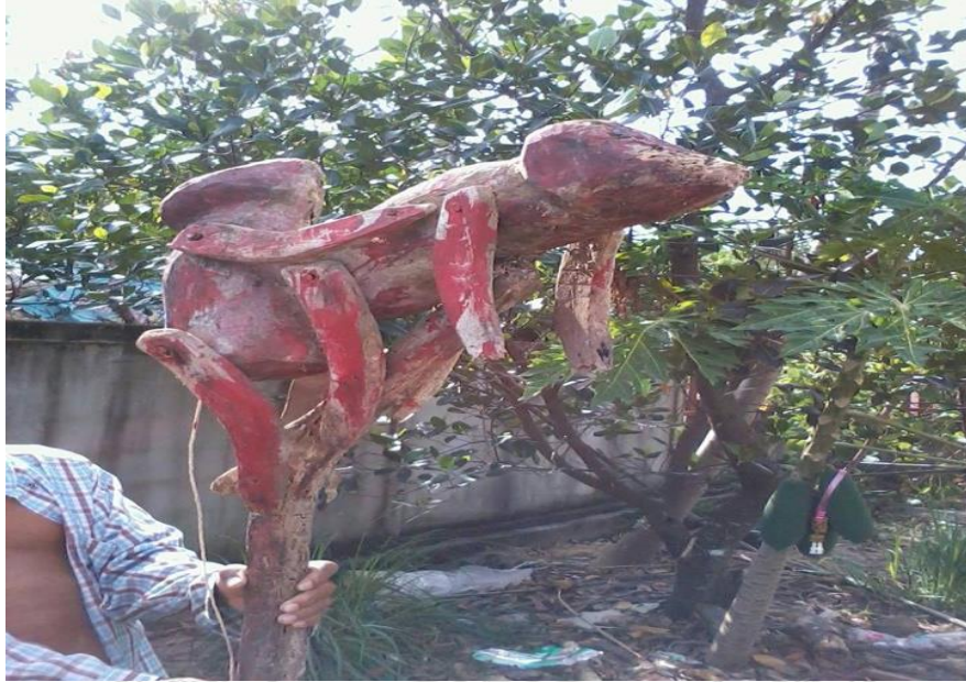
ภาพที่ 4.3 รูปตุ๊กตาดำเนินเข้าร่วมเทศกาลในขบวนแห่ซึ่งผู้เล่นจะแสดงท่าทางชักตุ๊กตาดำเนินลง ถ่ายเมื่อปี 2556

พอถึงช่วงบ่ายแก่ๆก็จะมีขบวนแห่เข้าวัด ขบวนแห่ก็เริ่มจากขบวนเด็กนักเรียนตั้งแต่ออนุบาลจนถึงประถมปลาย ขบวนแห่จากบ้านหนองก้าม (นามสมมติ)ซึ่งนางรำมีตั้งแต่วัยรุ่นจนถึงสาววัยกลางคน และมีสาวประเภทสองร่วมในการรำรำ ซึ่งสาวประเภทสองเหล่านั้นถือว่าเป็นจุดเด่นในการเซ็งของคณะฟ้อนรำของบ้านหนองก้าม (นามสมมติ) เครื่องดนตรีเป็นกลองยาว ฉาบ คีย์บอร์ด และเครื่องขยายเสียง ซึ่งต่างจากในอดีตที่มีเพียง แคน กลอง พิณ ฉาบ เท่านั้น นักดนตรีก็จะมีแต่เพศชายเท่านั้น นางรำมีเครื่องแต่งการที่สวยงาม แต่งหน้าทำผม ก่อนถึงวันแห่ขบวนแห่ของบ้านหนองก้าม (นามสมมติ)ฝึกซ้อมกันเกือบเดือน ในตอนค่ำของทุกคืนที่ถนนกลางหมู่บ้าน นอกจากมีขบวนเซ็งของหมู่บ้านตนเองแล้ว ยังมีการจ้างหมู่บ้านอื่นเพื่อมาแสดง บางครั้งก็ไม่ได้ถือว่าเป็นการจ้างแต่มาช่วยงานบุญ ความหมายคล้ายๆ กับการลงแขกเกี่ยวข้าว หากจ้างบางขบวน นักการเมืองส่วนท้องถิ่นก็เป็นคนจ้างมา ถือว่าเป็นการหาเสียงไปในตัว เพื่อสนับสนุนให้ขบวนแห่มีความตระการตามากขึ้น