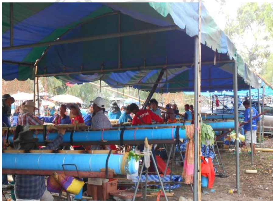
ภาพที่ 4.12 บั้งไฟจากค่ายต่างๆตั้งรอเพื่อขึ้นฐานจุด

ใช้สำหรับจุดโชว์และจุดเพื่อให้พนักงานเล่นพินในสนามบั้งไฟ นอกจากนี้ยังมีค่ายอื่นๆที่เข้าร่วมจุดบั้งไฟนับจำนวนแล้วไม่ต่ำกว่า 20 ค่าย โดยชื่อเสียงและประติผลงานของบั้งไฟมีผลต่อการสร้างความเชื่อมั่นให้กับเซียนพินและใช้เป็นข้อมูลส่วนหนึ่งในการวิเคราะห์เพื่อเล่นพิน ซึ่งค่ายบั้งไฟแต่ละค่ายในสนามมีทั้งค่ายสมัครเล่นและค่ายที่ทำเป็นอาชีพ ยกตัวอย่างค่ายสมัครเล่นเช่น ค่าย 1000 % ซึ่งเป็นเด็กๆ วัยรุ่นในหมู่บ้านหนองก้าม (นามสมมติ)ร่วมกันประดิษฐ์ ส่วนค่ายอาชีพเช่น ค่ายแอ็ดเทวดา พยัคฆ์อีสาน เป็นต้น ค่ายบั้งไฟที่ทำเป็นอาชีพจะสามารถเข้ามาจุดในสนามบั้งไฟได้ก็ต่อเมื่อมีผู้สนับสนุนนำเข้า หรือหากเป็นค่ายสมัครเล่นก็ต้องมีผู้สนับสนุนเช่นกัน เพราะการประดิษฐ์บั้งไฟแต่ละบั้งมีค่าใช้จ่ายอยู่พอสมควร