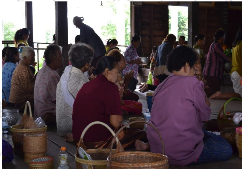
ภาพที่ 4.1 บรรยายการทำบุญตอนเช้าที่วัดในวันแห่บุญบั้งไฟประจำปี 2556

แหล่งรายได้ที่นำมาใช้ในการจัดงานบุญบั้งไฟคือ หนึ่ง เงินจากซองผ้าป่าสามัคคี 500,000 บาท สอง เงินจากการขายบัตรเข้าสนามบั้งไฟในวันจุด 600,000 บาท (รายได้จากการขาย บัตรเข้าสนามบั้งไฟและการเล่นพนันบั้งไฟอย่างเป็นทางการเป็นจริงเป็นจังเริ่มแพร่หลายตั้งแต่ช่วงปี 2550) สาม เก็บเงินจากชาวบ้านในหมู่บ้านประมาณครัวเรือนละ 200 บาท ได้เงินมาประมาณ 40,000 บาท รวมเงินรายได้ทั้งหมด 1,140,000 บาท ส่วนค่าใช้จ่ายในการจัดงานบุญบั้งไฟคือ ค่าจ้างมหรสพตอน กลางคืน (หมอลำซิ่ง) 40,000 บาท, ทำบุญให้พระสงฆ์ 20,000 บาท, ค่าอาหาร 20,000 บาท, ค่าคณะ ฟ้อนจ้างมาแสดงในวันโฮม 20,000 บาท เป็นต้น ส่วนหนึ่งนำไปฝากธนาคารสำรองไว้ใช้ใน กิจกรรมอื่นๆ ประมาณ 60,000 บาท ที่เหลือนำมาสมทบทุนสร้างศาลาการเปรียญที่เริ่มสร้างตั้งแต่ปี 2549