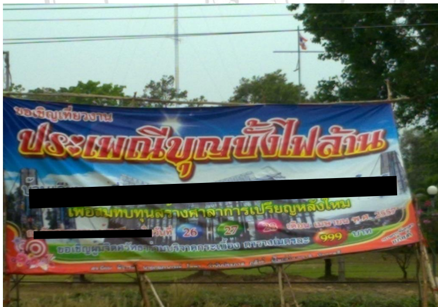
ภาพที่ 4.7 ป้ายโฆษณาข้างทางเชิญชวนเข้าร่วมงานบุญบั้งไฟ (สนาม) ในเดือนเมษายน 2557

ก่อนหน้านี้ในช่วงเดือนเมษายน 2557 ก็มีการจัดสนามพนันบั้งไฟเกิดขึ้น โดยคณะผู้ เหมาซึ่งผู้จัดงานก็เป็นชุดเดียวกันกับเดือนมิถุนายน แต่ในเดือนเมษายนจะมีเพียงการจุดบั้งไฟ ไม่มี การขบวนแห่ ไม่มีมหรสพ ชาวบ้านเรียกการจัดงานรูปแบบนี้ว่า “บั้งไฟสนาม” กิจกรรมมีแต่การ