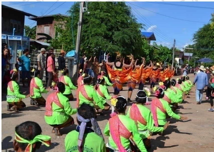
ภาพที่ 4.2 คณะฟ้อนของบ้านหนองก้าม (นามสมมติ)ปี 2556

ในช่วงเช้าของวันแห่งแต่ละบ้านก็ต้อนรับแขกหรือญาติพี่น้องที่มาเยือน บ้านทุกหลัง ต้องมีเนื้อวัว เพื่อทำลาบ และขนมจิ้น เพื่อต้อนรับแขก เหล้า เบียร์ อย่าให้ขาด ถือว่าเป็นสิ่งจำเป็น ในการจัดงานที่ขาดไม่ได้ ช่วงเวลาในการจัดงานใครที่มาเยือนหมู่บ้านเจ้าภาพก็จะได้รับการ ต้อนรับหมด ไม่ว่าจะสนิทชิดเชื้อหรือไม่ก็ตาม เพราะถือเป็นธรรมเนียมปฏิบัติหากมีผู้มาเยือนต้อง ต้อนรับ อย่าให้ขาดตกบกพร่อง สิ่งเหล่านี้วัฒนธรรมของหน้าตา ยิ่งต้อนรับดี มีแต่ของดีๆ ยิ่งได้ รับคำชื่นชม จากแขกผู้มาเยือน เมื่อถึงคราวที่เราไปเที่ยวงานบุญบั้งไฟบ้านคนเหล่านั้น เราก็จะ ได้รับการปฏิบัติอย่างดีเช่นกัน