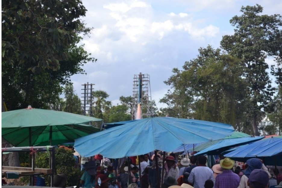
ภาพที่ 4.9 บรรยากาศในสนามจุดบั้งไฟ เดือนมิถุนายน ปี 2557

บรรยากาศบริเวณสนามจุดบั้งไฟจะมีผู้คนจำนวนมากเหมือนร่มในตลาดสดทั่วไปกางอยู่เต็มไปหมด แก้วพลาสติก โต๊ะเล็กๆ มีไว้สำหรับให้นักพนันที่เดินทางมาจากทั่วสารทิศเข้านั่งระหว่างรอลุ้นก่อนที่บั้งไฟของค่ายต่างๆ จะจุดขึ้น นอกจากนี้ยังมีอาหารและเครื่องดื่ม ของกินเล่นขายให้กับผู้ที่เข้าร่วมชม ร่วมพนันบั้งไฟมากมาย หลายอย่าง อาทิเช่น ส้มตำ อาหารทะเล ผลไม้ตามฤดูกาล เป็นต้น เนื่องจากอากาศในสนามบั้งไฟร้อนมาก และฝุ่นควันมีปริมาณที่เยอะมาก