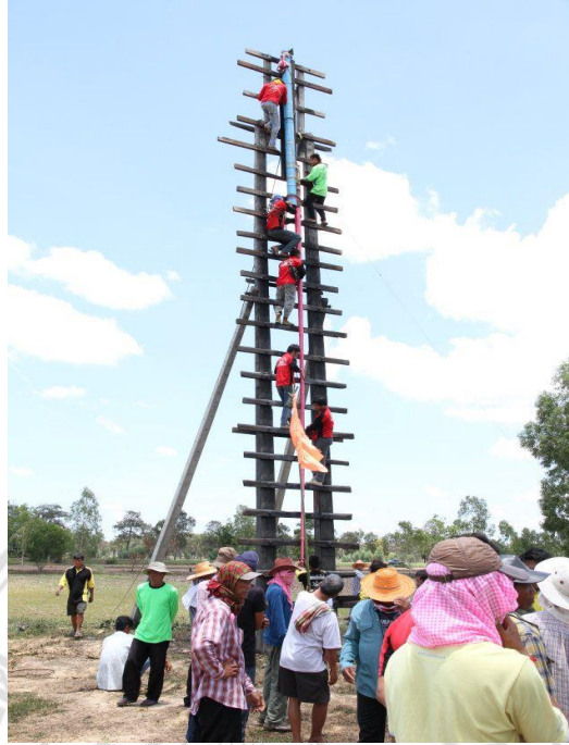
ภาพที่ 4.13 การนำบั้งไฟขึ้นฐานจุด

ผู้สนับสนุนนำเข้าบั้งไฟ บั้งไฟแต่ละบั้งจะมีราคาประมาณ ไม่ต่ำกว่า 20,000 บาท ซึ่งแต่ละบั้งและแต่ละค่ายจะราคาไม่เท่ากัน เพราะฉะนั้นแล้วผู้ที่สนับสนุนนำเข้าจะต้องเป็นผู้ที่มีฐานทางเศรษฐกิจ สังคม การเมือง อยู่พอสมควร เช่น สส.สจ. นายกอบต.ผู้ใหญ่บ้าน เจ้าของโรงงานพลาสติก เป็นต้น ขนาดเดียวกันผู้สนับสนุนก็อาจจะมาจากหน่วยงานต่างๆ เช่น โรงเรียน