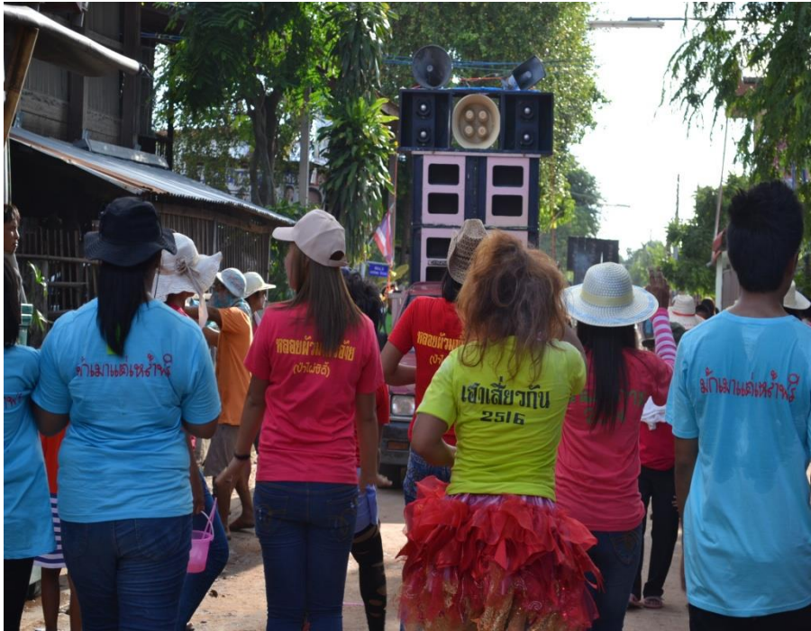
ภาพที่ 4.6 เสื้อยืดที่สกรีนเป็นข้อความต่างๆ (วัน โสม) ปี 2557