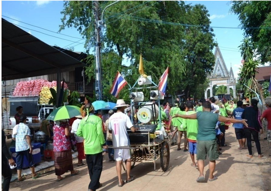
ภาพที่ 4.4 บรรยากาศชาวบ้านร่วมขบวนแห่เข้าวัด (วันโสม) ปี 2557