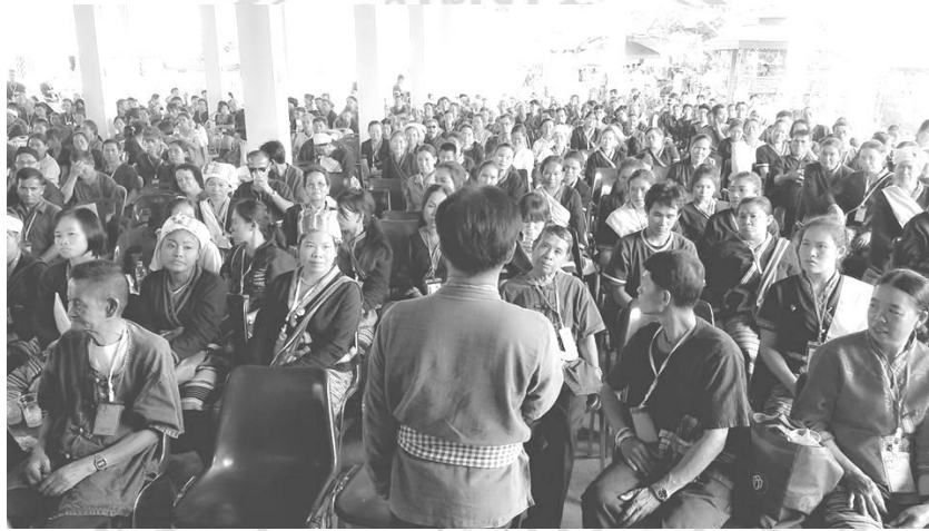
ภาพที่ 2.5 ภาพสมาชิกกลุ่ม “ไทยพลัดถิ่นภาคเหนือ” ในการประชุมประจำปี พ.ศ.2556 ที่บ้านสบแวน ตำบลเชียงบาน อำเภอเชียงคำ จังหวัดพะเยา

กระนั้นก็ตาม เนื่องจากตัวตนของกลุ่ม “ไทยพลัดถิ่นภาคเหนือ” มีความสัมพันธ์กับบริบททางประวัติศาสตร์การเสียดินแดน และสัมพันธ์กับบริบททางวัฒนธรรมของผู้คนในพื้นที่ชายแดนไทย-ลาวบริเวณเชียงคำ-ภูซางกับเมืองคอบ-เชียงฮ่อน ดังนั้นจึงมีความจำเป็นที่จะต้องทำความเข้าใจก่อนว่าบริบทต่างๆ เหล่านี้ มีผลอย่างไรต่อการกำหนดความเป็นพลเมืองไทยของ “ไทยพลัดถิ่นภาคเหนือ” และความเป็นพลเมืองดังกล่าวได้สร้างผลประทบประการใดต่อพวกเขา ดังผู้วิจัยจะกล่าวในบทต่อไป