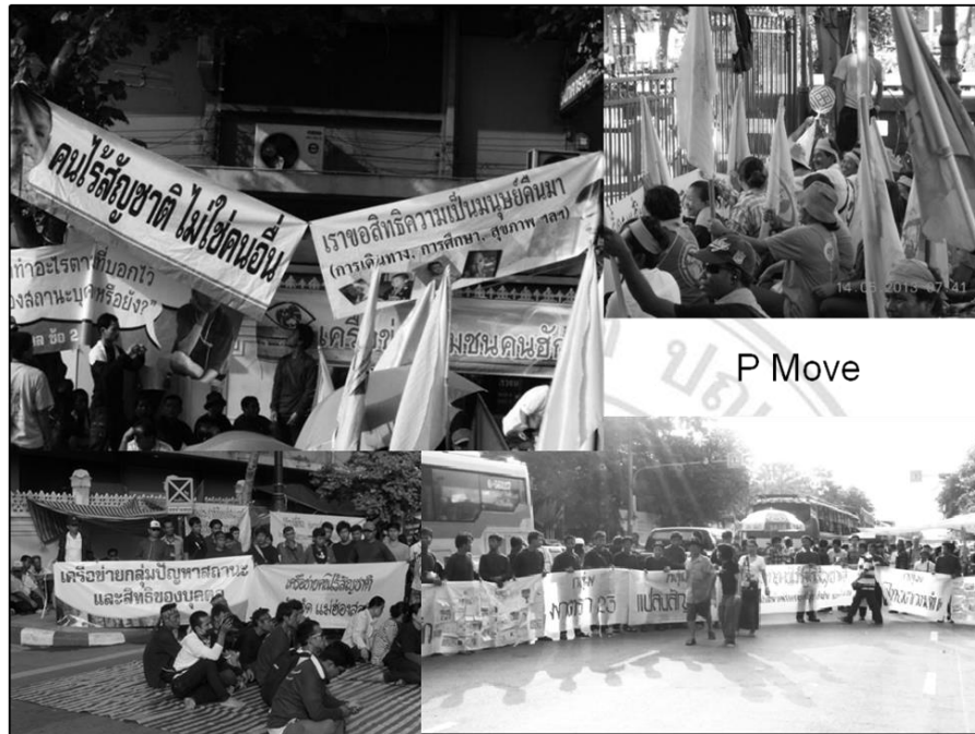
ภาพที่ 3.4 การชุมนุมของกลุ่ม “P-move” หรือ “ขบวนการประชาชนเพื่อสังคมที่เป็นธรรม” (ขปส.) ที่หน้าทำเนียบรัฐบาล ปี พ.ศ.2556 เรียกร้องให้รัฐบาลแก้ไขปัญหาหลายประเด็น รวมทั้งการไร้สัญชาติ

และสิทธิทั้งหลายที่โดยส่วนใหญ่คือ ชนกลุ่มน้อยผู้ไร้สัญชาติไร้สิทธิเท่าเทียมผู้มีสัญชาติไทย เป็นแค่เพียงพลเมืองบางส่วน