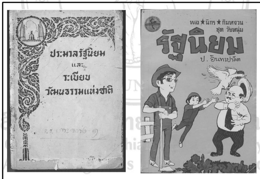
ภาพที่ 3.1 สื่อสิ่งพิมพ์ที่เกี่ยวข้องกับนโยบายรัฐนิยม สมัยจอมพล ป.พิบูลสงคราม

ความเป็นพลเมืองในรัฐไทยนับจากเปลี่ยนแปลงการปกครองถึงช่วงก่อนขึ้นทศวรรษ 2500 จึงอาจกล่าวว่าเป็น “พลเมืองแบบรัฐนิยม” ซึ่งมีลักษณะไม่ต่างจากความเป็นพลเมืองในยุคสมบูรณาญาสิทธิราชย์ ที่รัฐไทยพยายามกลืนกลายผู้คนอันหลากหลายในรัฐชาติให้กลายเป็นหนึ่งเดียวกัน และอยู่ภายใต้อำนาจรัฐที่รวมศูนย์ไว้กับผู้ปกครองเพียงผู้เดียว