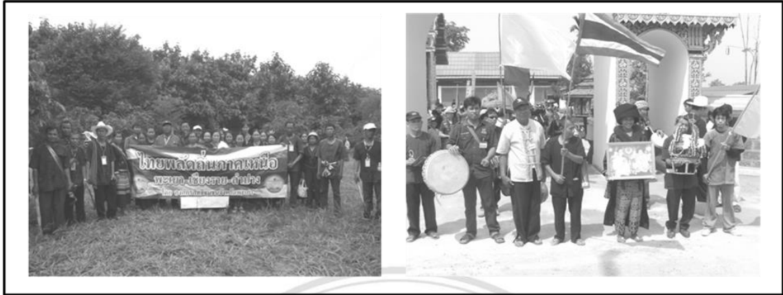
ภาพที่ 4.3 กิจกรรมปลูกป่า และกิจกรรมทอดผ้าป่าพันธุ์พืช