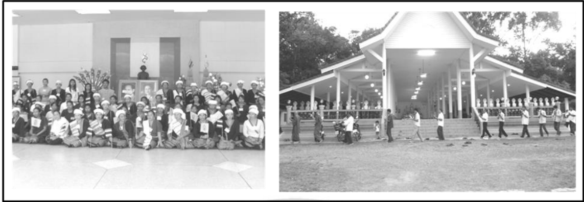
ภาพที่ 4.4 กิจกรรมถวายพระพรในหลวง และกิจกรรมเวียนเทียนวันวิสาขบูชา