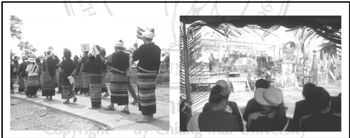
ภาพที่ 4.7 ภาพกิจกรรม งานสืบสานอัตลักษณ์และวิถีชีวิตชาติพันธุ์ไทยลื้อและไทยพลัดถิ่นภาคเหนือ

ผู้ร่วมพิธีปรบมือให้กับสุนทรพจน์ที่มีเนื้อหาเริ่มต้นด้วยการชื่นชมและให้เกียรติ กับคนกลุ่มน้อยในประเทศไทยแล้วสรุปปิดท้ายด้วยความสำคัญยิ่งใหญ่ของประเทศชาติ จากนั้น มีการแสดงฟ้อนรำที่เป็นทิมของเยาวชนในชุมชน ฟ้อนเจิงจากสมาชิก กลุ่ม และขับลือจากตัวแทนของสมาชิกกลุ่ม และมีพิธีรดน้ำคำห้วยแขกผู้มีเกียรติและผู้เฒ่า ผู้แก่ที่เป็นสมาชิกของกลุ่ม (รวมทั้งหัวหน้าช่าง) ปิดท้ายด้วยการเล่นสาดน้ำและร้อง สังสรรค์จากเหล่าเพื่อนสมาชิก บางคนขึ้นไปร้องเพลงบนเวที แขนงอย่าง “อ้ายอิน” ร้องเพลงโปรด ‘ไทดำรำพัน’ มีเนื้อเพลงเริ่มต้นว่า “สิบห้าปี ที่ไต่เขา ห่างแดนดิน (เดิน เข้าไป) ...จงเอ็นดู หมู่น้อย ที่พลอยพรากบ้าน ” แม้จังหวะเพลงนี้จะสนุกสนานแต่ สำเนียงเนื้อหาเจ้าความอาดูรเศร้าสร้อยในความรู้สึกของผู้วิจัย ขณะที่สมาชิกคนอื่นๆ ร้องเพลงจังหวะชวนเต้นรำ ทุกคนแลดูยิ้มอย่างสดใสและภูมิใจต่อการร่วมทำกิจกรรม ครั้งนี้ สมาชิกบางคนอาจยิ้มให้กับความหวังที่เริ่มเรื่องราวกับแสงของตะวันรอนๆ อันร้อนหลายปลายเดือนเมษายน (บันทึกภาคสนามวันที่ 22 เมษายน พ.ศ.2557)