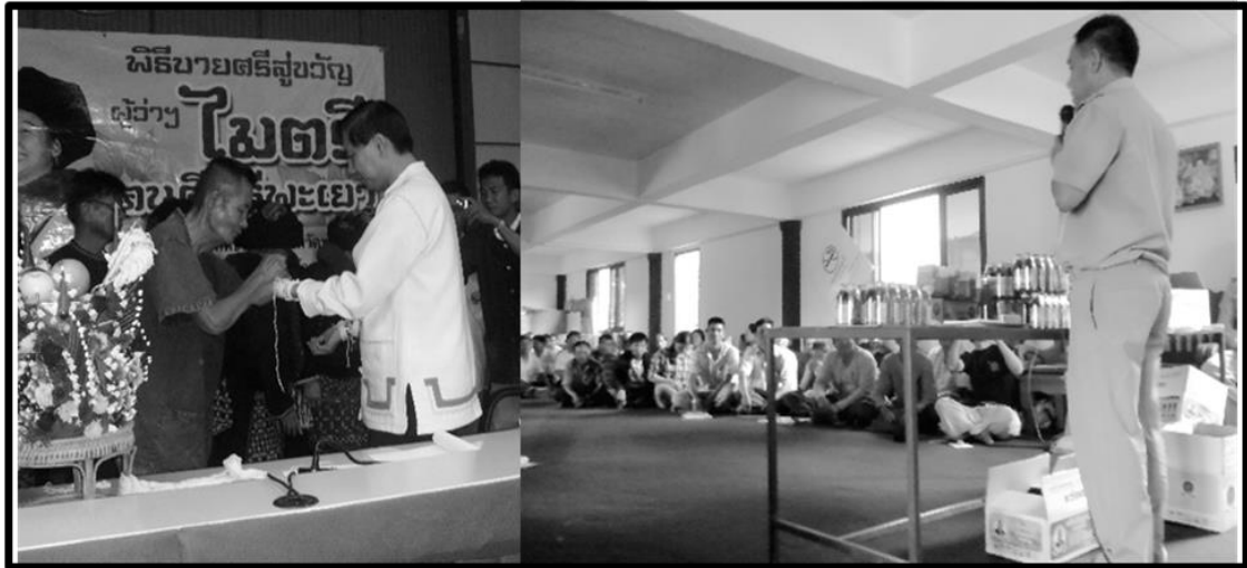
ภาพที่ 4.6 “ไทยพลัดถิ่นภาคเหนือ” ร่วมกิจกรรมบายศรีสู่ขวัญผู้ว่าราชการจังหวัดพะเยา (ซ้าย) และ รับฟังโอวาทจากนายอำเภอเชียงคำในการประชุมประจำเดือน (ขวา)