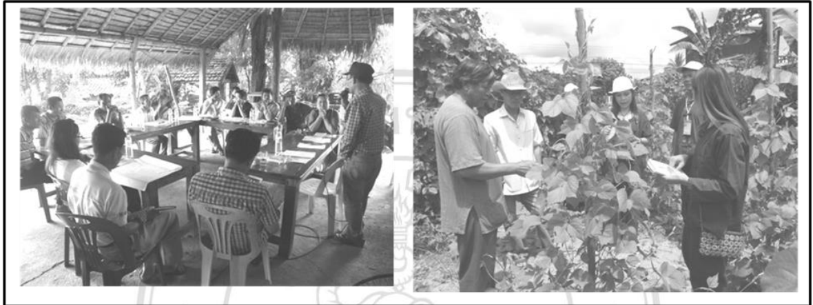
ภาพที่ 4.2 กิจกรรมพัฒนาอบรมผู้นำ และกิจกรรมส่งเสริมอาชีพ

ที่สอดคล้องกับหัวข้อที่พวกเขาได้เรียนรู้ในเรื่องสิทธิจากการทำหน้าที่ในประเด็นที่ว่า การจะทำหน้าที่ต่อผู้อื่นได้อย่างสมบูรณ์ย่อมเริ่มจากการพัฒนาศักยภาพตนเองเสียก่อน ดังเช่น กิจกรรมอบรมให้ความรู้ด้านกฎหมายและสิทธิ กิจกรรมสอนหนังสือ กิจกรรมอบรมครอบครัวเข้มแข็ง การอบรมและฝึกอาชีพ กิจกรรมปฏิบัติธรรม โครงการสมุดพศความดี เป็นต้น