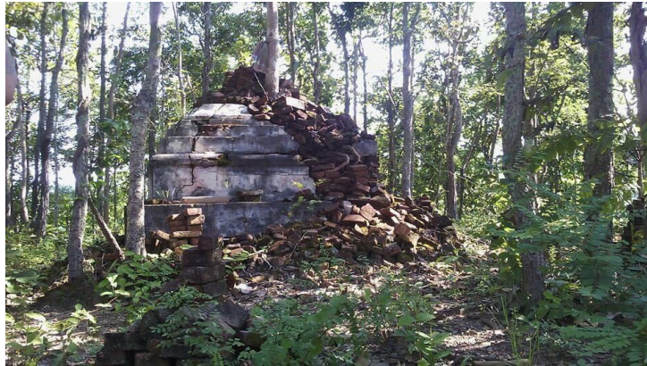
ภาพที่ 4.1 ซากเจดีย์ในม่อนวัด วัดประจำหมู่บ้านหลวงเมื่อในอดีตที่ปัจจุบันถูกทิ้งร้าง

พระอุโบสถ กุฏิ กำแพงล้อมรอบทั้ง 4 ด้านของวัด 9 ส่วนม่อนวัดก็ถูกทิ้งเป็นวัดร้างเดิมเคยพบเห็นซากปรักหักพังของกำแพงวัด ปัจจุบันคงเหลือเฉพาะซากปรักหักพังของเจดีย์ที่ถูกปกคลุมด้วยแมกไม้เท่านั้น