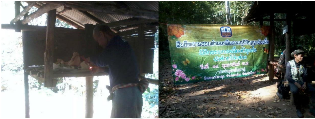
ภาพที่ 4.8 ประเพณีเลี้ยงฮีตฮอยน้ำของคนไทยที่บ้านทาгүй

4. ประเพณีสืบชะตาหลวง ทำให้วันที่ 16 สิงหาคม ของทุกปี เนื่องจากตรงกับวันคล้ายวัน เกิดของเจ้าอาวาสองค์ก่อนหน้าที่มีมรณะภาพไปแล้วจะจัดงานมูทิตาจิตและจัดพิธีสืบชะตาหลวง