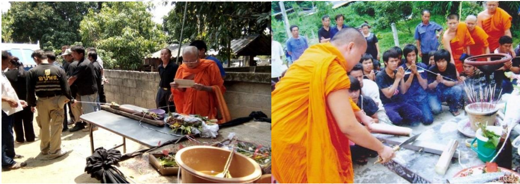
ภาพที่ 4.24 พิธีตัดสายผัวสายเมีย หรือเรียกว่า “ผ่าจันผี” หรือ “ตัดสายผัวเมีย”

นอกจากนี้หากศพคนไทยของรายใดมีสามีหรือภรรยา ถือว่าเป็นการตายละคู่ครองของตน รวมทั้งญาติพี่น้องวิญญาณของผู้ตายยังคงมีความผูกพันกับคู่ครองและญาติพี่น้องของตนเองเมื่อครั้งมีชีวิตอยู่ คนไทยที่บ้านทาภูเชื่อว่า ผัว เมียหรือญาติพี่น้องนั้นจะมีความห่วงใย อาลัยระหว่างคนอยู่กับคนตายทำให้เกิดความไม่สบายใจบางครั้งถึงกับกินไม่ได้นอนไม่หลับคิดถึงกันมาก จำเป็นต้องมีการตัดความสัมพันธ์ดังกล่าวด้วยพิธี “ตัดสายผัวเมีย” หรือ “ผ่าจันผี” ก่อนเคลื่อนศพออกจากบ้าน พิธีเช่นนี้จึงเป็นกุศโลบายทำให้คนที่ยังมีชีวิตอยู่ อยู่อย่างสบายใจ พิธีกรรมนั้นบอกให้ทราบว่า ต่างคนต่างอยู่ ผีก็อยู่ส่วนผี คนก็อยู่ส่วนคน และจงคลายความเสียใจในสิ่งที่พลัดพรากกัน