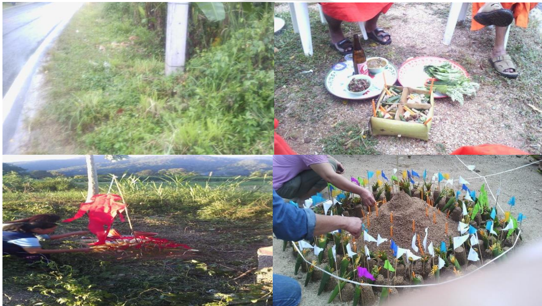
ภาพที่ 4.15 การทำพิธีกรรมถอนวิญญาณคนตายโหงจากอุบัติเหตุของคนไทยที่บ้านทาภู

วิญญาณ เพื่อถอนวิญญาณของผู้ตายให้ออกจากจุดที่เสียชีวิต คนไทยที่บ้านทาภูเชื่อว่าวิญญาณของผู้ตายจะติดอยู่ตรงบริเวณเสียชีวิตไม่ยอมไปไหน ไม่ไปผุดไปเกิด จึงต้องทำพิธีถอนวิญญาณให้ออกจากจุดที่เสียชีวิตให้วิญญาณไปกับศพและไปผุดไปเกิดใหม่ โดยนิมนต์พระสงฆ์มาทำพิธีกรรมถอนวิญญาณ นำธูปเทียนมาปักบนกองทรายตรงที่เสียชีวิต หรือทำเป็นกองทรายปึกตรงรอบกองทราย มีสวดดอก ธูปและเทียนประดับ หรืออาจนำเสตวงพร้อมเครื่องเช่น ไห้วมาวางที่จุดเสียชีวิต และสวดเชิญวิญญาณกลับไปกับศพ