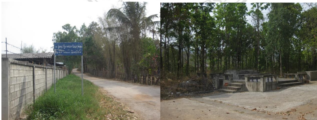
ภาพที่ 4.13 สุสานบ้านทาภู หมู่ 1 สำหรับฌาปนกิจศพคนไทยของบ้านทาภูในปัจจุบัน

ป่าช้าท่งหกกก็ถูกเลิกใช้อย่างถาวรนำไปสู่การเลือกใช้พื้นที่ว่างที่อยู่ทางตอนใต้ของหมู่บ้าน และอยู่ทางทิศใต้ของโรงเรียนบ้านทาภูและเรียกพื้นที่ป่าช้าใหม่ว่า “สุสานบ้านทาภู”