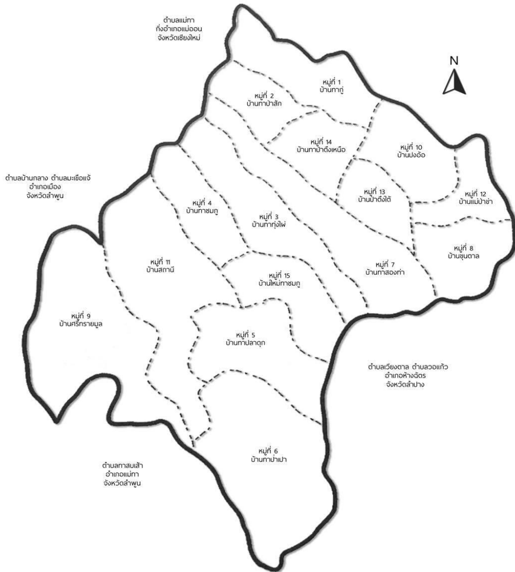
ภาพที่ 4.2 แผนที่หมู่บ้านในตำบลทาลาดุก

ภูมิประเทศบ้านท่ากู๋ เป็นหมู่บ้านเล็ก ๆ อยู่เหนือสุดของอำเภอแม่ทา ติดกับ ตำบลแม่ทา อำเภอแม่อน จังหวัดเชียงใหม่ ระยะทางจากอำเภอแม่ทา ถึงบ้านท่ากู๋ ประมาณ 18 กิโลเมตร มีอาณาเขตติดต่อกับหมู่บ้านอื่น ๆ ดังต่อไปนี้