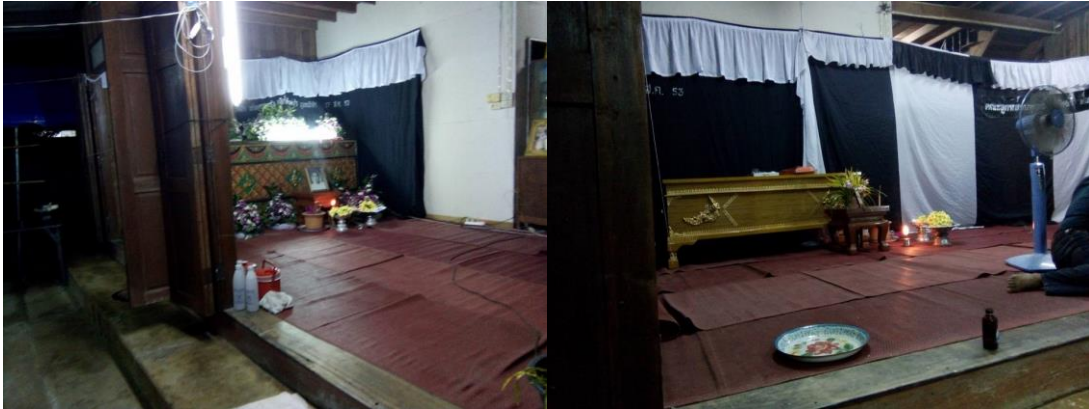
ภาพที่ 4.16 ศพที่ใส่โลงเย็นและโลงศพไม้ในช่วงทำพิธีบำเพ็ญกุศลศพ

เหมาะสมของสถานที่แต่จะไม่หันศีรษะศพหรือปลายเท้าศพเข้าหาโต๊ะหมู่บูชา และโต๊ะหมู่บูชาพระรัตนตรัยจะตั้งไว้ด้านขวามือของพระสงฆ์ในพิธีซึ่งสูงกว่าอาสนสงฆ์พอสมควรและนิยมหันหน้าโต๊ะหมู่ไปทางทิศตะวันออกแต่ถ้าหากสถานที่วางศพไม่อำนวยก็จะหันหน้าโต๊ะหมู่ไปทางทิศเหนือหรือทิศใต้เท่านั้น ด้านหน้าศพจะวางกระถางไว้สำหรับจุดธูปของมาศพพร้อมที่จุดไฟนำทางที่มักใช้ตะเกียงน้ำมันก๊าดจุดตลอดวันตลอดคืนซึ่งเจ้าภาพต้องหมั่นดูแลไม่ให้ดับแต่ถ้าดับก็ให้รีบจุดให้ติดไฟดังเดิม