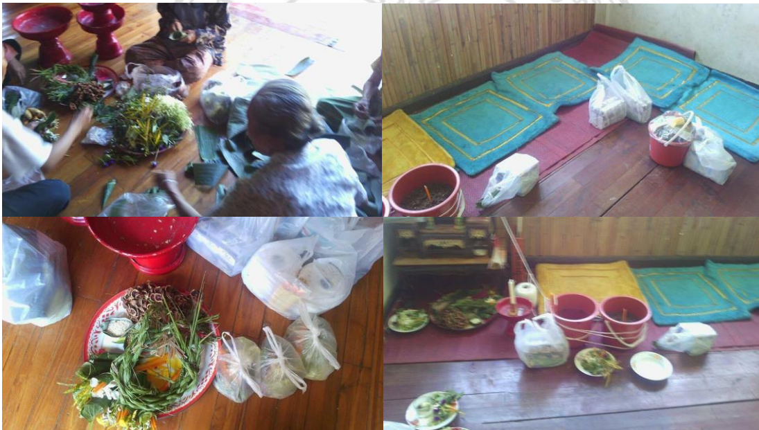
ภาพที่ 4.18 ญาติพี่น้องคนไทยของบ้านทาภูช่วยกันเตรียมสิ่งของสำหรับบำเพ็ญกุศลศพ

(3.1) การเตรียมสิ่งของที่เกี่ยวเนื่องกับการบำเพ็ญกุศลศพ ญาติผู้ตายจะทำการจัดเตรียมเครื่องไทยธรรม จตุปัจจัย สำหรับถวายพระสงฆ์ จัดเตรียมโต๊ะหมู่บูชาต้องตั้งไว้ด้านขวามือของพระสงฆ์ในพิธีและสูงกว่าอาสนสงฆ์ แต่ก็นิยมหันหน้าโต๊ะหมู่บูชาไปด้านทิศตะวันออก บนโต๊ะหมู่บูชาประกอบด้วย พระพุทธรูป 1 องค์ กระจ่างรูป 1 ใบ เเชิงเทียน 1 คู่ และแจกันดอกไม้สด 2 แจกัน จัดเตรียมพาน ผ้าบังสุกุล สายสิญจน์และภูษาโยงสำหรับให้พระสงฆ์ทอดผ้าบังสุกุล