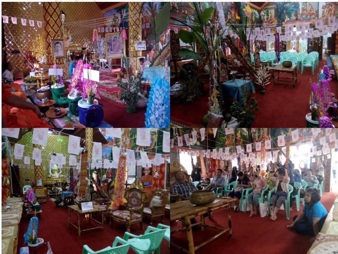
ภาพที่ 4.9 ประเพณีสืบชะตาหลวงของคนไทยที่บ้านทาгүй หมู่ 1 ตำบลทาปลาดุก ที่มา: พระวีระศักดิ์ หลวงไฝ่ (อธิปญโญ) เจ้าอาวาสวัดทาгүйแก้ว

4. ประเพณีสืบชะตาหลวง ทำให้วันที่ 16 สิงหาคม ของทุกปี เนื่องจากตรงกับวันคล้ายวัน เกิดของเจ้าอาวาสองค์ก่อนหน้าที่มีมรณะภาพไปแล้วจะจัดงานมูทิตาจิตและจัดพิธีสืบชะตาหลวง