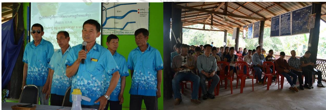
ภาพที่ 4.4 ศูนย์เรียนรู้เพื่อการพัฒนาเศรษฐกิจพอเพียงบ้านทาภู

อื่นที่เกี่ยวข้องกับการเรียนของตนเองทั้งในบ้านและโรงเรียนอันเป็นการเรียนรู้เกี่ยวกับการใช้ชีวิต ในขณะที่พ่อแม่ หรือผู้ใหญ่ในหมู่บ้านที่ต่างประกอบอาชีพก็จะอาศัยความเกื้อกูลระหว่างกัน โดยใช้ผลผลิตของตนเองไปแลกเปลี่ยนกับของเพื่อนบ้าน เช่น ผู้เลี้ยงวัวเมื่อได้มูลวัวก็จะนำไปหมักหรือทำปุ๋ยแล้วนำไปให้แก่คนปลูกข้าวโพดสำหรับทดแทนปุ๋ยเคมีเมื่อเก็บผลผลิตฝักอ่อนแล้วก็จะมอบเปลือกข้าวโพดให้แก่ผู้เลี้ยงวัวเพื่อนำไปเลี้ยงวัว ซึ่งวัวชอบกินซังและเปลือกข้าวโพดมาก นอกจากนี้ผู้เลี้ยงวัวยังนำไปใช้ประโยชน์อื่นๆ เพื่อสานความสัมพันธ์ภายในชุมชนได้อีกได้แก่ นำไปทำแก๊สหุงต้มภายในครัวเรือนและบ้านใกล้เรือนเคียงเป็นการช่วยลดค่าใช้จ่าย นำไปแลกเปลี่ยนจากเพื่อนบ้านเป็นการแบ่งปันและเป็นวิถีแห่งความเกื้อกูลในชุมชน 29 ความสัมพันธ์อันดีภายในชุมชนตลอดจนสภาพแวดล้อมที่ดีมีผลต่อการพัฒนาชุมชน ผู้การเป็นชุมชนท่องเที่ยวเชิงสุขภาพ บ้านทาภูเมื่อปี พ.ศ. 2555 โดยมีจุดเด่นที่สำคัญด้านการท่องเที่ยว 4 ประการ คือ ด้านอาหาร ด้านของที่ระลึก ด้านเสื้อผ้าเครื่องแต่งกาย และด้านภูมิปัญญาสุขภาพ 30 และยังคงดำเนินการอยู่จนถึงปัจจุบัน มีผลต่อการพัฒนาชุมชนให้เป็นชุมชนต้นแบบหมู่บ้านเศรษฐกิจพอเพียงเฉลิมพระเกียรติ ประจำปี พ.ศ.2554 ของกรมพัฒนาชุมชนกระทรวงมหาดไทย ทั้งหมดล้วนแต่อาศัยความสัมพันธ์กันภายในกลุ่ม อย่างไม่เป็นทางการและ เป็นทางการตลอดจนความเอื้ออาทรที่มาจากศักยภาพทางการเกษตรกรรมและการปศุสัตว์ ชุมชนบ้านทาภูจึงมีการตั้งศูนย์เรียนรู้กำหนดฐานเรียนรู้หลายฐานได้แก่ ฐานโอท็อป อาหารปลอดภัย แก้ปัญหาเกี่ยวกับหนี้ในระบบภายในหมู่บ้าน พลังงานทดแทน ฐานพอเพียง และฐานเฝ้าระวังทรัพยากรธรรมชาติและสิ่งแวดล้อม 31