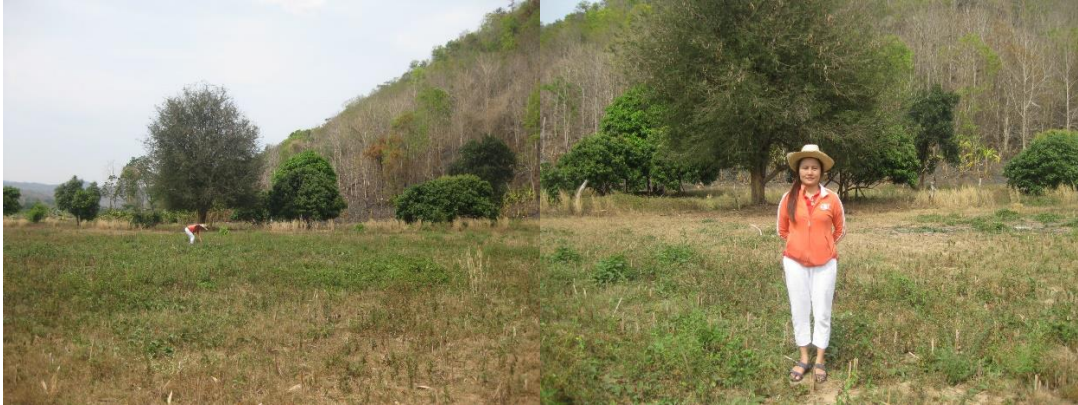
ภาพที่ 4.12 ผู้ศึกษาเข้าสำรวจป่าช้าทุ่งหูกที่ในอดีตเคยถูกใช้ฝังหรือเผาศพคนไทยที่บ้านทา 56

ทุ่งหูกเหมือนกัน มีการใช้เกวียนเคลื่อนศพไปป่าช้าทุ่งหูก 4 – 5 ศพด้วยกัน ปัจจุบันเกวียนที่ใช้สำหรับเคลื่อนศพยังคงถูกรักษาไว้ที่บ้านของนายไส ไชยมาสพงษ์ 55 มีสภาพดีมาก นอกจากจะเคยใช้สำหรับเคลื่อนย้ายศพแล้วเกวียนเล่มนี้ก็เคยถูกใช้ขนส่งผลผลิตการเกษตรรวมถึงไม้ฟืนโดยใช้วัวเทียม แต่ขณะนี้ยุติการใช้งานแล้วถูกตกแต่งและดูแลรักษาเป็นอย่างดี เจ้าของเกวียนตั้งใจอนุรักษ์ไว้ให้คนรุ่นหลังได้เห็นและเรียนรู้วิถีเกษตรกรรมของคนไทยที่บ้านทา 56