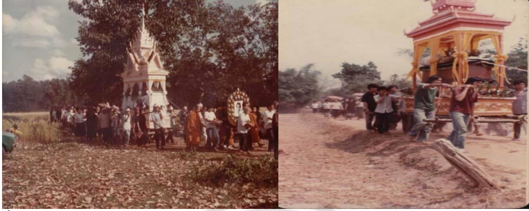
ภาพที่ 4.25 การหามปราสาทศพไปสุสานเมื่อประมาณ 30 ปีที่แล้ว