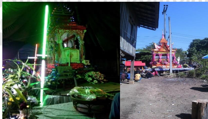
ภาพที่ 4.17 การนำโลงศพมาตั้งบนปราสาทศพช่วงคืนสุดท้ายของการบำเพ็ญกุศลศพ

(2.3) ปราสาทศพ ในคืนสุดท้ายของการบำเพ็ญกุศลศพ คนไทยที่บ้านตากู่จะนำโลงศพที่อยู่ในตัวอาคารบ้านหรือสถานที่จัดบำเพ็ญกุศลศพมาไว้ที่ปราสาทศพ ที่อยู่ภายนอกอาคารหรือสถานที่จัดบำเพ็ญกุศลศพ ด้วยการไปหาซื้อจากแหล่งผู้รับทำปราสาทศพ แล้วตกแต่งประดับประดาด้วยดอกไม้หรือหลอดไฟให้มีความสวยงาม กลางคืนก็จะเปิดไฟกระพริบแสงระยิบระยับสวยงาม