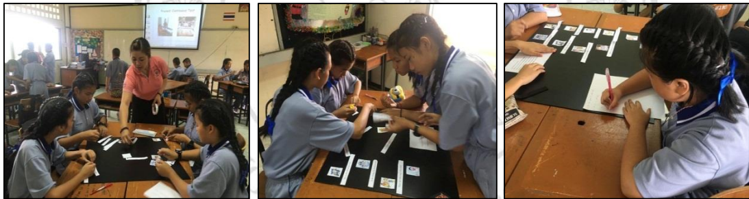
รูปภาพบรรยากาศการจัดการเรียนการสอนในชั้นเรียนวันที่ 24 พฤษภาคม พ.ศ. 2559

ให้นักเรียนนำงานที่ได้รับมอบหมายไปทำตอนนอกเวลาสำหรับบางกลุ่มที่ไม่เสร็จในชั่วโมงเรียน