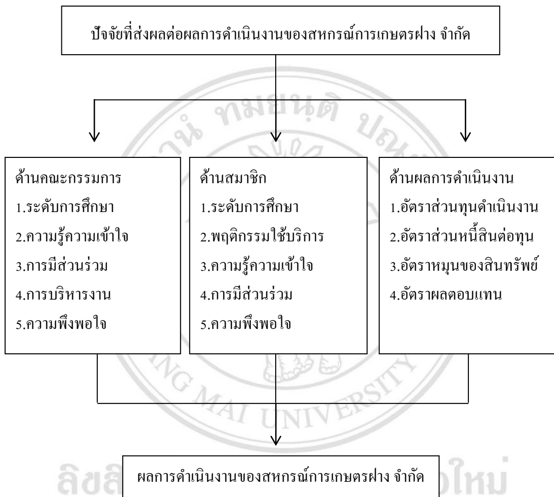
ภาพที่ 2.2 แสดงกรอบแนวคิดในการศึกษา

การศึกษาครั้งนี้เป็นการประเมินผลการดำเนินงานของสหกรณ์การเกษตรฝาง จำกัด อำเภอฝาง จังหวัดเชียงใหม่ โดยมีวิธีการดำเนินการศึกษา ดังนี้