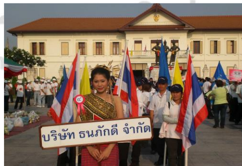
ภาพบริษัทเข้าร่วมกิจกรรมกับส่วนราชการ วันแรงงาน 2559