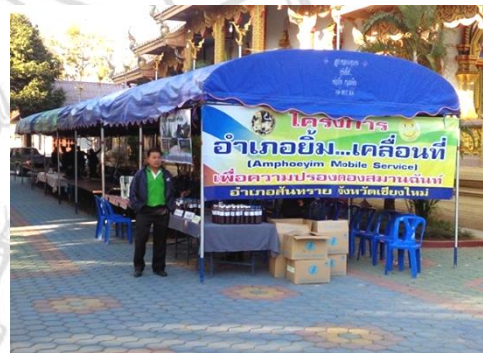
ภาพกิจกรรมเผยแพร่ประโยชน์ของน้ำกากส่าในด้านการเกษตรและการใช้น้ำ EM ในอำเภอสันทราย จังหวัดเชียงใหม่