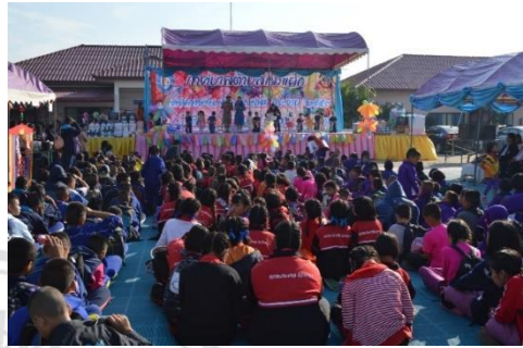
ภาพกิจกรรมการจัดร่วมจัดกิจกรรมวันเด็ก ณ เทศบาล ตำบลแม่แฝก , ลานเอนกประสงค์บ้านร่มหลวง และการสนับสนุนสถานที่ฝึกซ้อมกีฬา กศน.เกมส์ ปี 2559