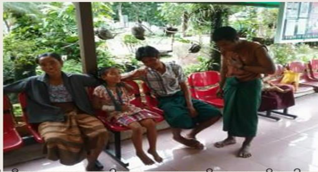
တီဘီအဆုတ်ရောဂါ.....ဘယားလိုကူစကားနိဗ္ဗာန်ပါသလဲ