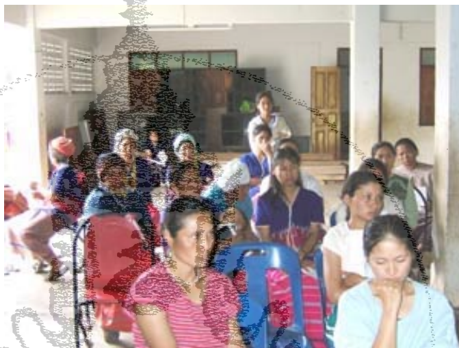
ภาพที่ 4.1 การเข้าร่วมการประชุมครั้งที่ 1 ของชุมชน

กำหนดชำระ (Refinance) หรือกู้ยืมเพื่อใช้ในการประกอบอาชีพบางส่วน (ยังไม่มีภาระเชื่อมโยงเข้ากับการแก้ไขปัญหาของชุมชนที่มีอยู่) นอกจากนี้ยังมีเงินที่ได้รับมาจากหน่วยงานอื่นๆ ซึ่งเป็นการให้เปล่า เช่น เงินสนับสนุนจากผู้สมัครรับเลือกตั้งสมาชิกสภาผู้แทนราษฎร เป็นต้น