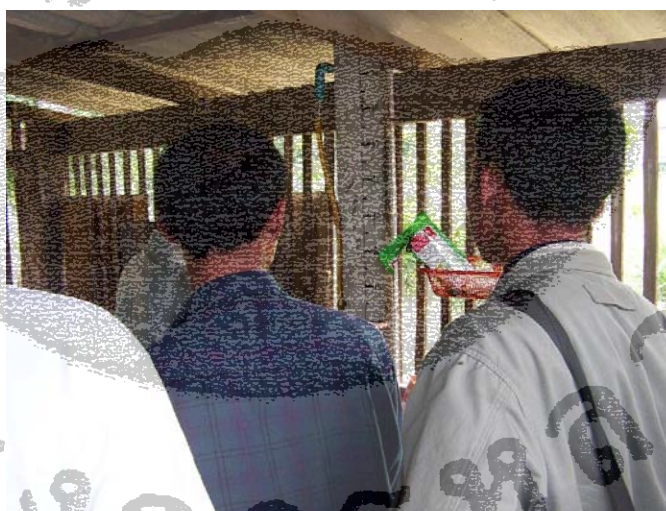
ภาพที่ 4.35 การต่อท่อแก๊สมาใช้ในครัวเรือน