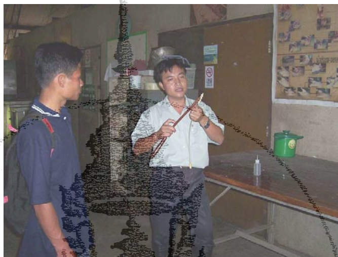
ภาพที่ 4.31 วิทยากรอธิบายเรื่องการผสมเทียม