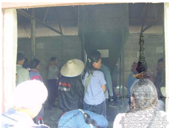
ภาพที่ 4.25 ชมเครื่องผสมอาหาร