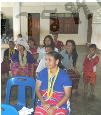
ภาพที่ 4.4 การเข้าร่วมการประชุมครั้งที่ 2