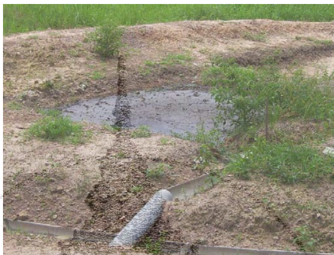
ภาพที่ 4.34 มูลสุกรที่เหลือจากการหมัก ซึ่งสามารถนำไปเป็นปุ๋ยได้