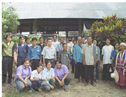
ภาพที่ 4.26 คณะผู้เข้าร่วมการสัมมนา