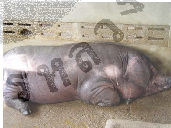
ภาพที่ 4.23 หมูป่า