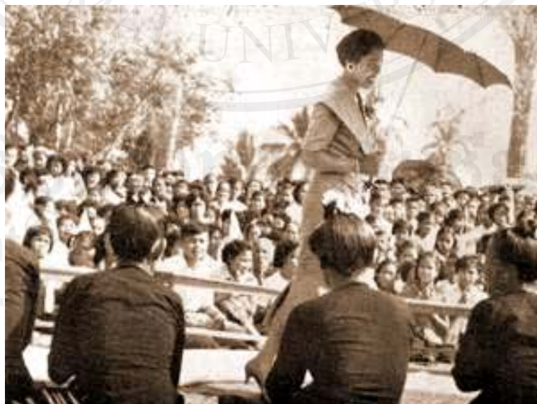
รูป ๒.๕ แสดงการแต่งกายการใส่เสื้อสี่ของชาวไทย-ชนวนลับแล

ผู้หญิงชาวไทย-ชนวนลับแลจะไม่นิยมสวมเสื้อนุ่ง แต่จะใช้ผ้ามัดนมหรืออกแทน ยกเว้นว่าต้องไปงานพิเศษหรืองานสำคัญ ก็จะใส่เสื้อ “สี่” ลักษณะคล้ายเสื้อแขนกระบอกในปัจจุบันแต่มีสามตะเข็บ ชาวบ้านเรียกว่า “เสื้อสามตุ๊ก” คือ ตะเข็บด้านซ้าย ขวา ยาวจากสุดปลายแขนเสื้อเรื่อยมาจนถึงสุดชายเสื้อด้านล่าง และด้านหลัง ตั้งแต่คอเสื้อเรื่อยมาจนถึงชายเสื้อด้านล่าง ทอด้วยด้ายสีสี่ (สีเขียวเหลืองดำ) ทิดกระดุมเงิน โดยรอบแนวสาบเสื้อจนมาถึงชายเสื้อด้านหน้าซึ่งถ้าใครมีฐานะดีก็จะทิดกระดุมมาก นอกจากจะใช้เสื้อสี่แล้วบางคนอาจใช้เสื้อสีดำหรือสีครามก็ได้ดังที่ www.nn.nstda.or.th/king/image/tour/P314.jpg (ระบบออนไลน์ : ๒๗ กันยายน ๒๕๕๒) เสนอรูปผู้หญิงชาวลับแล ดังรูป ๒.๕ แสดงรูปผู้หญิงชาวไทย-ชนวนลับแลรวมกันไปรับเสด็จสมเด็จพระนางเจ้าฯ พระบรมราชินีนาถ เมื่อคราวพระองค์เสด็จประพาสเมืองลับแล เมื่อปี พ.ศ. ๒๕๑๕