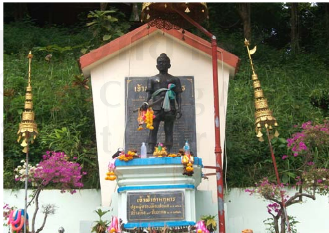
รูป ๒.๑ แสดงอนุสาวรีย์เจ้าฟ้าฮ่ามกุมาร ปฐมกษัตริย์ในตำนานผู้ครองเมืองลับแล