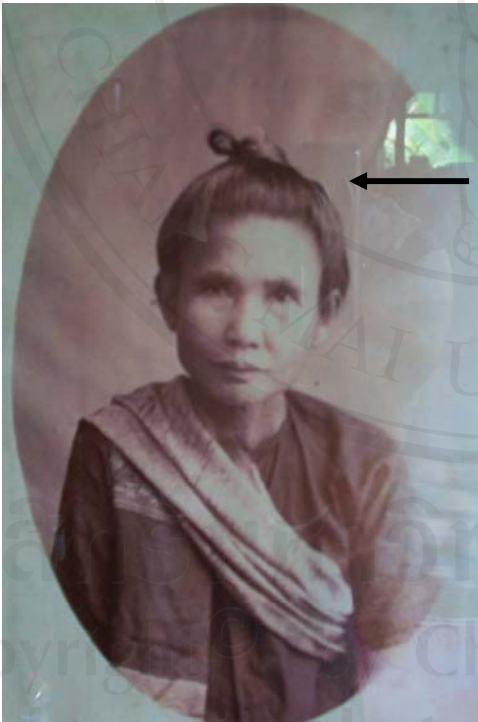
ทรงวิดว็อง