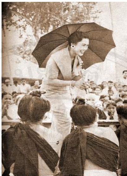
รูป ๒.๖ แสดงการแต่งกายโดยมีการห่มผ้าส่ว้น(สไบ)ของชาวไท-ยวนลัับแลง

นอกจากผ้าที่ใช้ในการมัดดอกหรือนมแล้ว หญิงชาวไท-ยวนลัับแลงยังมีผ้าส่ว้น (ผ้าสไบ) ห่มทับอีกชั้นหนึ่งซึ่งสามารถห่มทับได้ทั้งบนเสื้อตัว และผ้ามัดดอกทั่วไป โดยจะมีการใช้สีที่แตกต่างกันเพื่อบ่งบอกสถานภาพทางสังคมอีกด้วย กล่าวคือ หญิงที่แต่งงานแล้วจะใช้ผ้าส่ว้นสีดำเท่านั้นในการห่ม ส่วนหญิงที่ยังไม่ได้แต่งงานนั้นให้ใช้ผ้าส่ว้นสีขาวห่ม และหากอากาศเย็นก็จะใช้ผ้าห่มหัวเก็บ (เป็นผ้าห่มทอมือผืนไม่ใหญ่มาก ด้านใดด้านหนึ่งจะมีการเก็บปลายผ้าเป็นลวดลายต่างๆ พร้อมปักเลื่อมเพื่อความสวยงามด้วย) ห่มทับอีกชั้นหนึ่ง