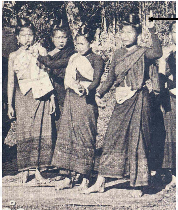
รูป ๒.๗ แสดงทรงผม วิดว็อง และทรงหลักว้าวหลักควาย ของผู้หญิงชาวไท-ยวนลับแลง

ทรงผม ของชาวไท-ยวนลับแลง แต่โบราณ พบว่าผู้หญิงจะนิยมการเกล้าผมสูง มี ๒ วิธี คือ การเกล้าแบบวิดว็องและแบบหลักว้าวหลักควาย ดังในรูปที่ ๒.๗ แสดงรูปการเกล้าผมทรงวิดว็องของแม่หม่อน (ยายทวด) ของนางเลียง บัวคำ ปัจจุบันนางเลียง บัวคำ เสียชีวิตไปแล้ว