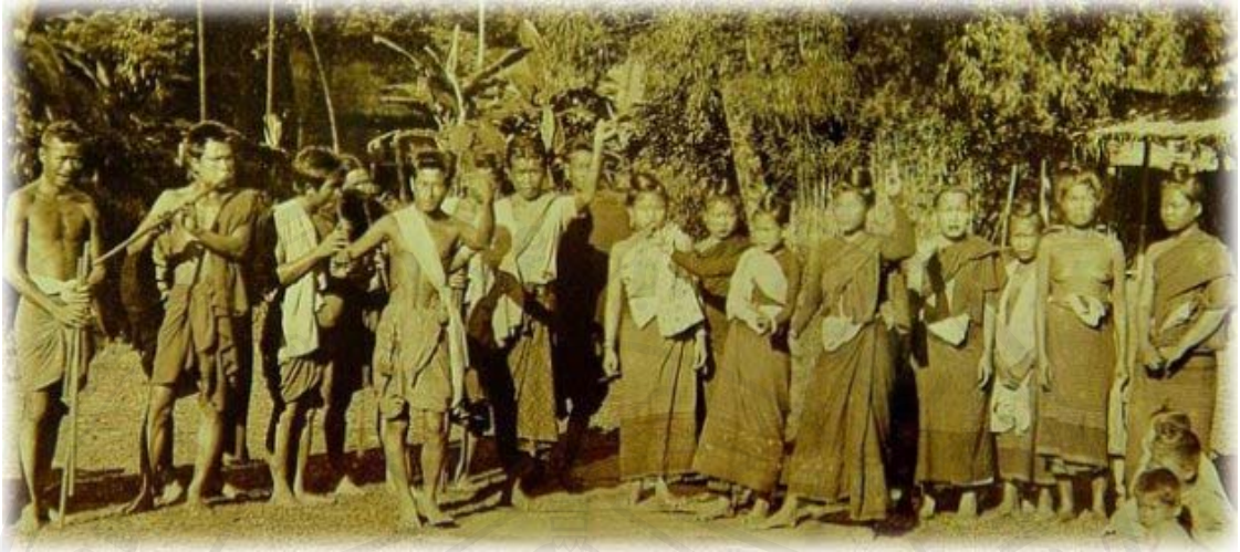
รูป ๒.๒ แสดงการจับชอซึ่งเป็นการแสดงของคนไท-ยวน ที่อำเภอลับแล จังหวัดอุตรดิตถ์

http://sor.cm๗๗.com/soro๖.htm (ระบบออนไลน์: ๑๐ ส.ค. ๒๕๕๒) ได้เสนอรูปถ่ายของช่างชอเมืองลับแล และได้กล่าวว่า ภาพช่างชอเมืองลับแลนี้ ต้นฉบับเก็บรักษาอยู่ที่หอจดหมายเหตุแห่งชาติทำวาสุกรีซึ่งเป็นสมบัติเดิมของ พณฯ แอมิลตัน คิง เอกอัครราชทูตของสหรัฐอเมริกาประจำสยาม อยู่ระหว่างปี พ.ศ. ๒๔๔๑-๒๔๕๕ หรือระหว่างรัชกาลที่ ๕ ต่อถึงรัชกาลที่ ๖ สันนิษฐานว่าภาพถ่ายนี้เป็นฝีพระหัตถ์ของ สมเด็จพระเจ้าบรมวงศ์เธอ กรมพระยาดำรงราชานุภาพ ในการเสด็จตรวจราชการเมืองลับแลครั้งใดครั้งหนึ่งระหว่างทรงเป็นเสนาบดีมหาดไทยในรัชกาลที่ ๕ เป็นที่น่าศึกษาว่าชาวเมืองเชียงแสนที่อพยพมาอยู่ลับแลนั้น ได้นำเอาการจับชอ และภูมิปัญญาดั้งเดิมมาด้วย และยังคงมีการจับชอกันอยู่ในยุคนั้น ปัจจุบันชอเมืองลับแลได้หายสาบสูญไปแล้ว ยังคงเหลือเพียงแต่วัฒนธรรมการพูด และการทอผ้าเท่านั้น