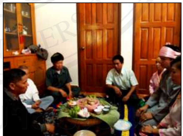
ภาพ 5.4 พิธีแต่งงานที่จัดขึ้นในบ้าน

หมายเหตุ : บันทึกภาพถ่ายเมื่อวันที่ 20 เมษายน 2554