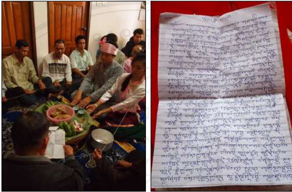
ภาพ 5.3 ผู้นำพิธีกล่าวคำอวยพรคู่บ่าวสาวเป็นภาษาลื้อ หมายเหตุ : บันทึกภาพถ่ายเมื่อวันที่ 6 กุมภาพันธ์ 2554

ปัจจุบันงานแต่งงานบางงานในพิธีกรรมจะไม่มีขั้นตอนของพิธีกรรมมากมาย มีเพียงบายศรีสองชั้น ด้ายสายสิญจน์สำหรับผูกข้อมือข้อมือบ่าวสาว เท่านั้นและการทำพิธีกรรมใช้เวลาไม่นานประมาณ 1 ชั่วโมงก็เป็นอันเสร็จพิธี