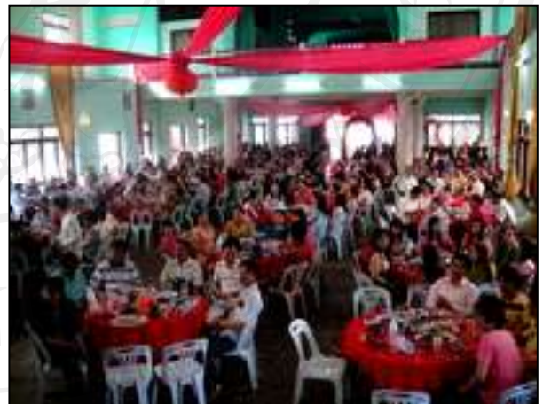
ภาพ 5.6 งานเลี้ยงฉลองงานแต่งงานแบบโต๊ะจีนภายในอาคารให้เช่าที่ท่าขี้เหล็ก

หมายเหตุ : บันทึกภาพถ่ายเมื่อวันที่ 20 เมษายน 2554