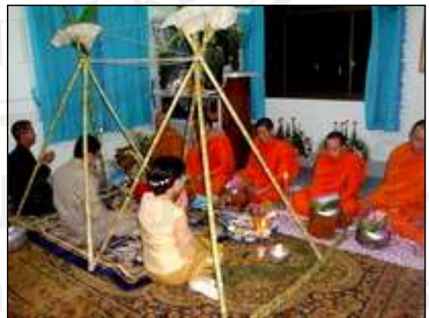
ภาพ 5.2 พิธีแต่งงาน มีการนิมนต์พระมาใส่บาตรและทำพิธีสืบชะตาภายในบ้านฝ่ายชาย

หมายเหตุ : บันทึกภาพถ่ายเมื่อวันที่ 20 มกราคม 2553