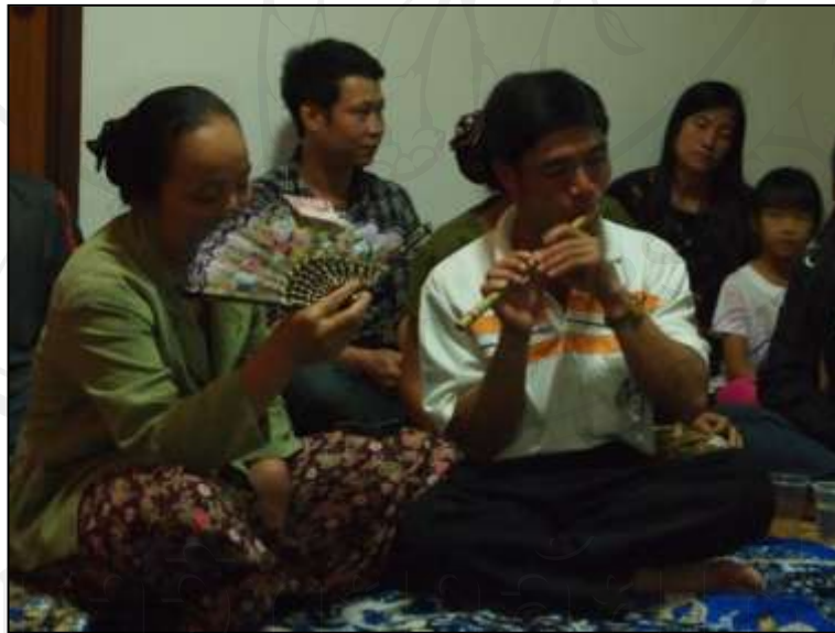
ภาพ 5.5 การขับลื้อ

การแต่งงานตามธรรมเนียมแบบลื้อจะมีการ “จับคำจับลื้อ” คือการร้องเพลงภาษาลื้อ โดยมีนักดนตรีผู้ชายเป่าปี่อันเล็กๆกับผู้หญิงหรือช่างขับถือพัดปิดหน้าขับร้อง การจับลื้อในงานแต่งงานจึงถือเป็นเอกลักษณ์ที่โดดเด่นของประเพณีการแต่งงานของชาวลื้อ ซึ่งปัจจุบันมิได้เห็นเฉพาะในสังคมาลื้อเมืองยองและสิบสองปันนา พอเสียงปี่เริ่ม จะมีคนส่งเสียง “เฮ้า เซ้ย เซ้ย ...” ถือเป็นการเริ่มต้นการขับเพลงลื้อ หลังจากนั้นผู้หญิงก็เริ่มร้อง ระหว่างที่จับคนที่นั่งฟังก็จะเอาธนบัตรใบละหนึ่งร้อยบาท (หรือแล้วแต่) วางไว้ที่พัด เพื่อเป็นกำลังใจให้กับคนร้อง จะมีการร้องเพลงสลับสับเปลี่ยนกันไป จากนั้นก็มีมาเรื่อยๆ คนแรกขับเสร็จ ก็มีปี่อีกคนร้องต่อ สับเปลี่ยนกันสองคน การขับหรือการคิดคำร้องจะคิดขึ้นมาสดๆ ณ ขณะนั้น โดยเนื้อหาจะร้องเกี่ยวกับเจ้าบ่าวเจ้าสาว การพบเจอกันของกลุ่มบ่าวสาว การอวยพร รวมถึงเรื่องราวต่างๆของกลุ่มบ่าวสาว การขับเพลงลื้อแบบสดๆนี้เป็นความสามารถเฉพาะบุคคลที่ต้องผ่านการฝึกฝนมาพอสมควร รวมถึงจะต้องเป็นคนารู้จักกับกลุ่มบ่าวสาวเป็นอย่างดีด้วย จึงจะสามารถร้องเพลงที่มีเนื้อหาเกี่ยวกับกลุ่มบ่าวสาวได้ ระหว่างการขับเพลงลื้อ