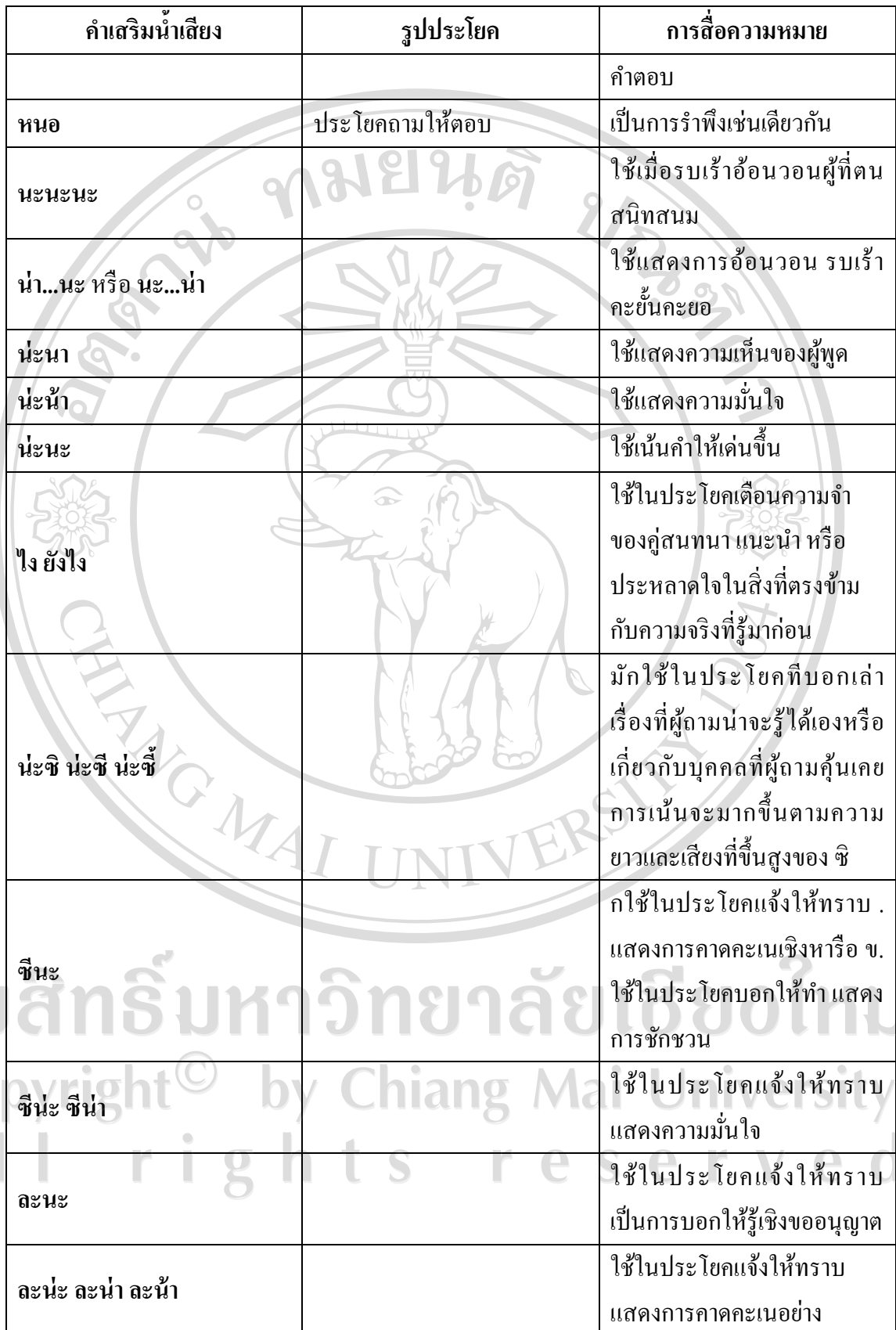
ตาราง 12 (ต่อ)